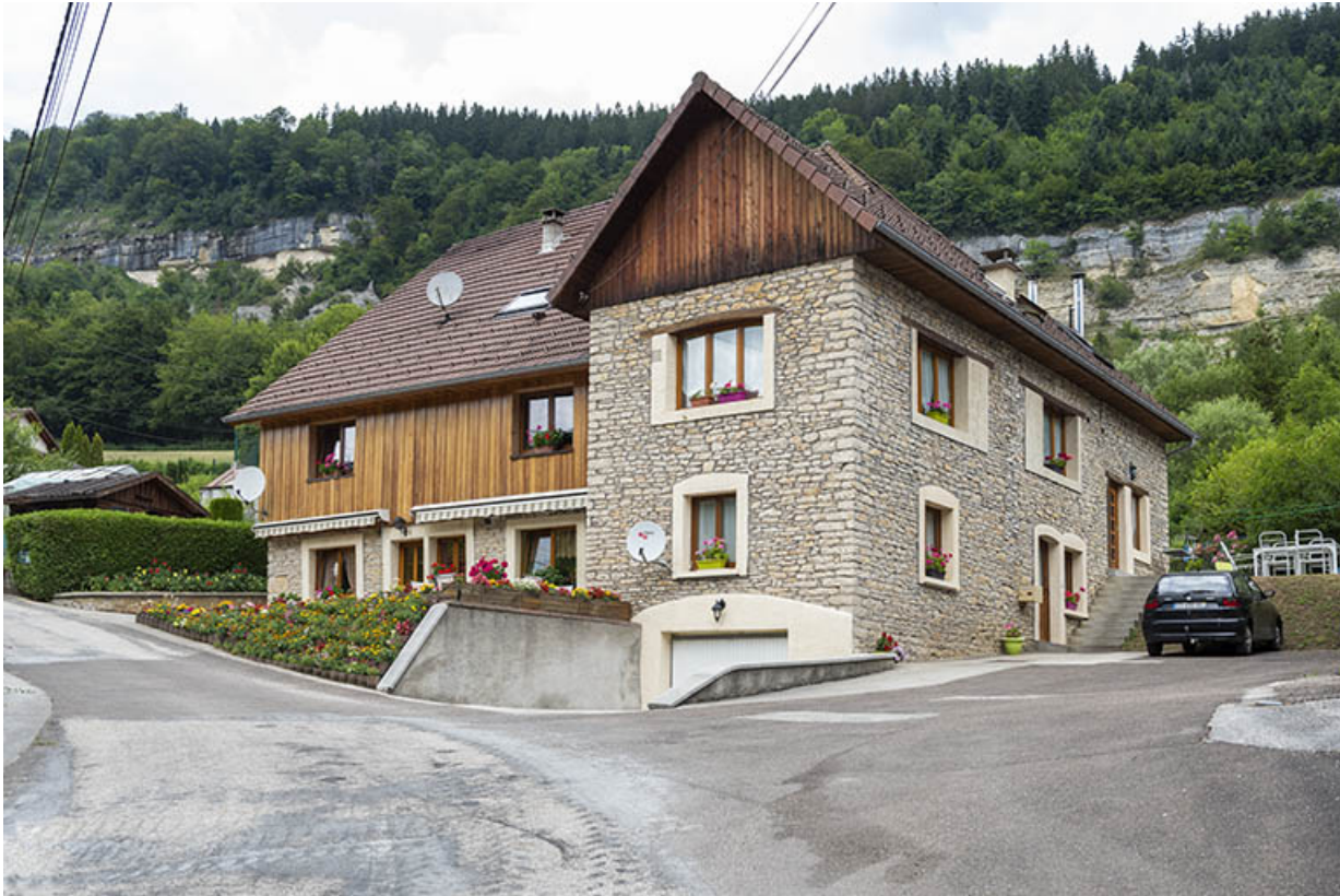
Vue d'ensemble, depuis le sud.