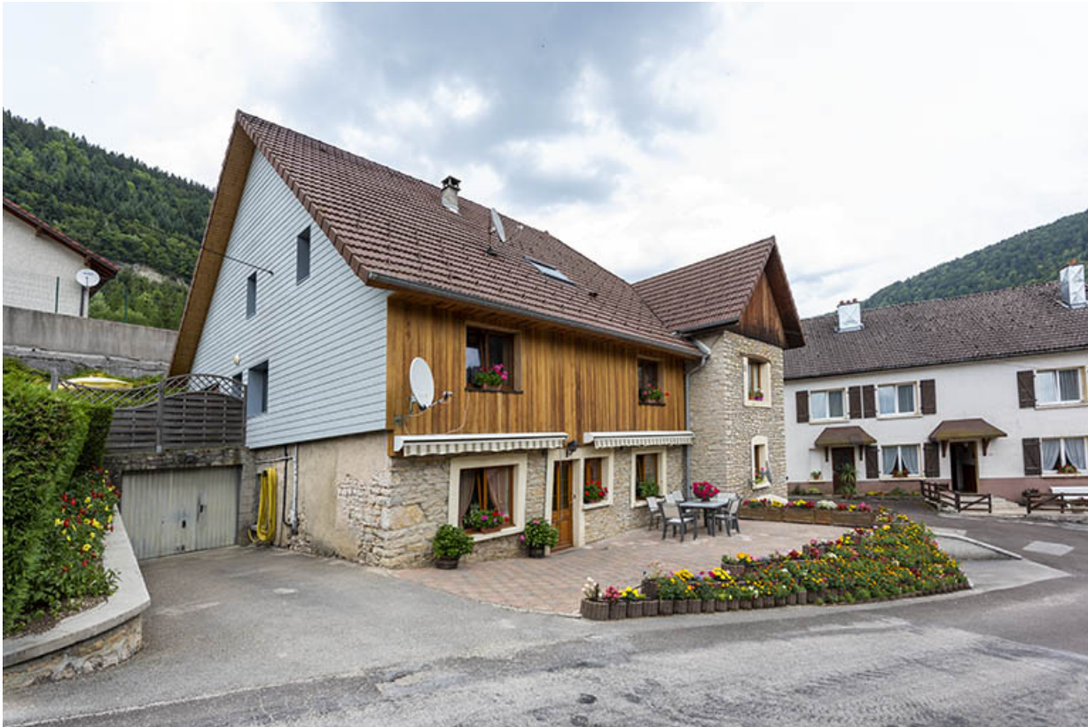
Vue d'ensemble, depuis l'ouest.