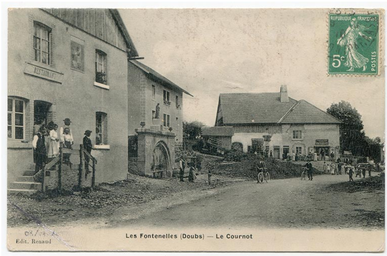
Les Fontenelles (Doubs) - Le Cournot, 1er quart 20e siècle [avant 1910 ?].