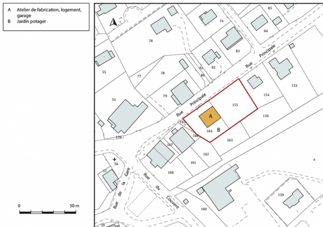
Plan-masse et de situation. Extrait du plan cadastral, 2018, section AB. 25, Les Fontenelles, 30 rue Principale