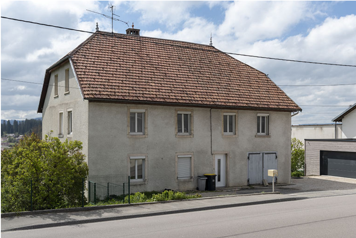
Façades antérieure et latérale gauche.