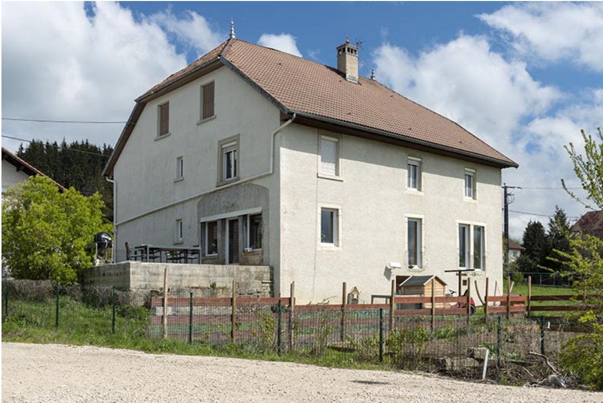
Façades postérieure et latérale droite.