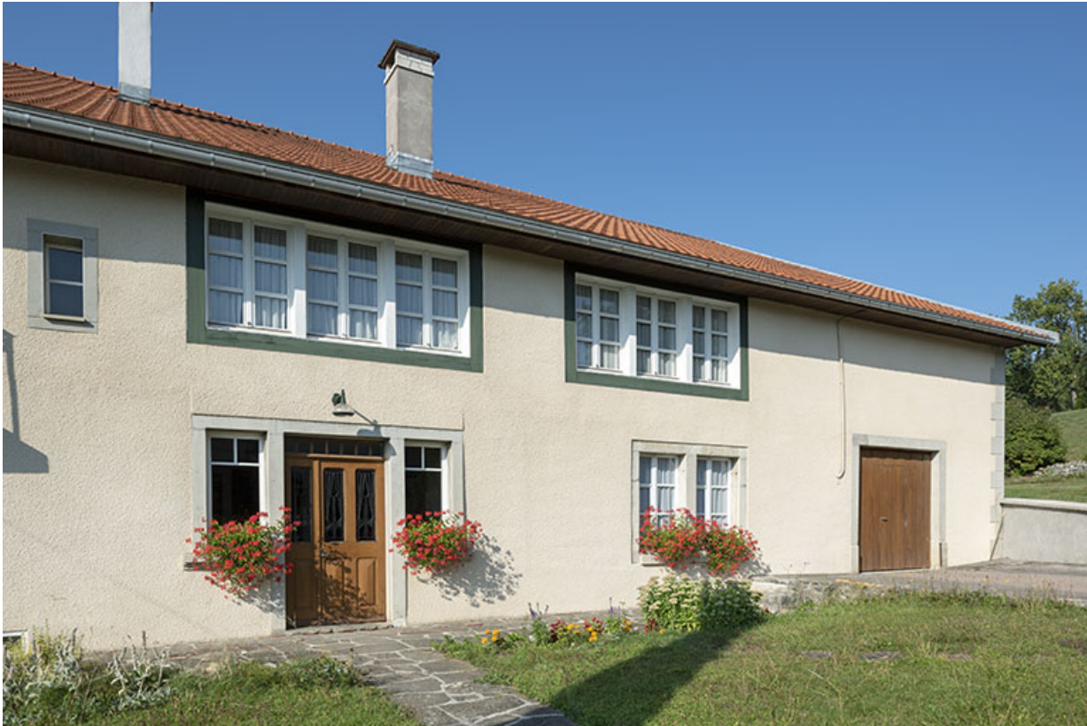
Façade antérieure, de trois quarts gauche.