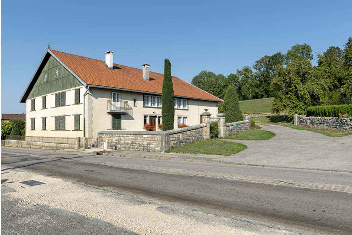
Vue d'ensemble, depuis l'est.