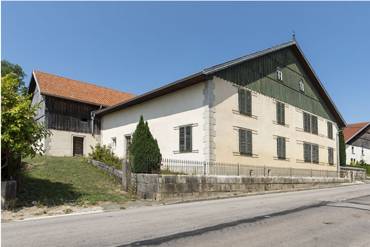
Façades postérieure et latérale gauche.