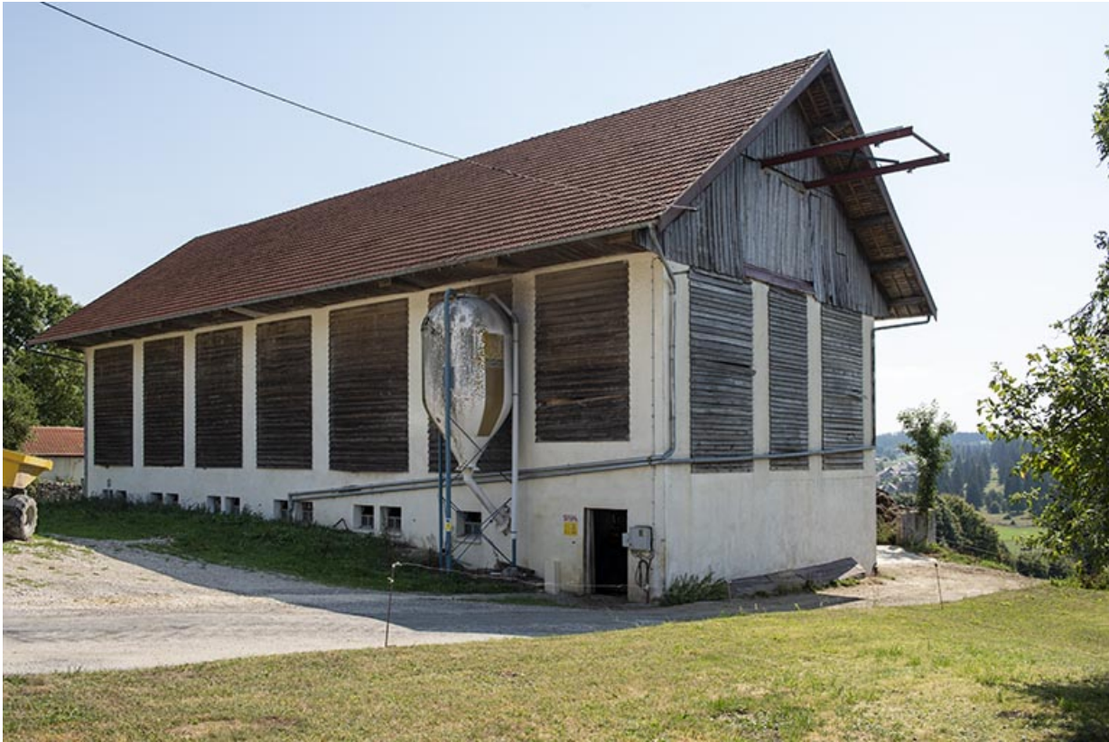
Bâtiment d'exploitation de l'autre côté de la rue.