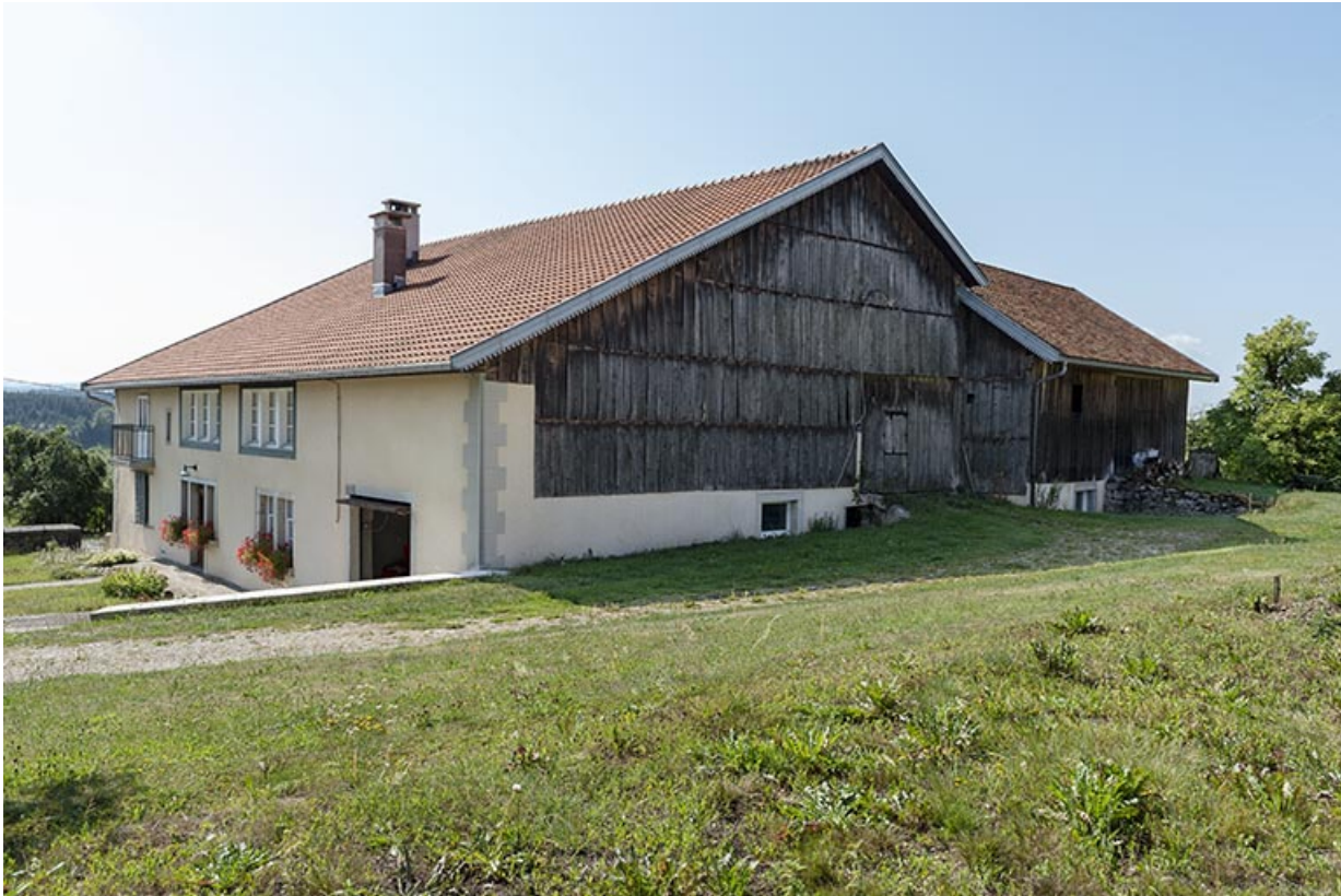
Façades antérieure et latérale droite.