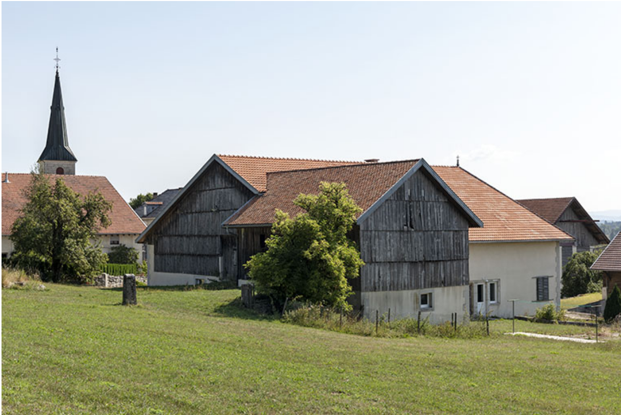
Vue d'ensemble, depuis l'ouest.