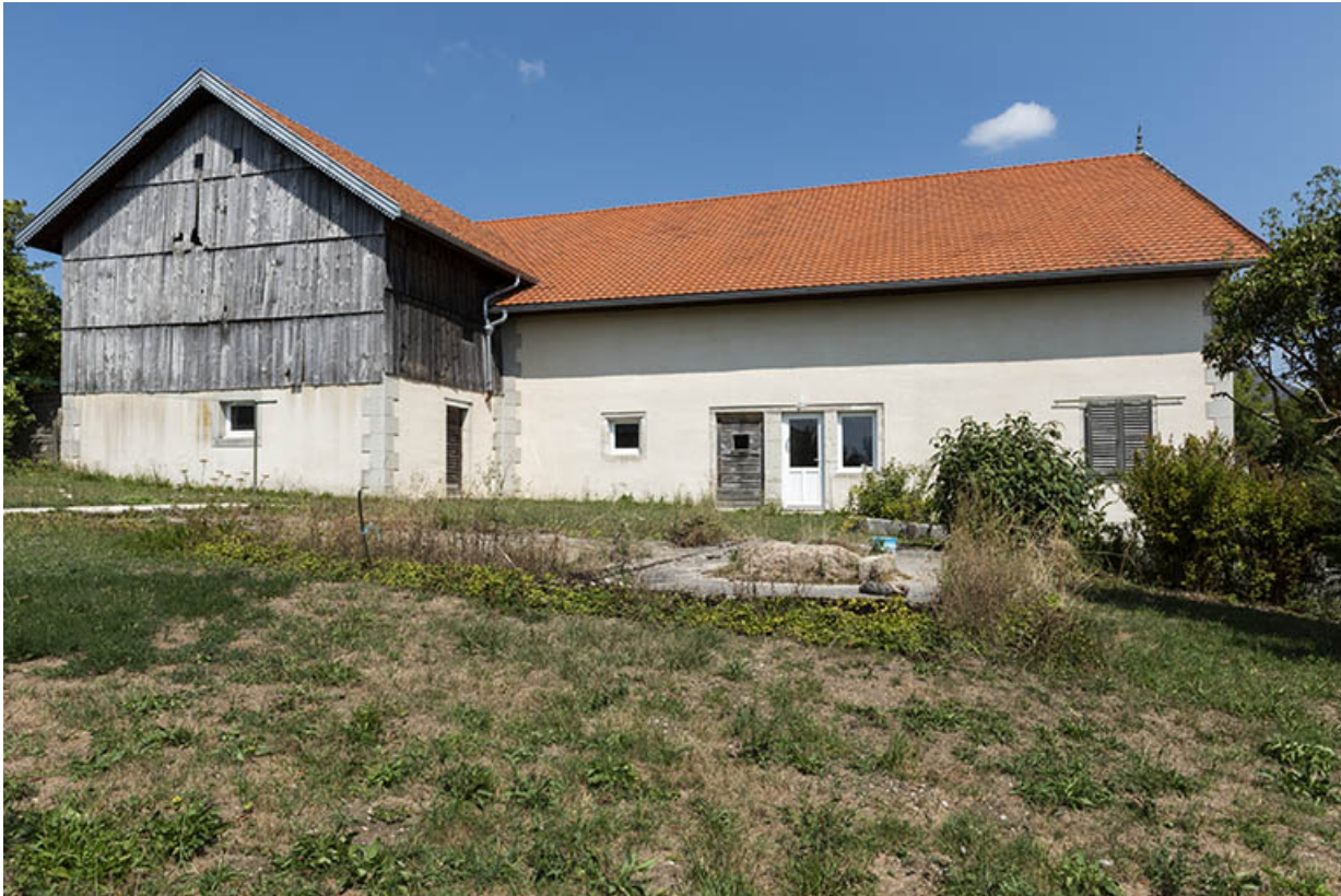
Façade postérieure, de trois quarts droite.