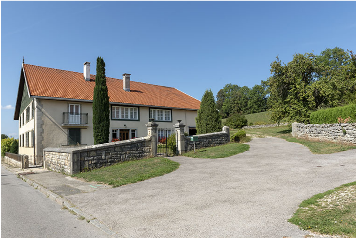
Grille et façade antérieure, de trois quarts gauche.