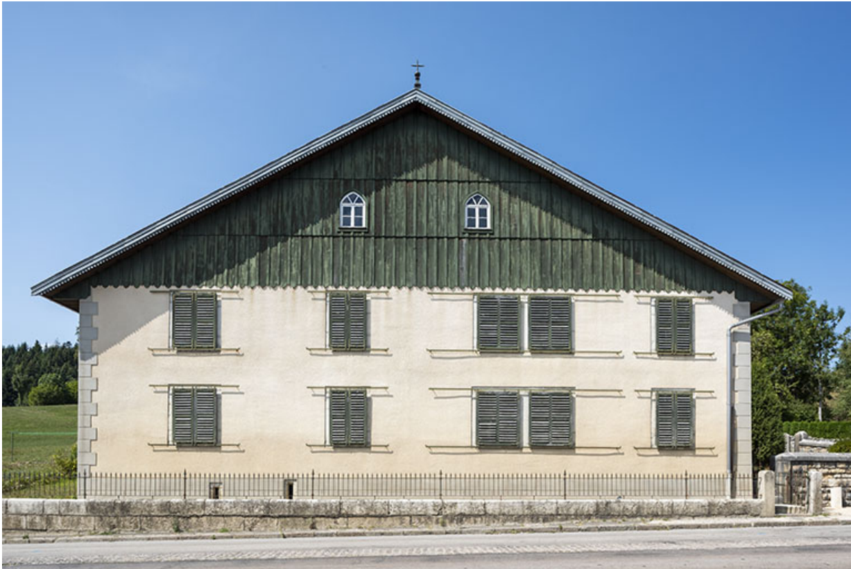
Façade latérale gauche.