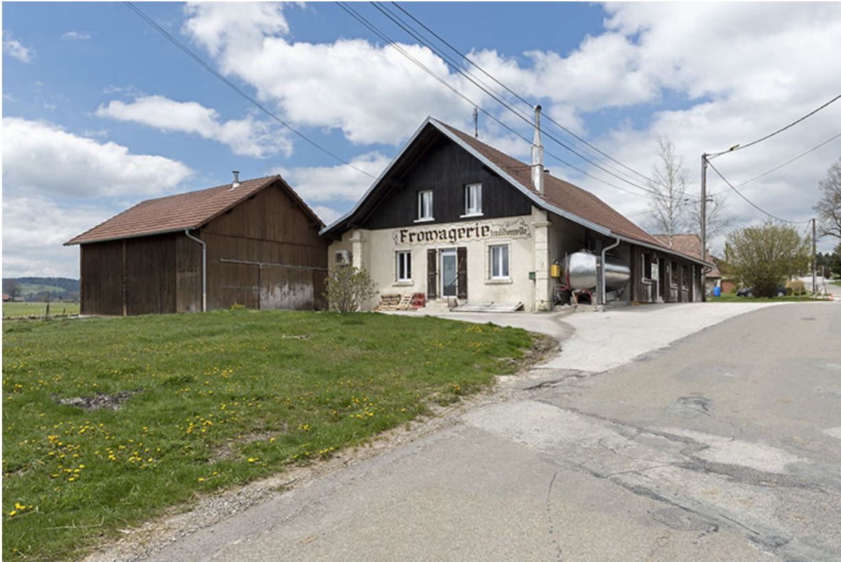
Vue d'ensemble, depuis le sud-est (avec la pièce d'affinage récente à gauche). 25, Bonnétagé, 6 route de Cerneux-Monnot, lieudit : les Cerneux-Monnots