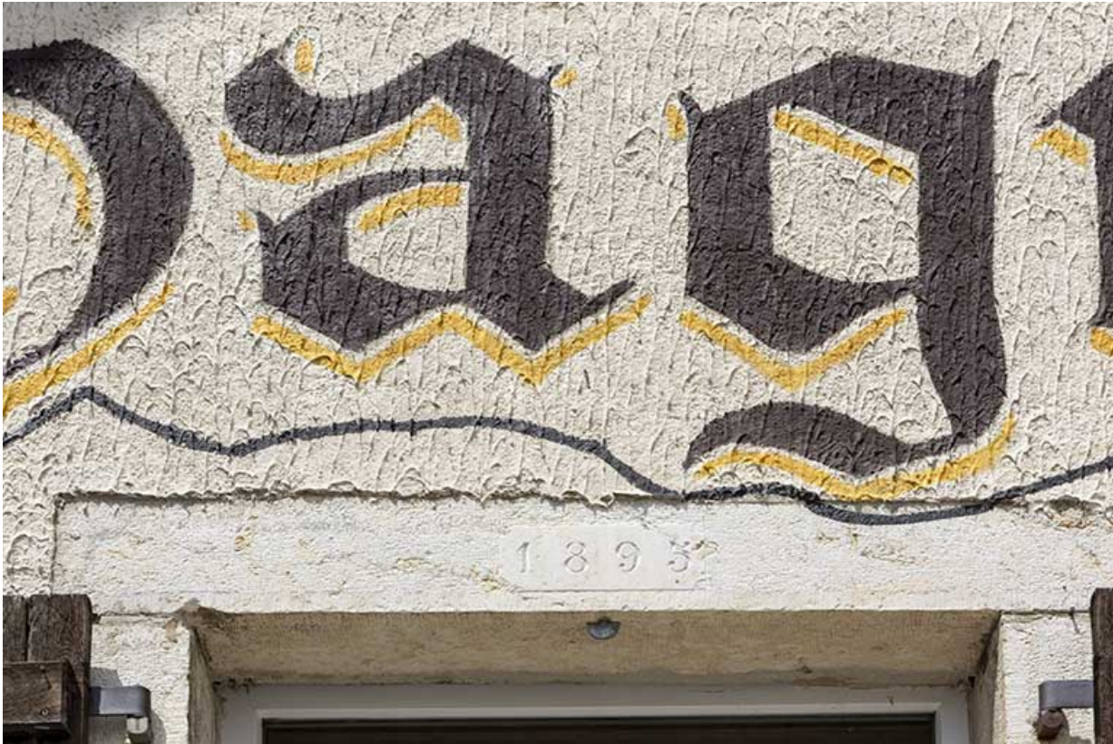
Façade antérieure : linteau daté 1895.

25, Bonnétagé, 6 route de Cerneux-Monnot, lieudit : les Cerneux-Monnots