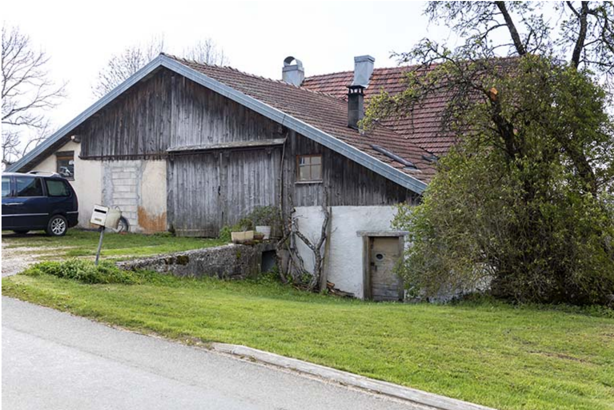
Façade nord (côté rue), de trois quarts droite.

25, Bonnétagé, 1 rue de la Fontaine, lieudit : le Village Bas