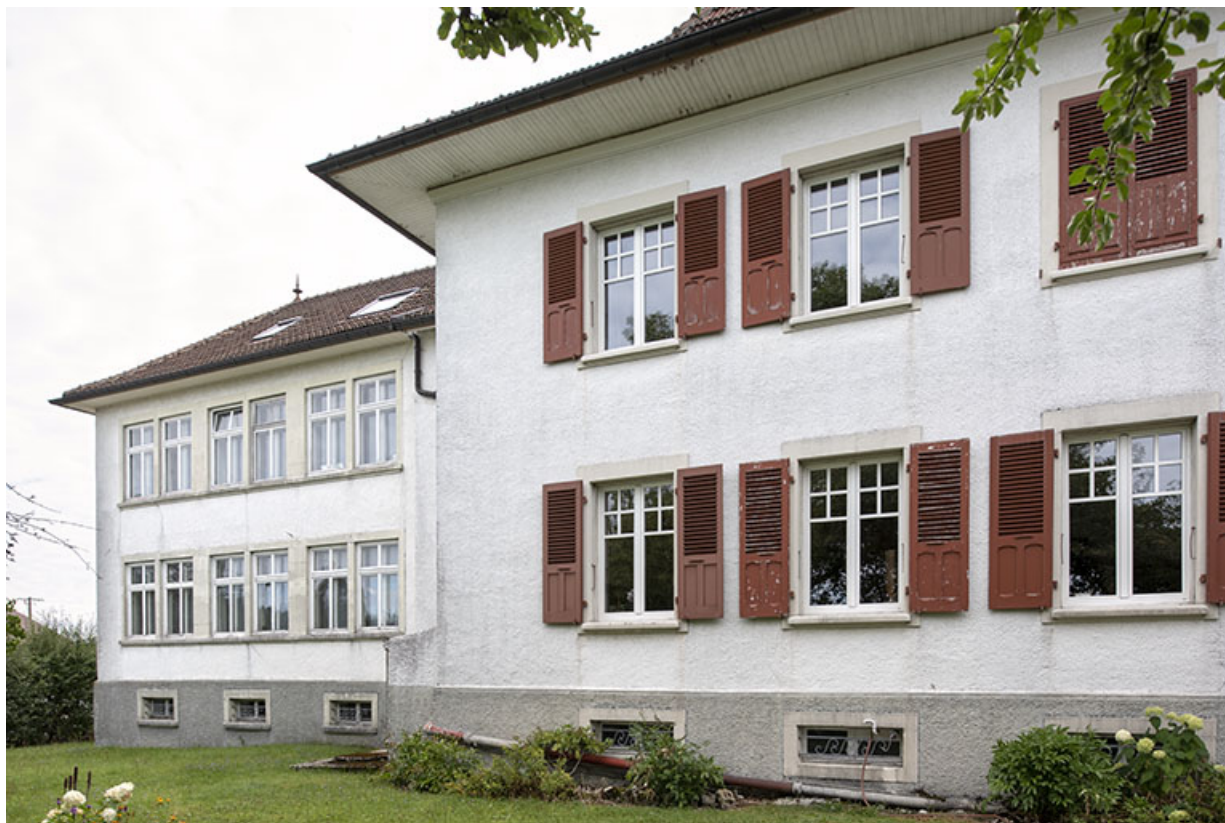
Maison (façade latérale gauche) et usine (façade postérieure), de trois quarts droite. 25, Bonnétagé, 1 rue de l' Helvétie, lieudit : le Grand Communal