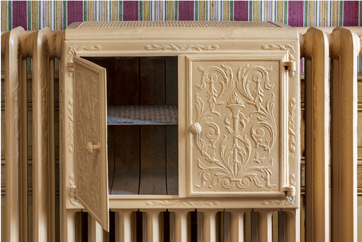
Maison, salon : chauffe-plat du radiateur.

25, Bonnétagé, 1 rue de l' Helvétie, lieudit : le Grand Communal