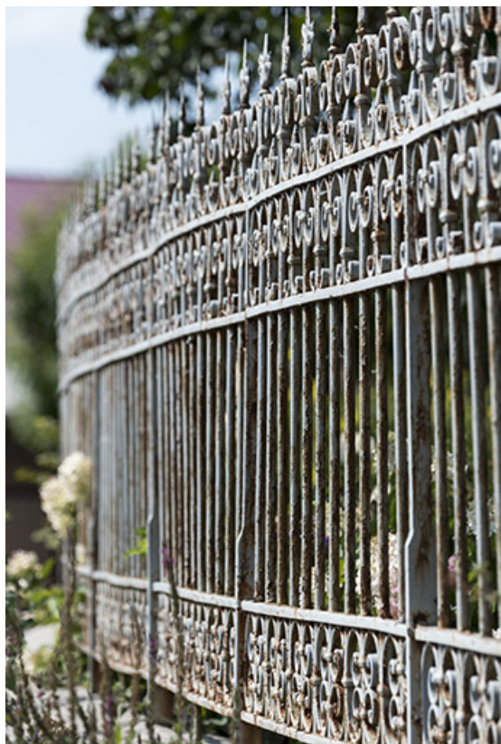
Clôture : grille, vue en enfilade.

25, Bonnétagé, 1 rue de l' Helvétie, lieudit : le Grand Communal