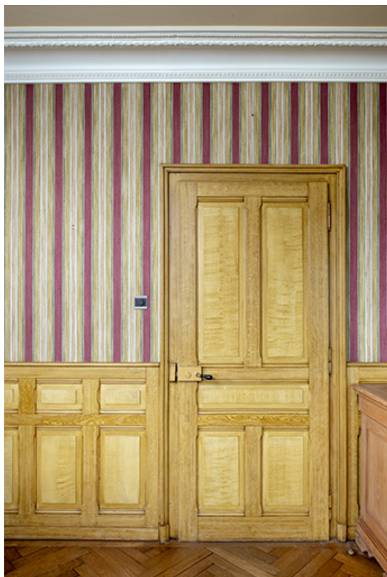
Maison, salon : porte et boiseries avec décor de faux bois. 25, Bonnétagé, 1 rue de l' Helvétie, lieudit : le Grand Communal