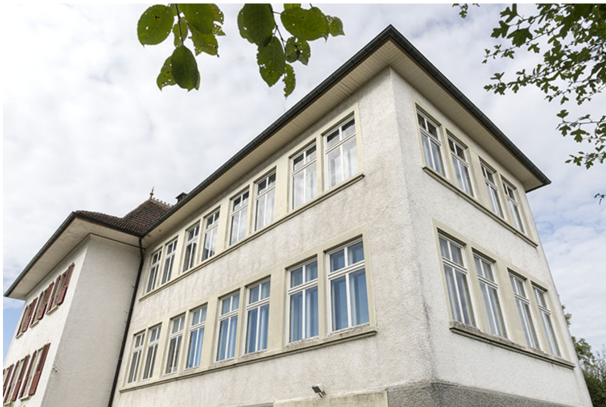
Usine : façades antérieure et latérale droite, vues en contre-plongée. 25, Bonnétagé, 1 rue de l' Helvétie, lieudit : le Grand Communal