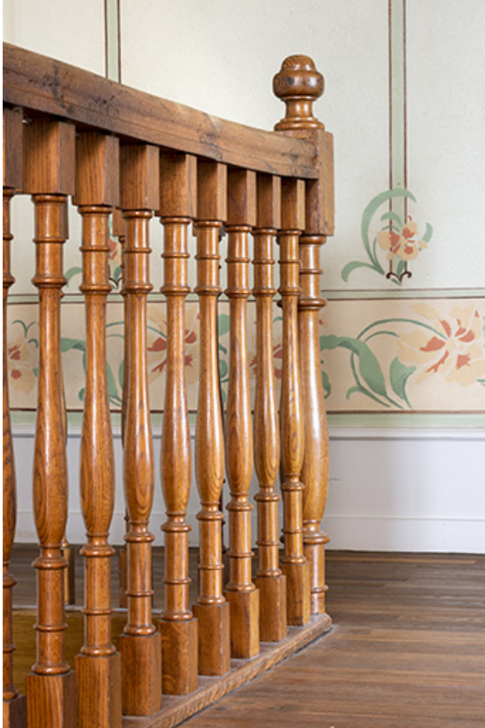
Maison : décor peint du palier à l'étage.

25, Bonnétable, 1 rue de l' Helvétie, lieudit : le Grand Communal