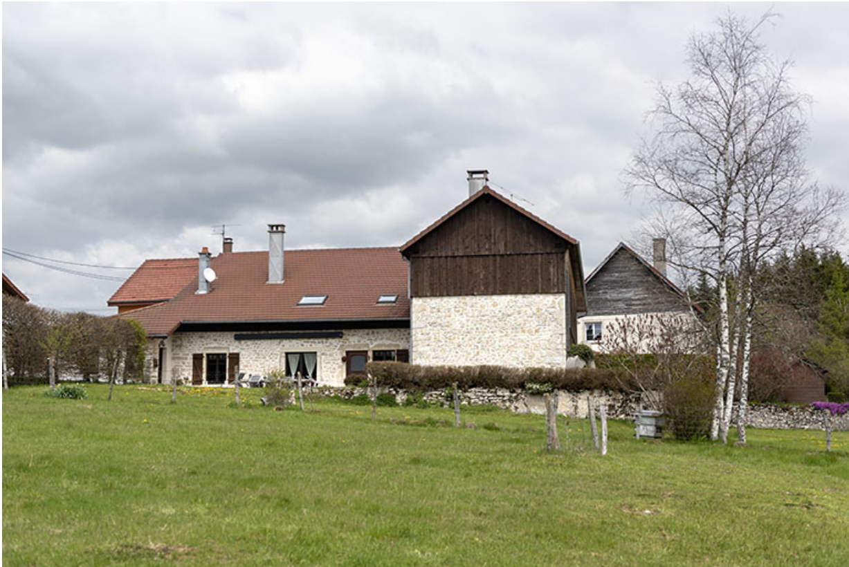
Façade latérale droite.

25, Bonnétagé, 12 rue de Vuillemenots, lieudit : le Grand Communal