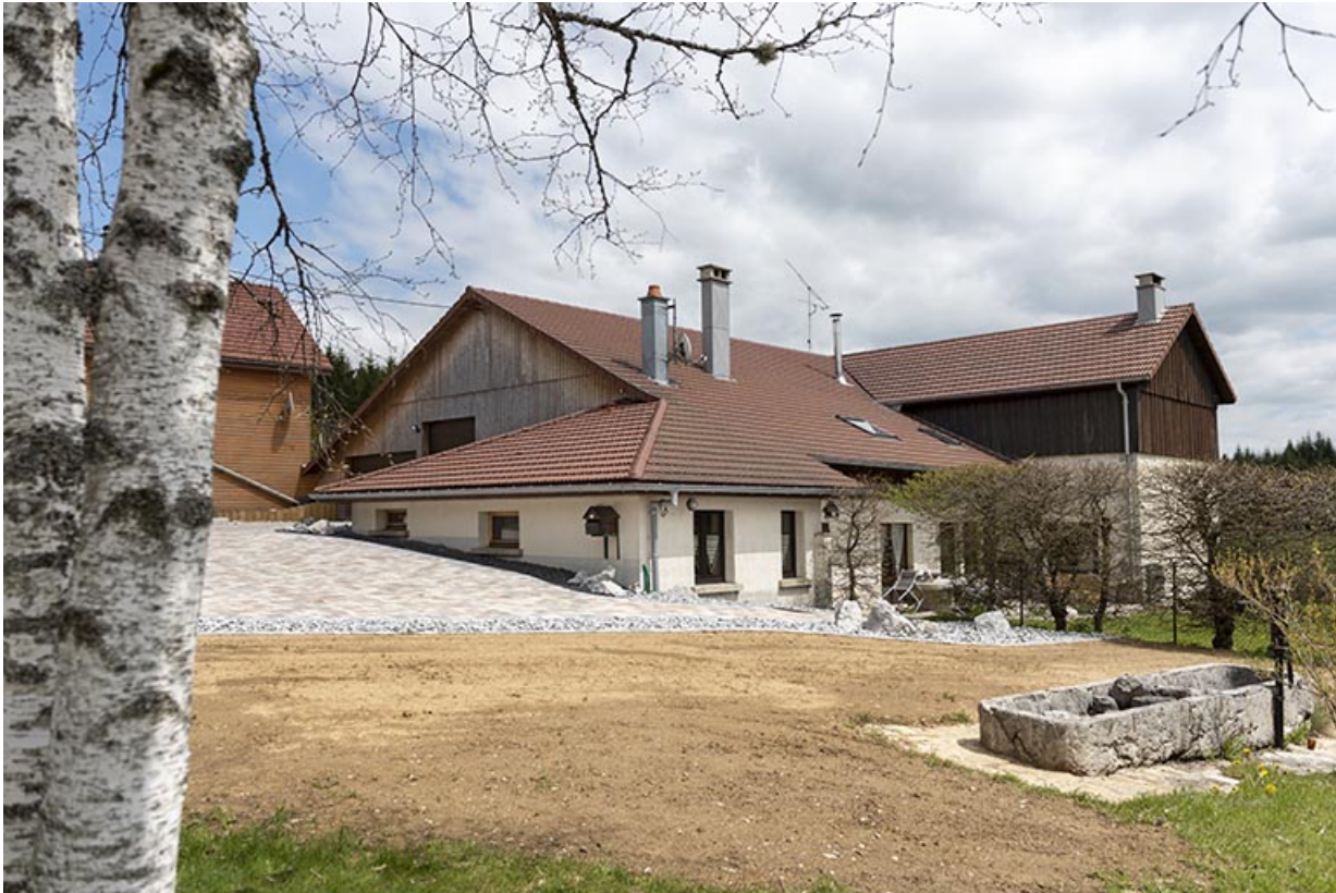
Vue d'ensemble, depuis l'ouest (façades antérieure et latérale droite). L'abreuvoir est visible à droite.

25, Bonnétagé, 12 rue de Vuillemenots, lieudit : le Grand Communal