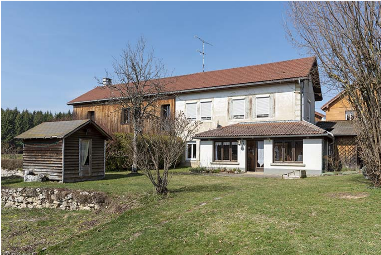
Façade postérieure, de trois quarts droite.

25, Bonnétagé, 12 rue de Vuillemenots, lieudit : le Grand Communal