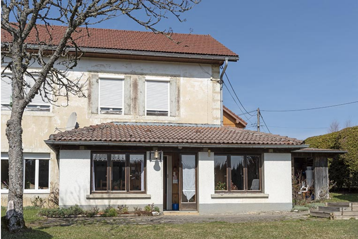
Façade postérieure : extension orientale.

25, Bonnétagé, 12 rue de Vuillemenots, lieudit : le Grand Communal