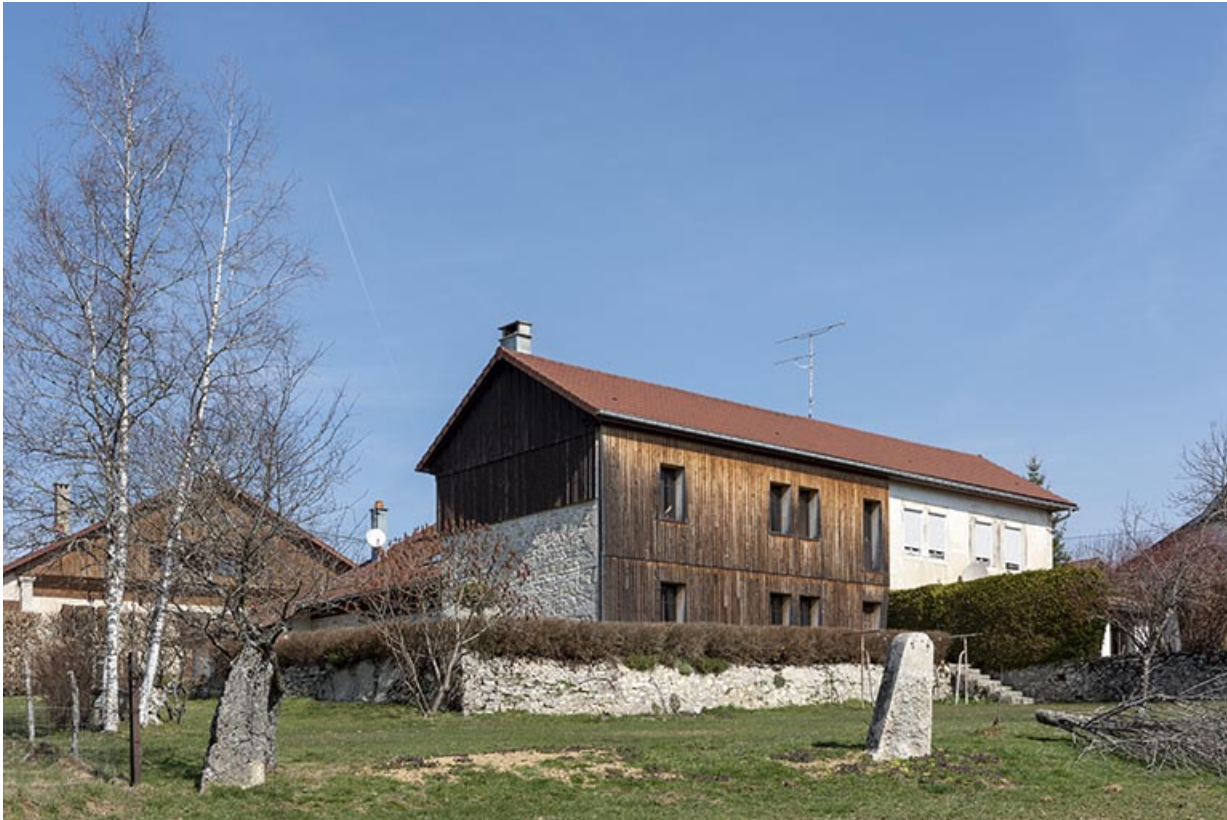
Façade postérieure, de trois quarts gauche.

25, Bonnétagé, 12 rue de Vuillemenots, lieudit : le Grand Communal