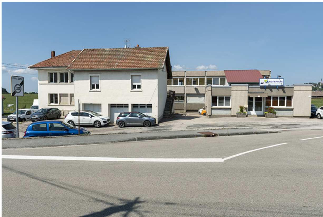
Vue d'ensemble depuis l'est : bâtiments anciens à gauche, récents à droite.

25, Bonnétable, 8-10 route de Besançon, lieudit : le Grand Communal