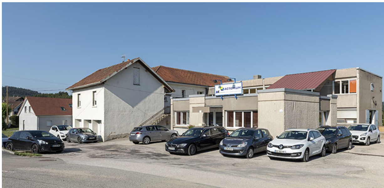
Bâtiments récents : façade antérieure, de trois quarts droite.

25, Bonnétagé, 8-10 route de Besançon, lieudit : le Grand Communal