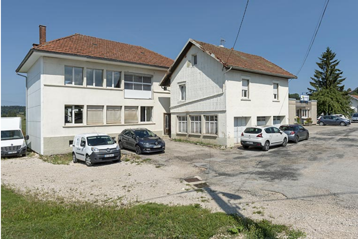
Bâtiments anciens : façade antérieure, de trois quarts gauche.

25, Bonnétagé, 8-10 route de Besançon, lieudit : le Grand Communal