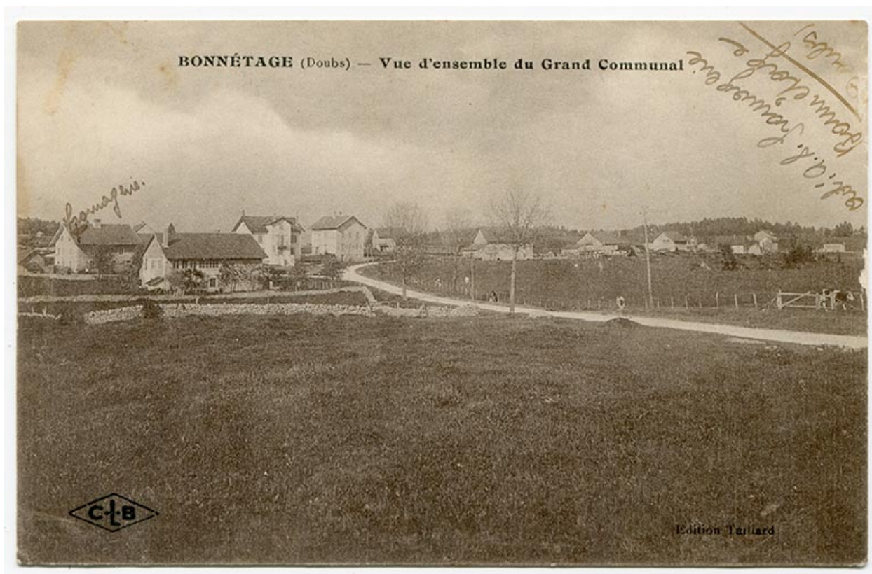
Bonnétagé (Doubs) - Vue d'ensemble du Grand Communal, 1er quart 20e siècle [entre 1914 et 1920].

25, Bonnétagé, 4 route de Besançon, lieudit : le Grand Communal