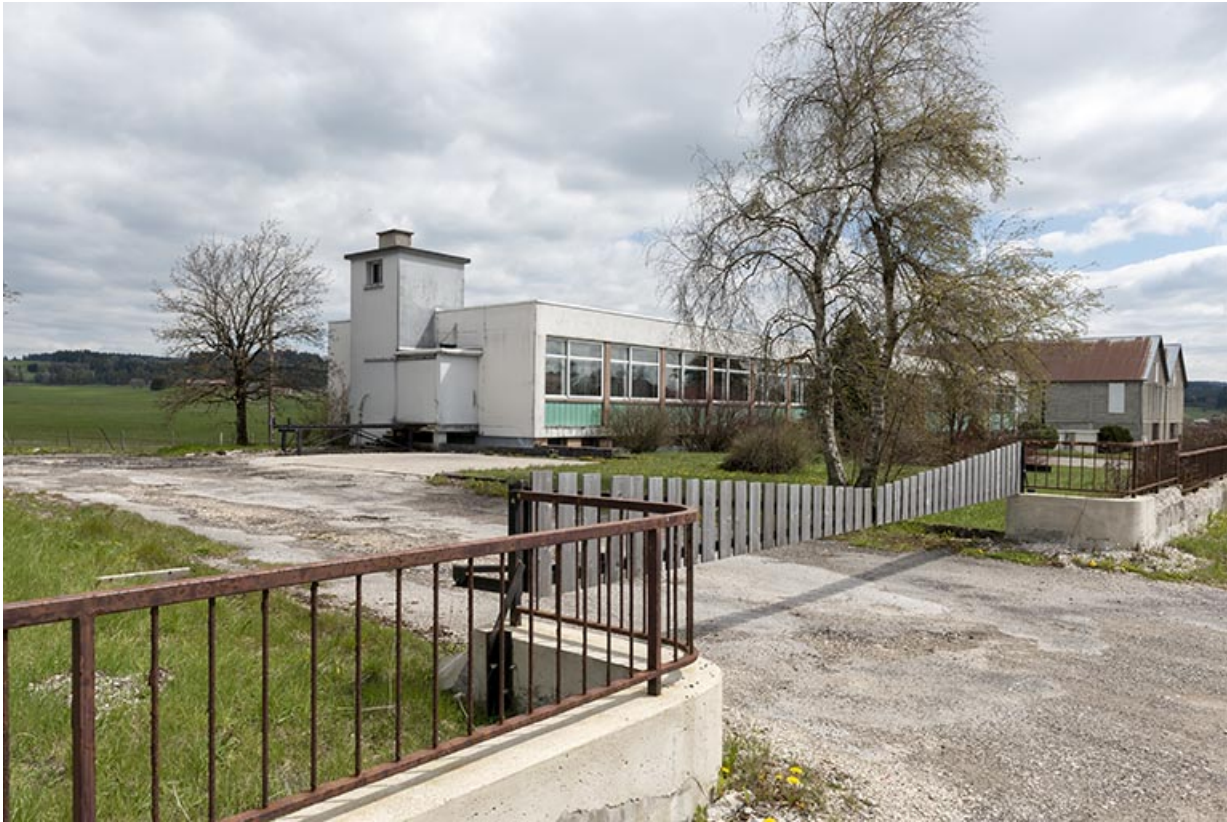
Vue d'ensemble depuis le nord (façades antérieure et latérale gauche).

25, Le Russey, 67 avenue de Lattre de Tassigny