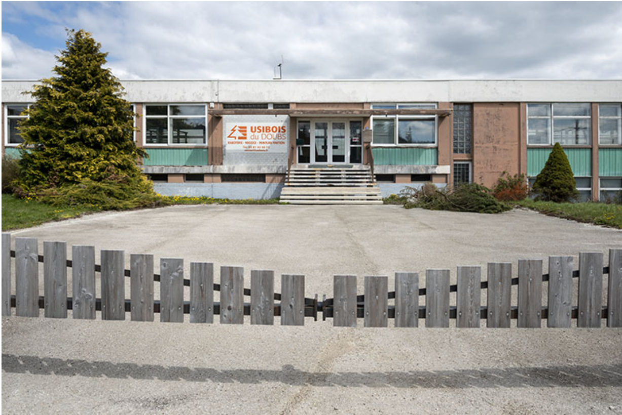
Façade antérieure : entrée.

25, Le Russey, 67 avenue de Lattre de Tassigny