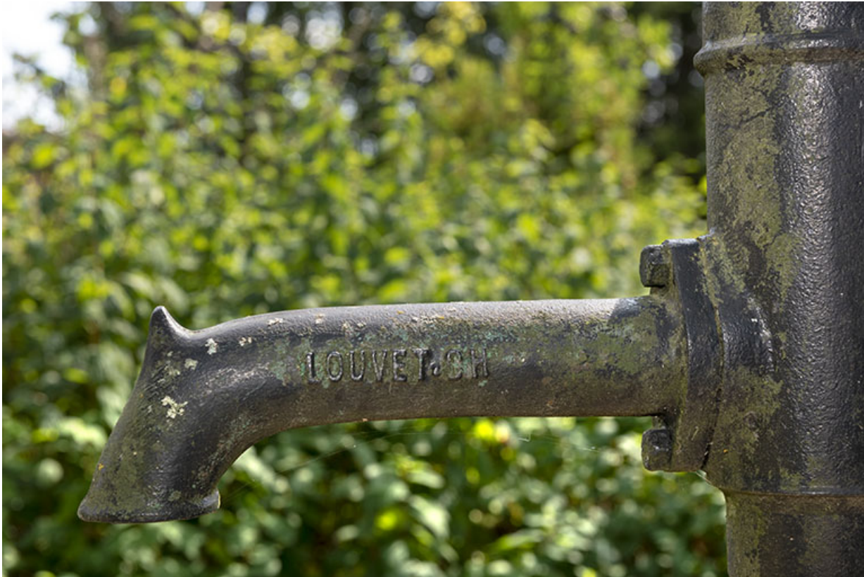
Pompe Louvet, à Maîche : inscription.

25, Le Russey, 64 avenue de Lattre de Tassigny