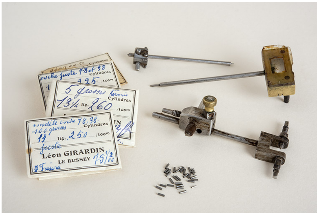
Eléments de machines et paquets de cylindres. Au premier plan au centre : cylindres non encochés.

25, Le Russey, 64 avenue de Lattre de Tassigny