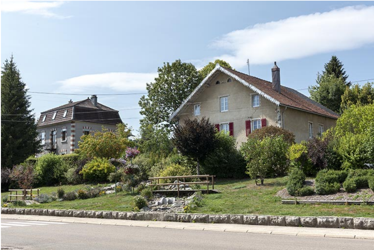
Vue d'ensemble, depuis le nord-est.

25, Le Russey, 64 avenue de Lattre de Tassigny