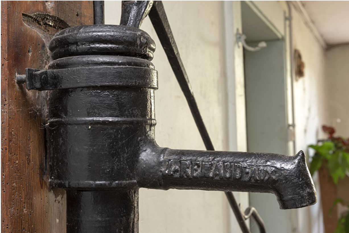
Intérieur : inscription sur la pompe Renaud.

25, Le Russey, 64 avenue de Lattre de Tassigny