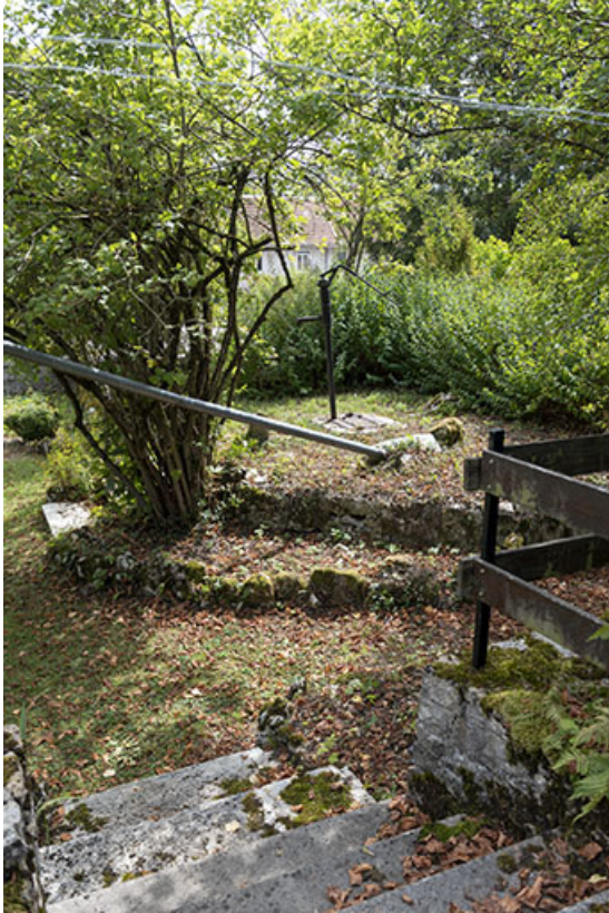
Citerne et sa pompe manuelle Louvet.

25, Le Russey, 64 avenue de Lattre de Tassigny