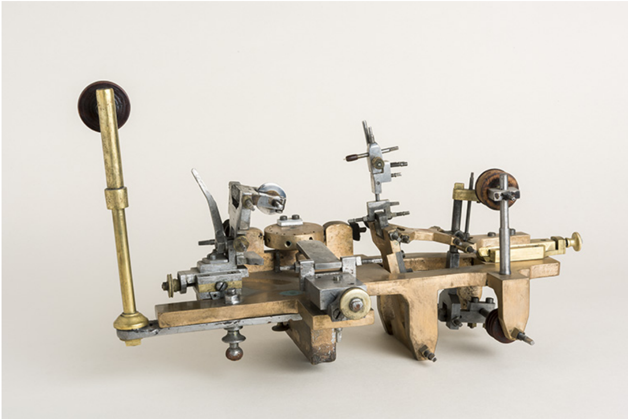
Machine à "passer les levées".

25, Le Russey, 64 avenue de Lattre de Tassigny