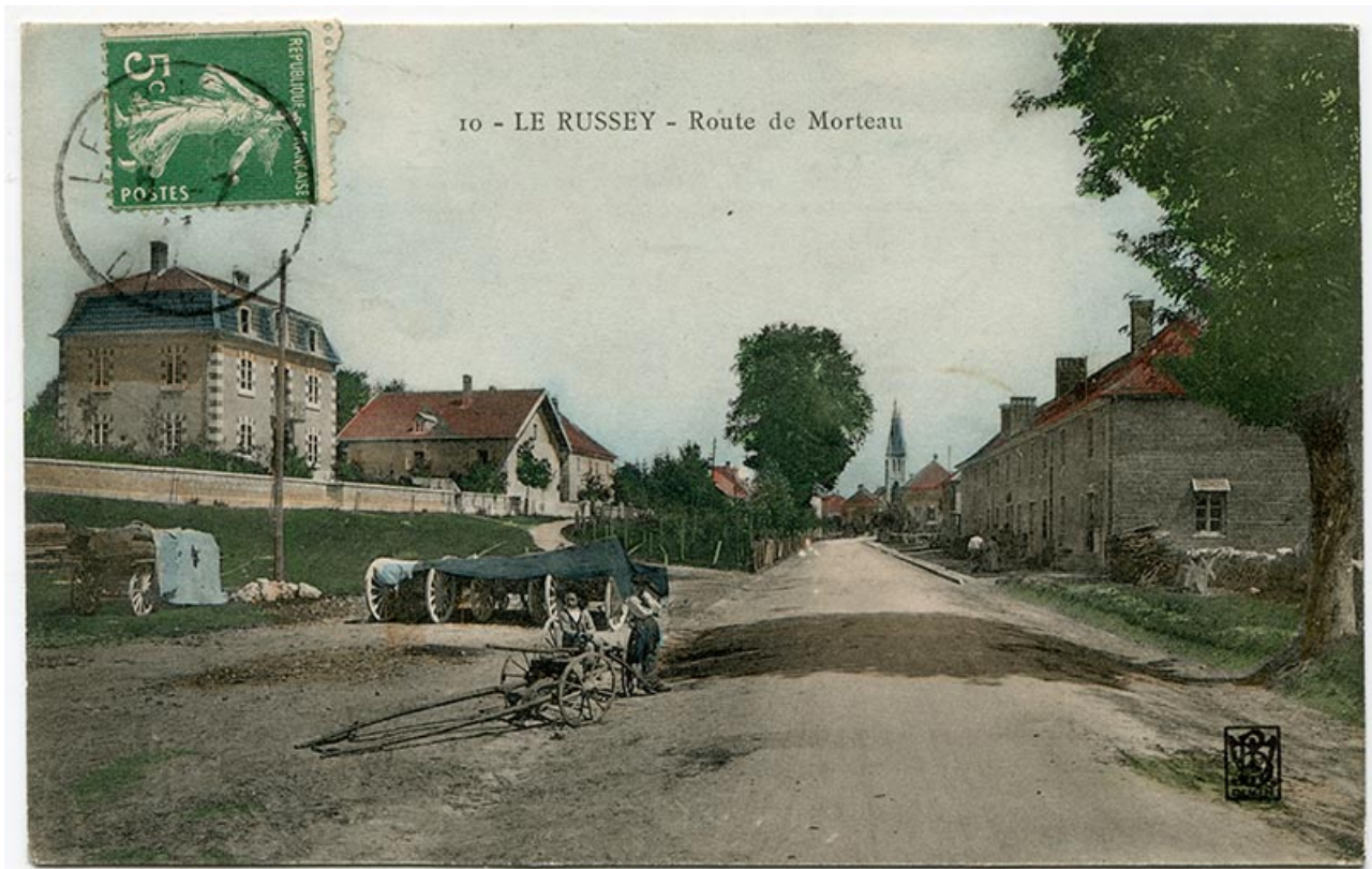
10 - Le Russey - Route de Morteau, 1er quart 20e siècle [entre 1904 et 1909]. La maison est la deuxième à gauche. Les fenêtres multiples ne sont pas encore percées à l'étage de la façade latérale gauche.

25, Le Russey, 64 avenue de Lattre de Tassigny