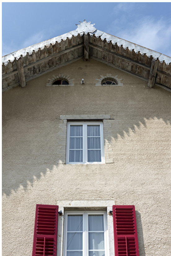
Façade antérieure : pignon.

25, Le Russey, 64 avenue de Lattre de Tassigny