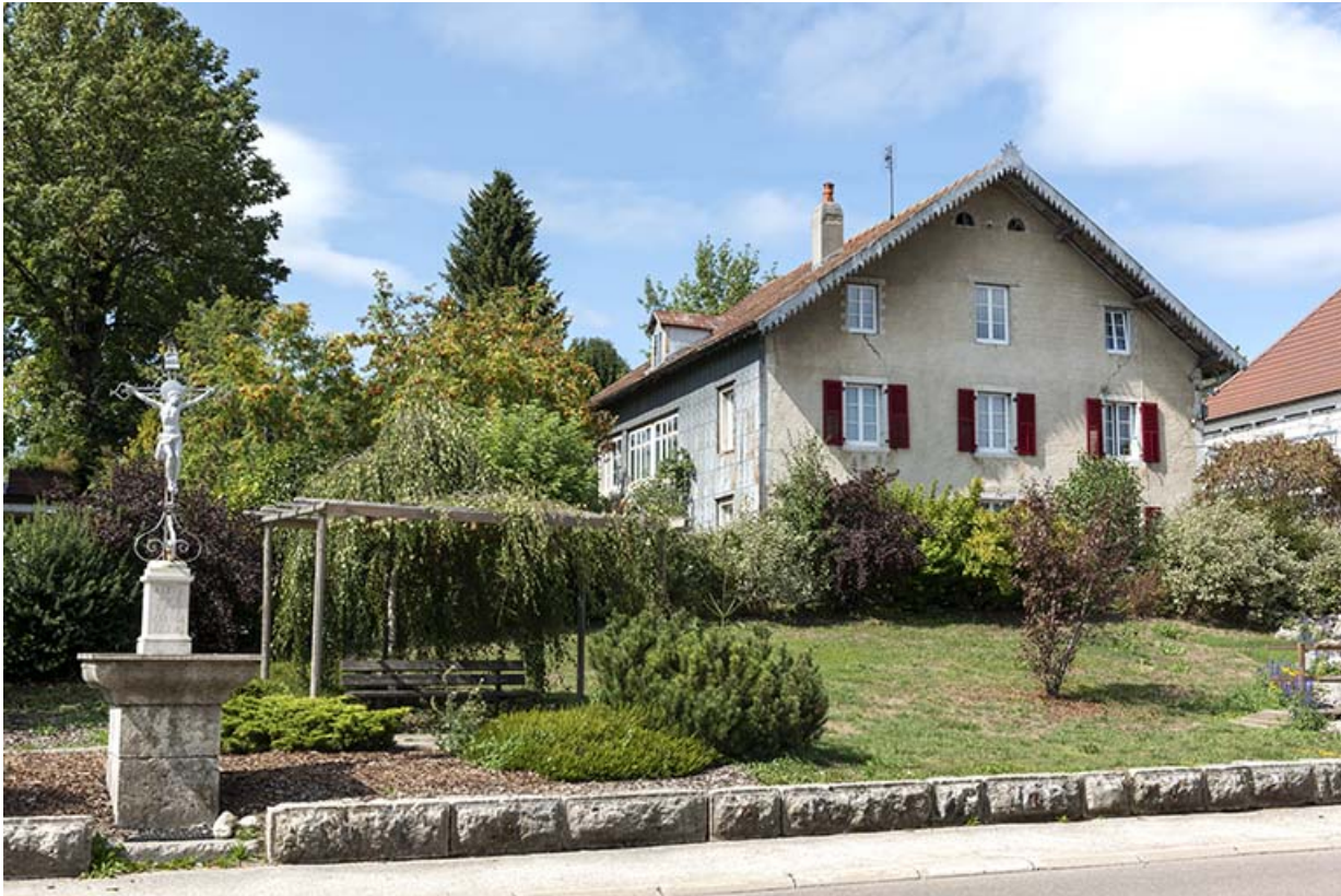
Vue d'ensemble, depuis le sud.

25, Le Russey, 64 avenue de Lattre de Tassigny