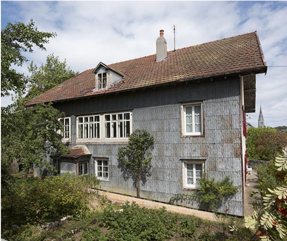
Façade latérale gauche.

25, Le Russey, 64 avenue de Lattre de Tassigny