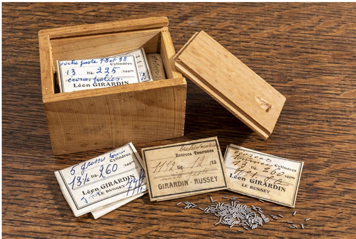
Boîte pour expédition d'écorces de cylindres et de cylindres.

25, Le Russey, 64 avenue de Lattre de Tassigny