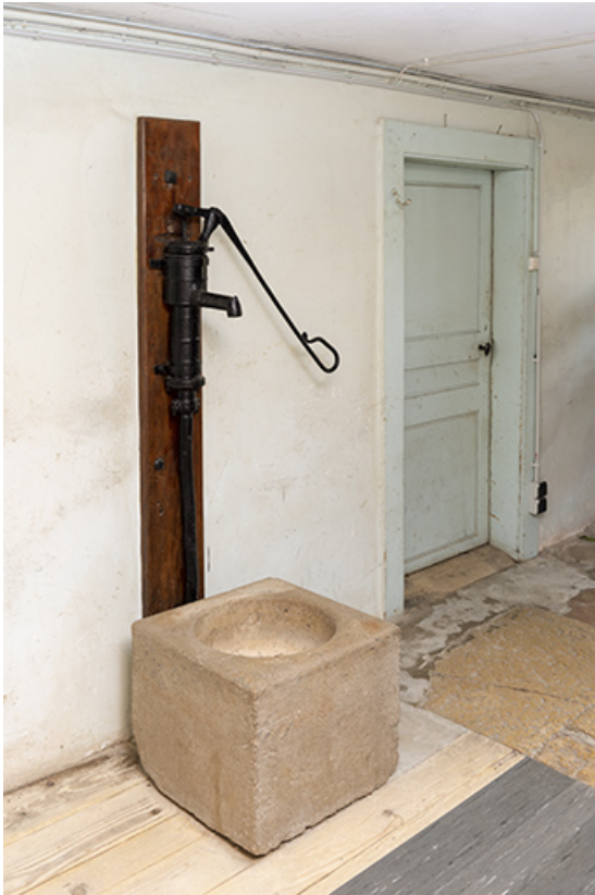
Intérieur : pompe manuelle Renaud, des Fontenelles. 25, Le Russey, 64 avenue de Lattre de Tassigny