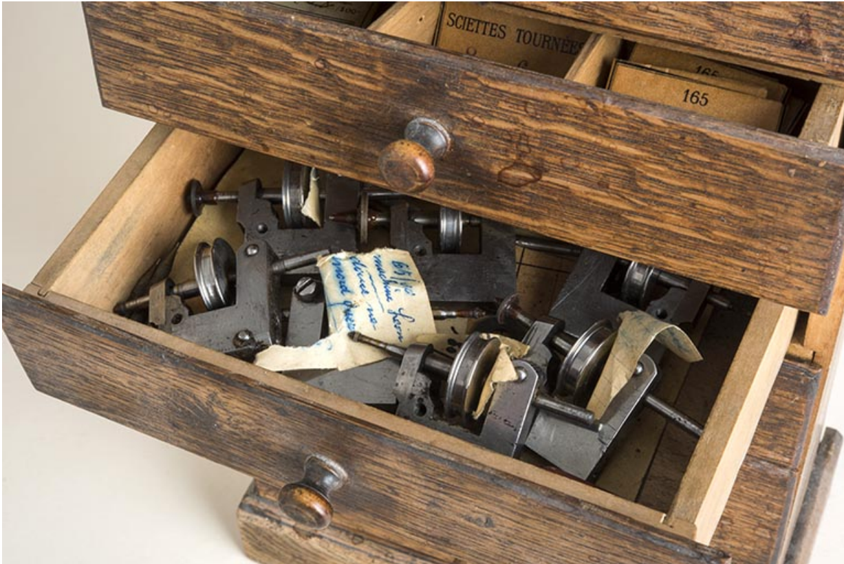
Meuble d'horloger : tiroir contenant des éléments de machines.

25, Le Russey, 64 avenue de Lattre de Tassigny