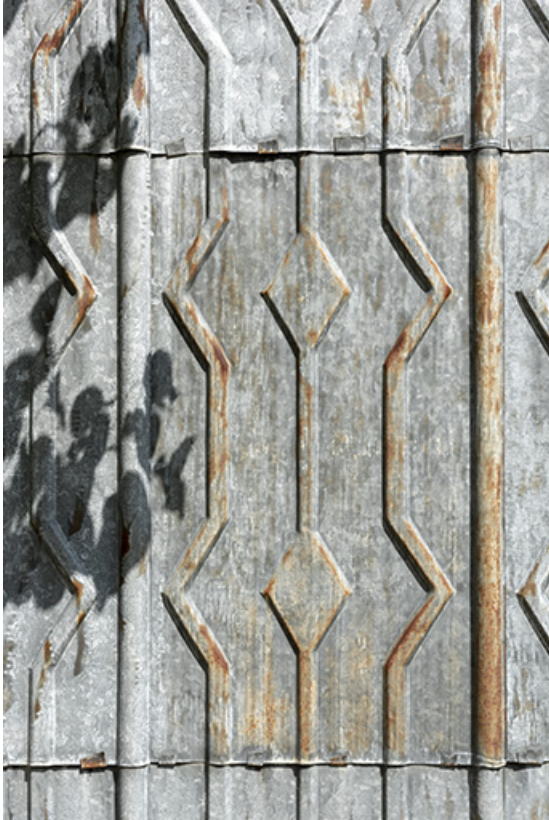
Façade latérale gauche : détail de l'essentage métallique.

25, Le Russey, 64 avenue de Lattre de Tassigny