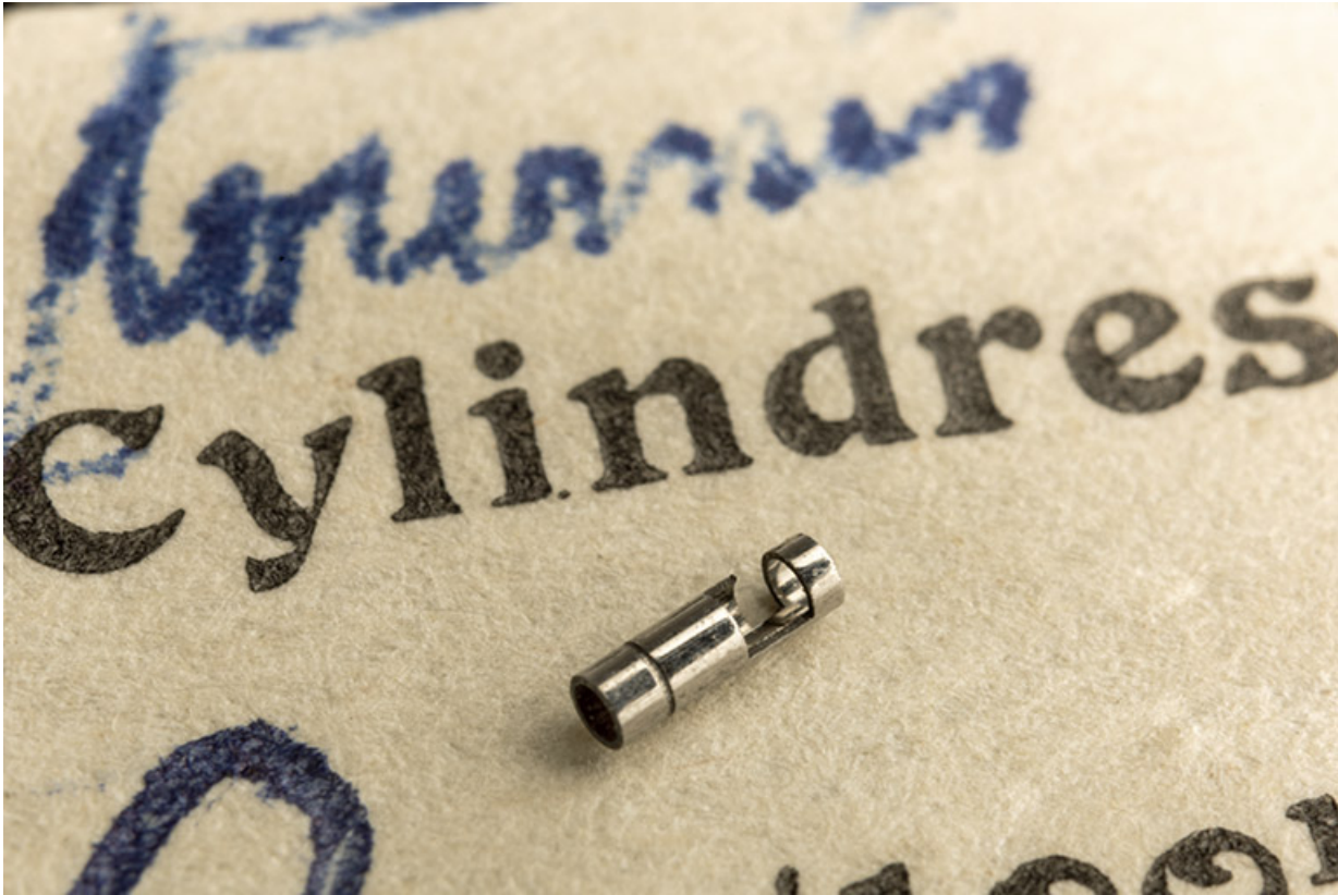
Ecorce de cylindre achevée et polie.

25, Le Russey, 64 avenue de Lattre de Tassigny