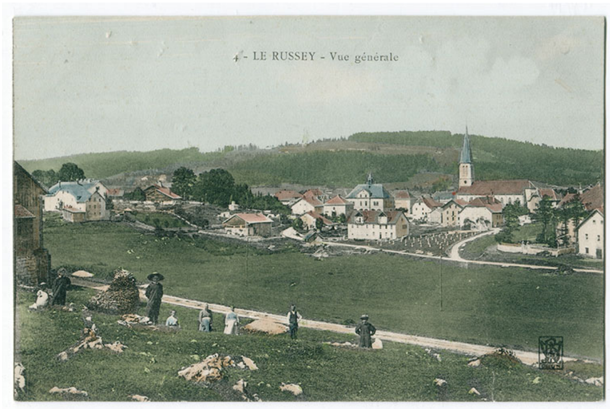
4 - Le Russey - Vue générale [depuis l'est], 1er quart 20e siècle [entre 1904 et 1909].

25, Le Russey, 5 et 5 bis rue Clemenceau