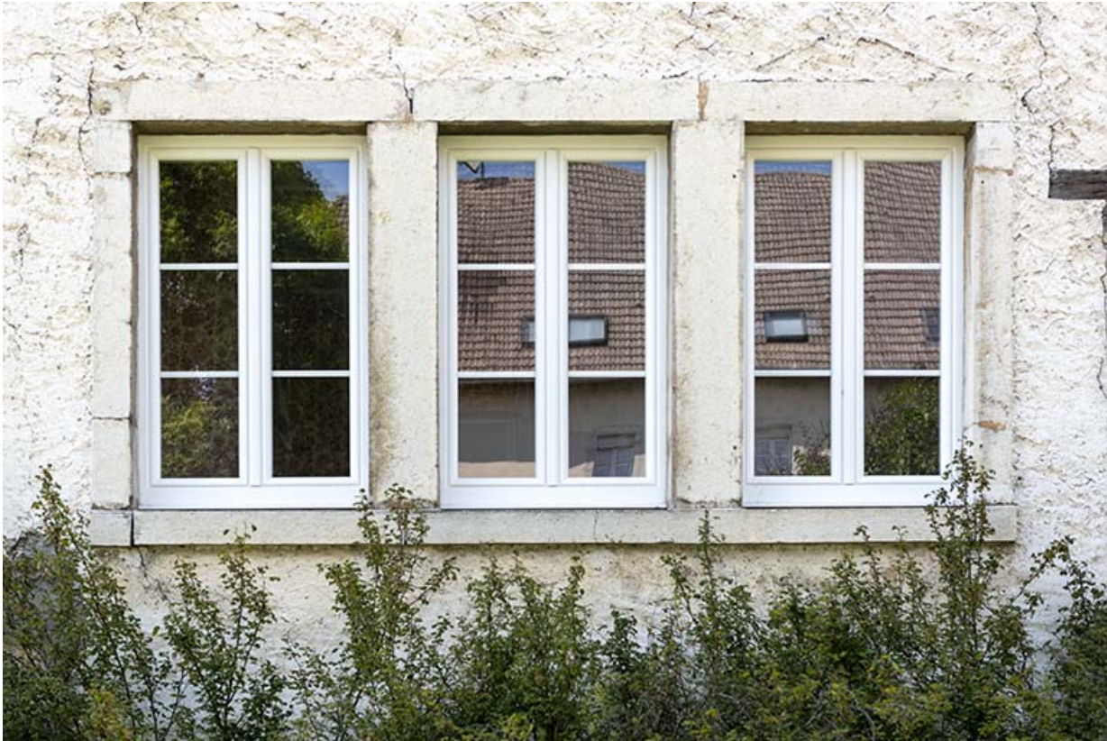
Façade latérale droite : fenêtres multiples.

25, Le Russey, 5 et 5 bis rue Clemenceau