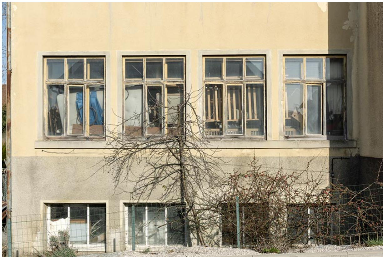
Aile orientale : fenêtres multiples.