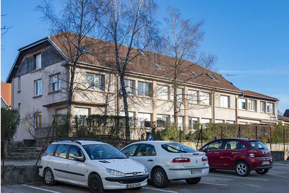
Vue d'ensemble depuis le sud.