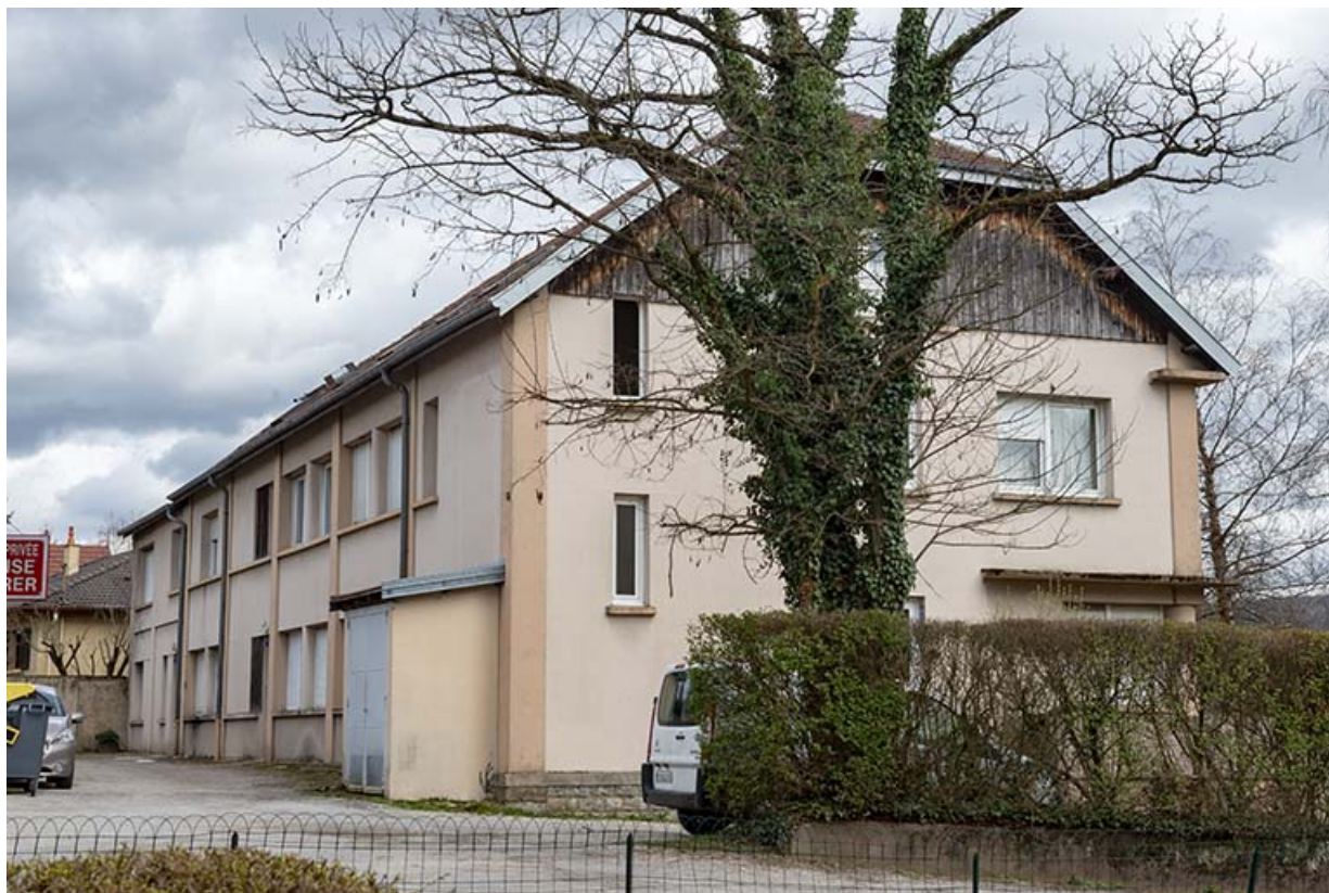
Vue de trois quarts arrière.