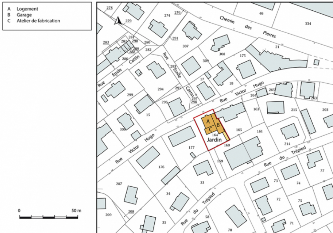
Plan-masse et de situation. Extrait du plan cadastral, 2018, section AF, 1/1 000. 25, Morteau, 24 rue Victor Hugo