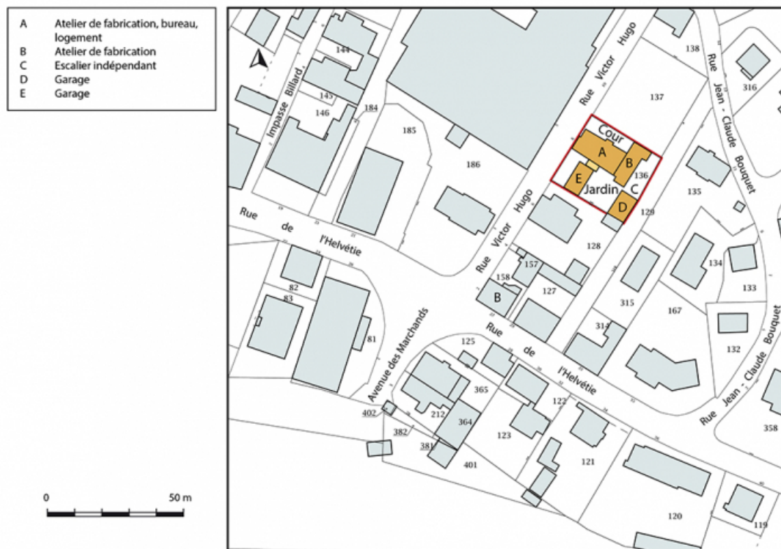
Plan-masse et de situation. Extrait du plan cadastral, 2018, section AF, 1/1 000. 25, Morteau, 8 rue Victor Hugo