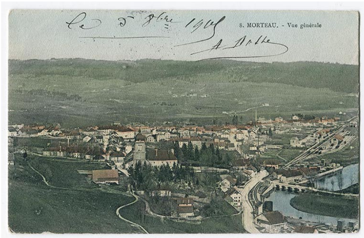
8. Morteau. - Vue générale [depuis la Table du Roi, à l'ouest], 4e quart 19e siècle [après 1895].