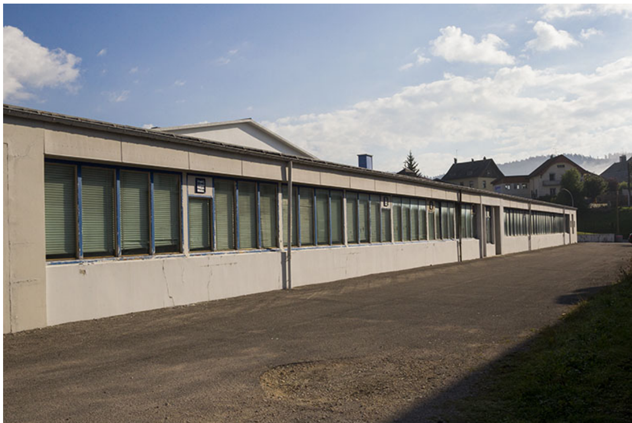
Bâtiment en rez-de-chaussée : façade méridionale.