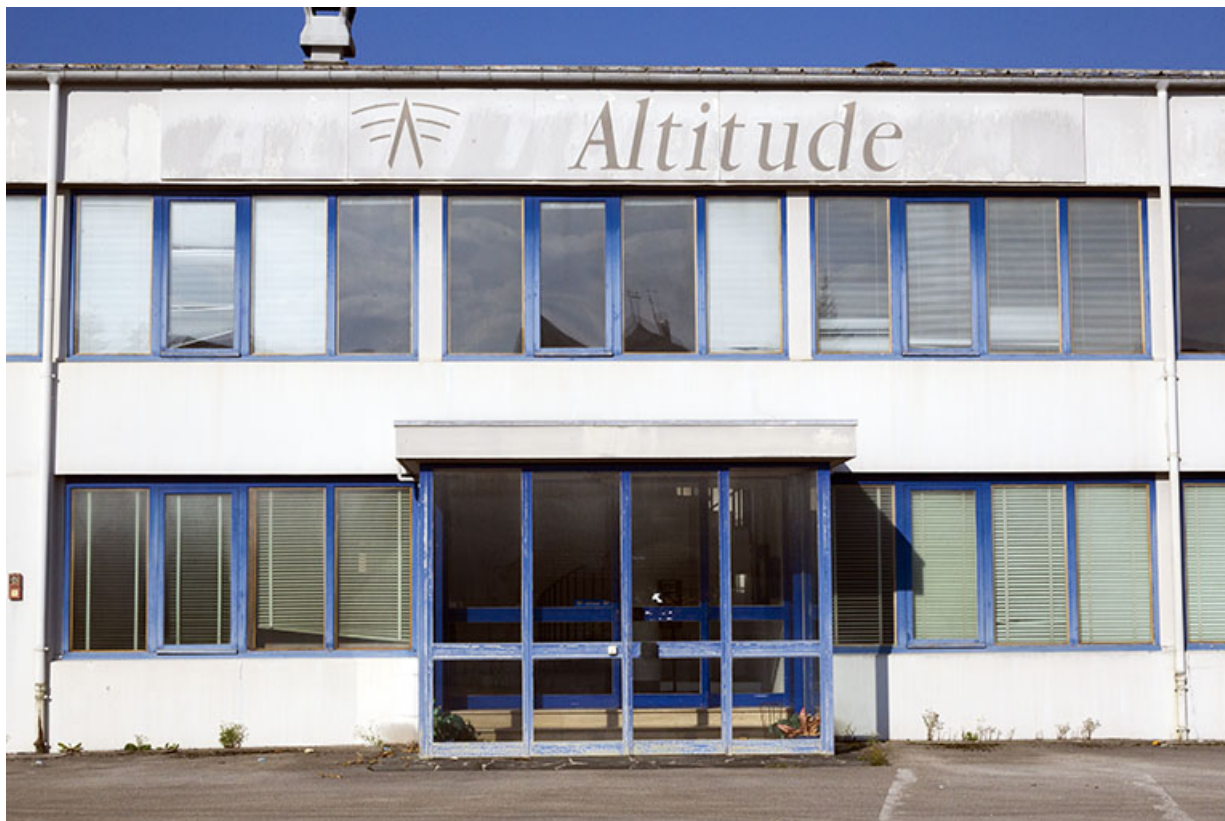
Bâtiment à étage : travées centrales de la façade orientale.