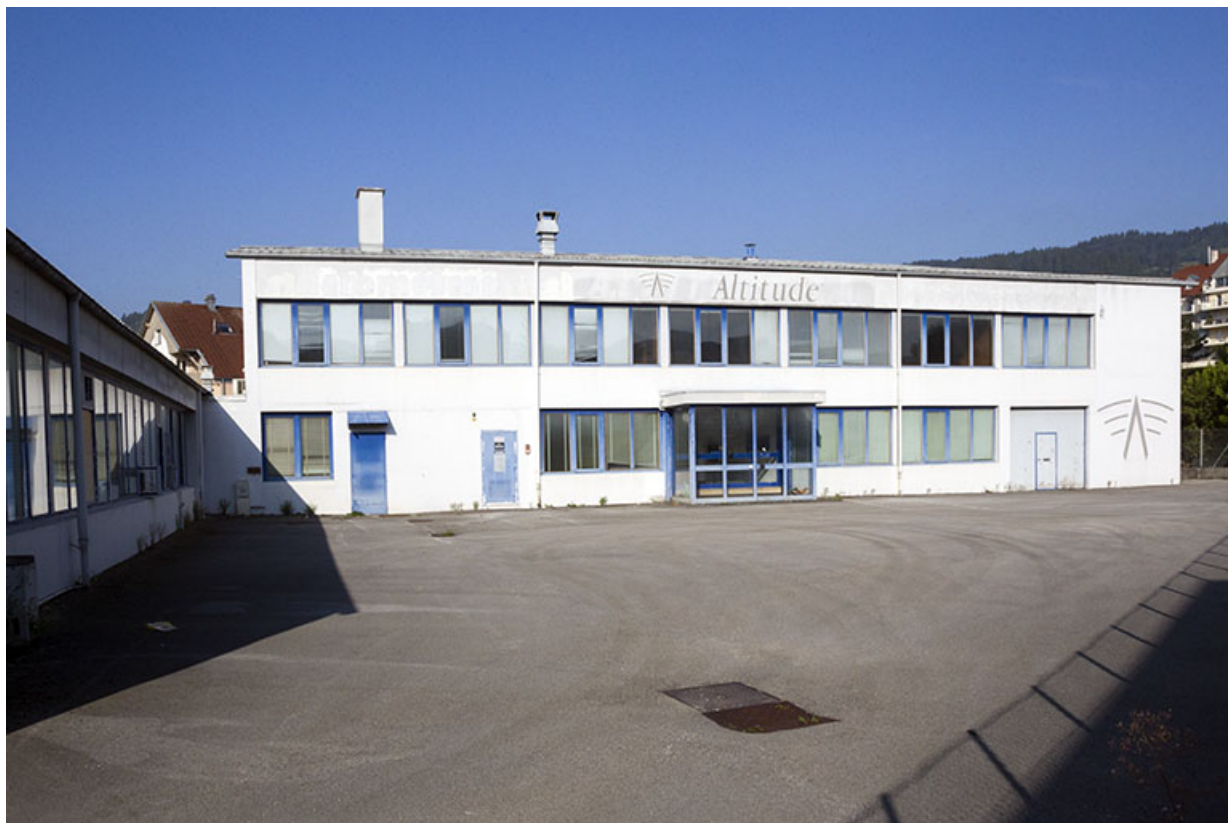
Bâtiment à étage : façade orientale.