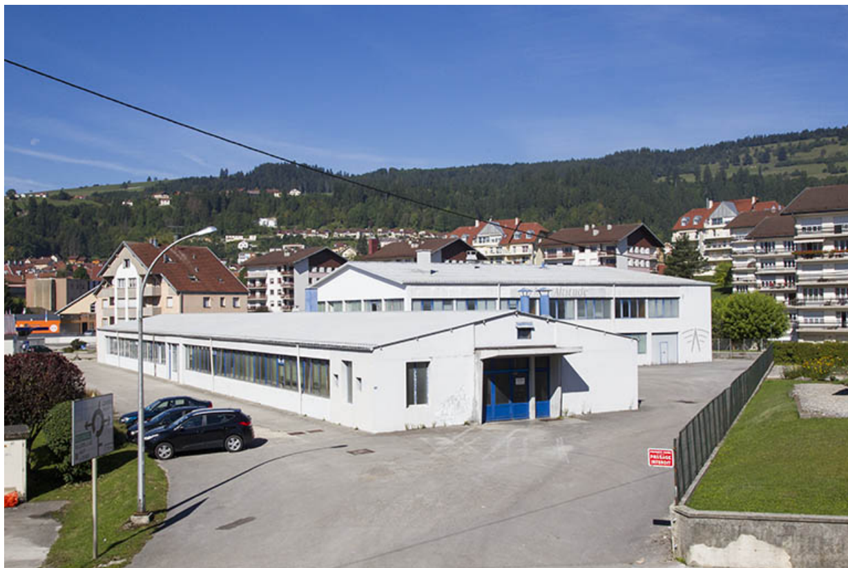
Vue d'ensemble, depuis l'avenue Charles de Gaulle à l'est. 25, Morteau, 9 rue du Clos jeune