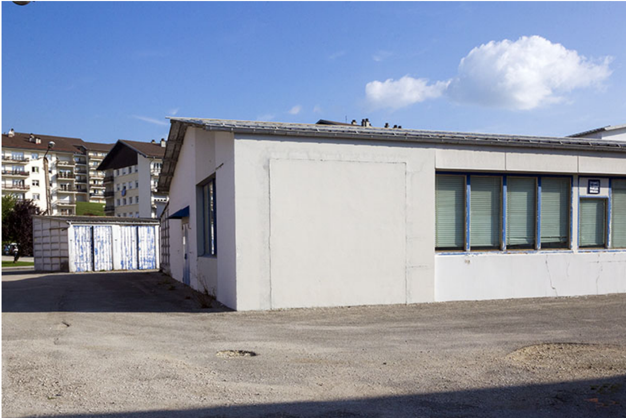
Bâtiment en rez-de-chaussée : extrémité occidentale.