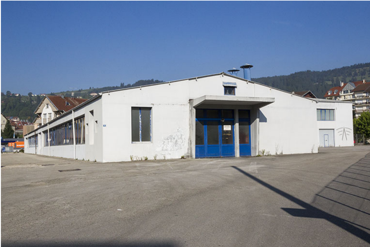
Bâtiment en rez-de-chaussée : extrémité orientale.