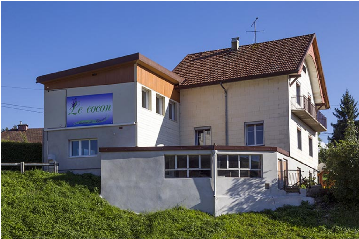
Atelier, garage et maison : élévations nord et ouest.