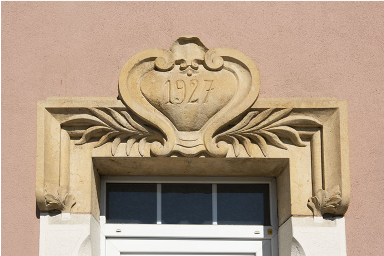
Façade antérieure : linteau daté 1927.