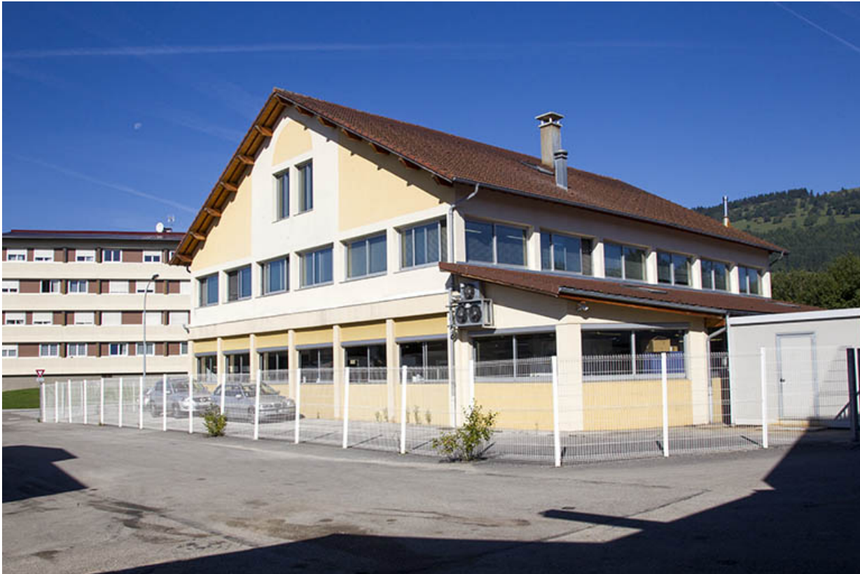
Façades postérieure et latérale droite.