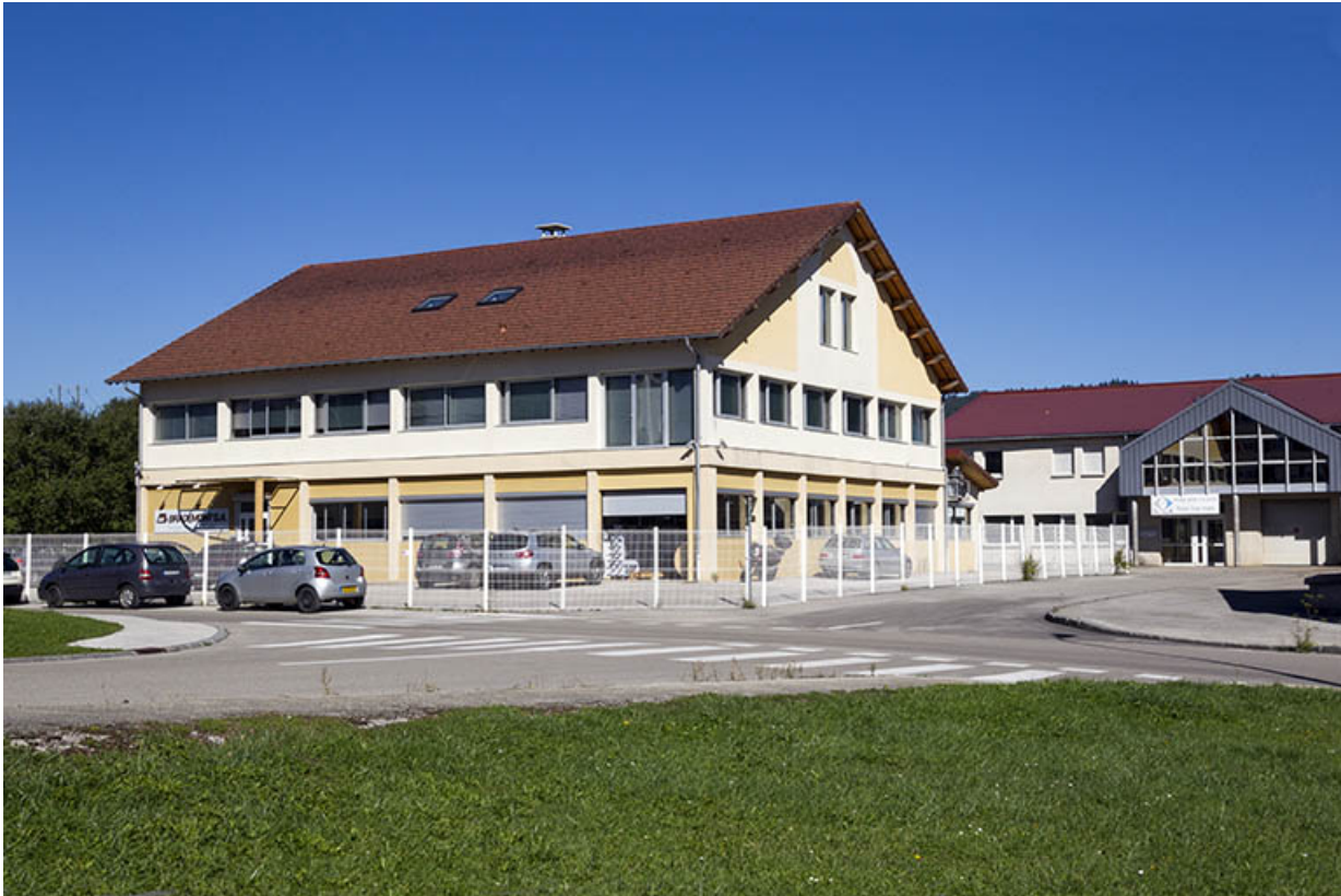
Façades antérieure et latérale droite.