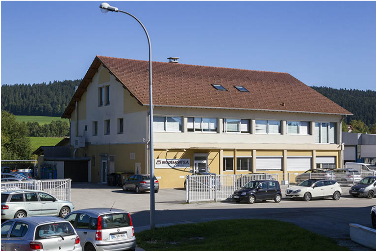
Façades antérieure et latérale gauche.