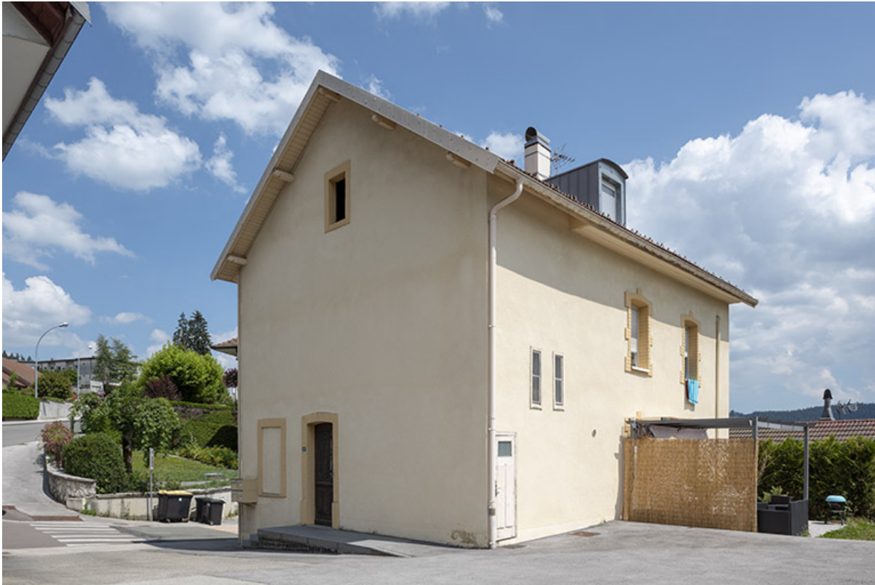
Façades postérieure et latérale droite.