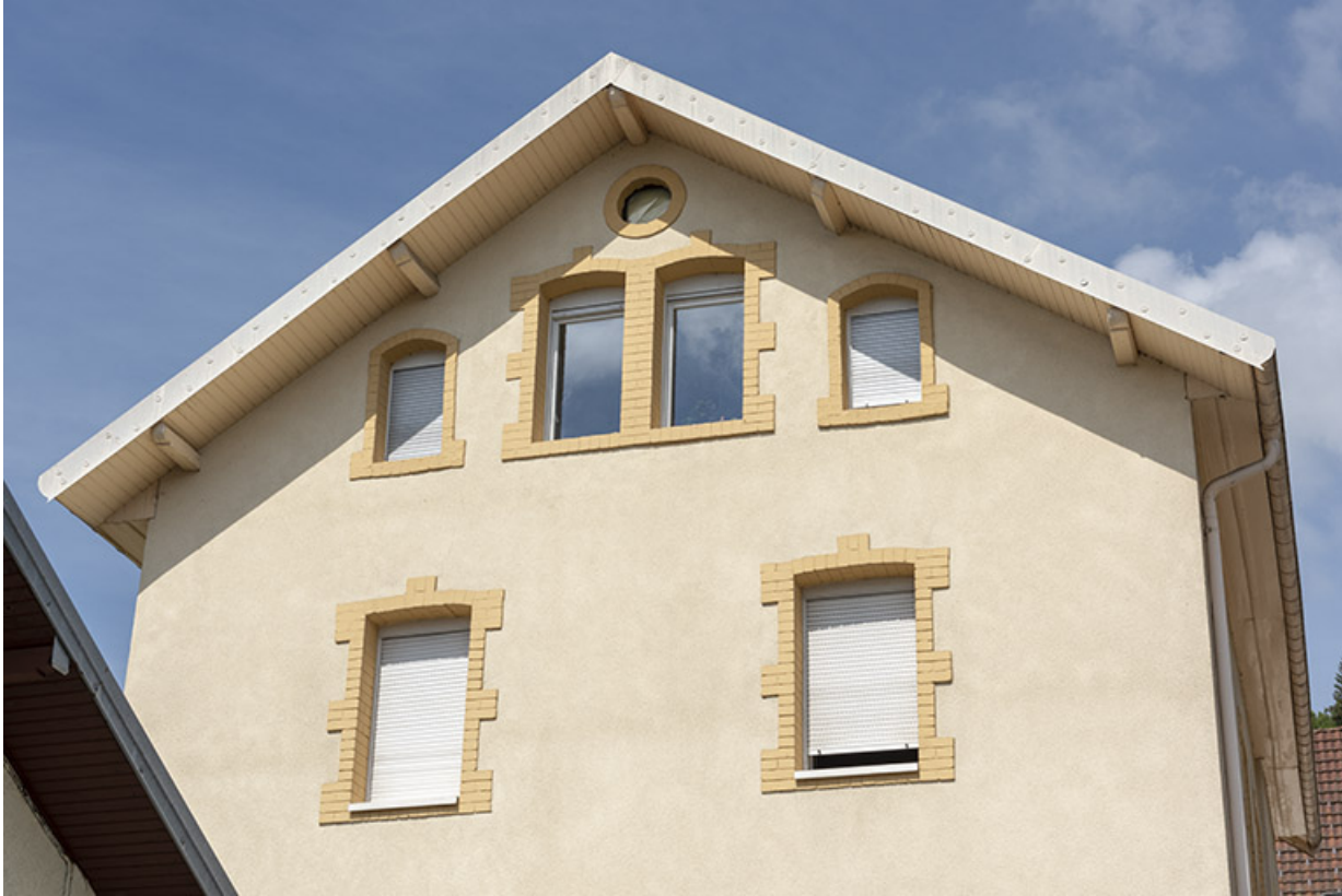
Façade latérale gauche : pignon avec fenêtre horlogère.