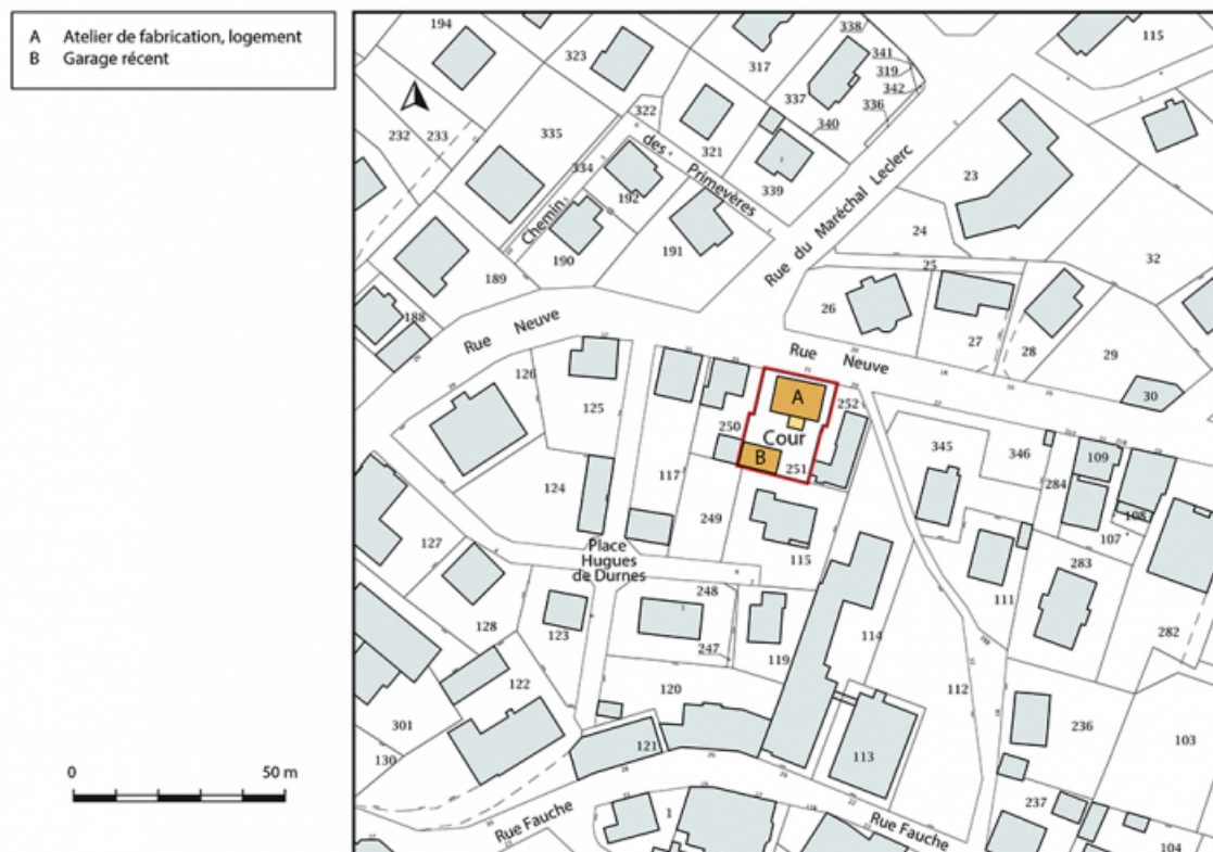
Plan-masse et de situation. Extrait du plan cadastral, 2018, section AC, 1/1 000. 25, Morteau, 31 rue Neuve