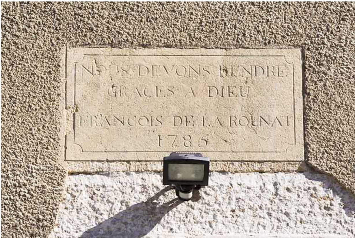
Façade latérale gauche : inscription et date 1785. 25, Morteau, 21 rue de l' Helvétie