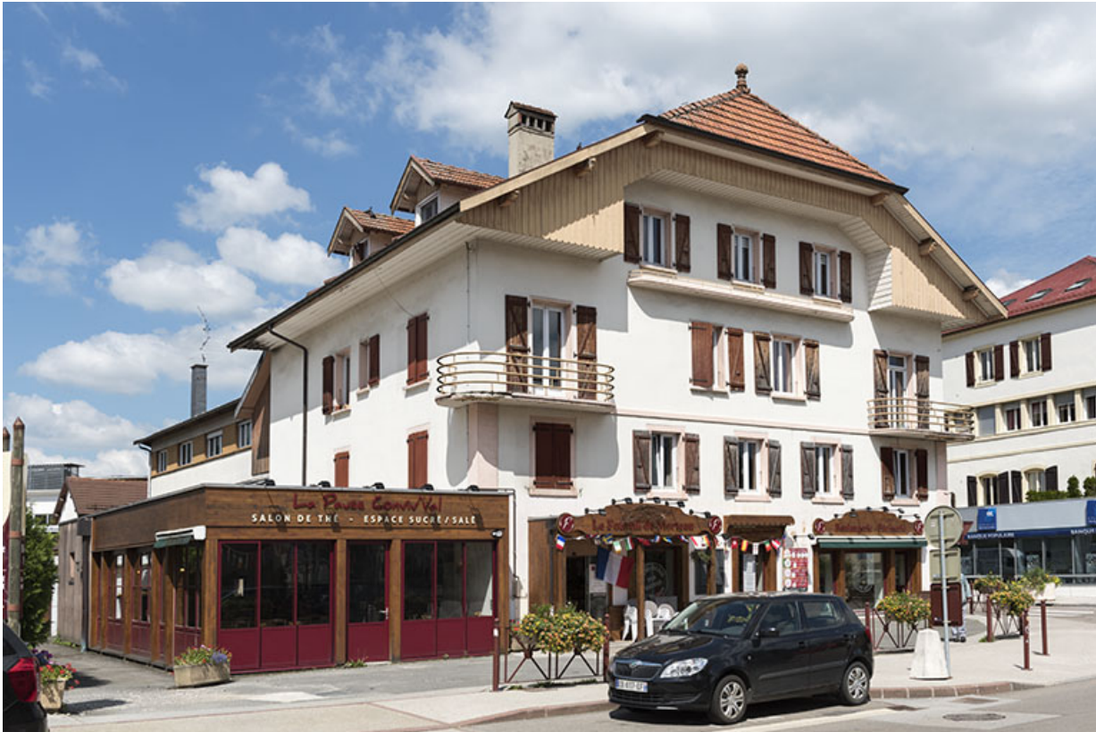
Vue d'ensemble, de trois quarts gauche. 25, Morteau, 15 rue de l' Helvétie