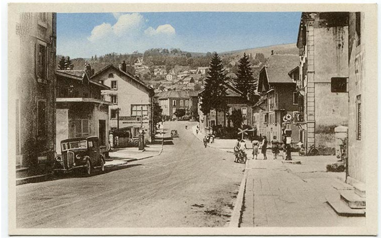
39 Morteau - Rue de l'Helvétie, milieu 20e siècle. Le bâtiment a été reconstruit.