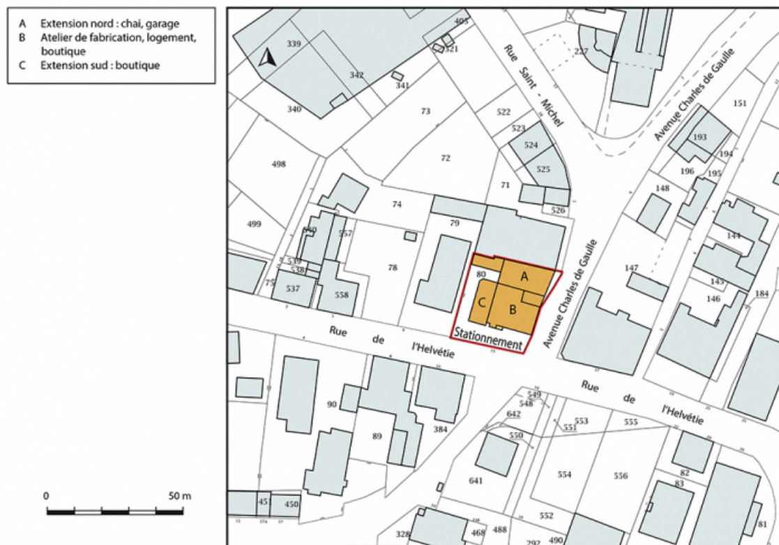
Plan-masse et de situation. Extrait du plan cadastral, 2018, section AA, 1/1 000. 25, Morteau, 15 rue de l' Helvétie