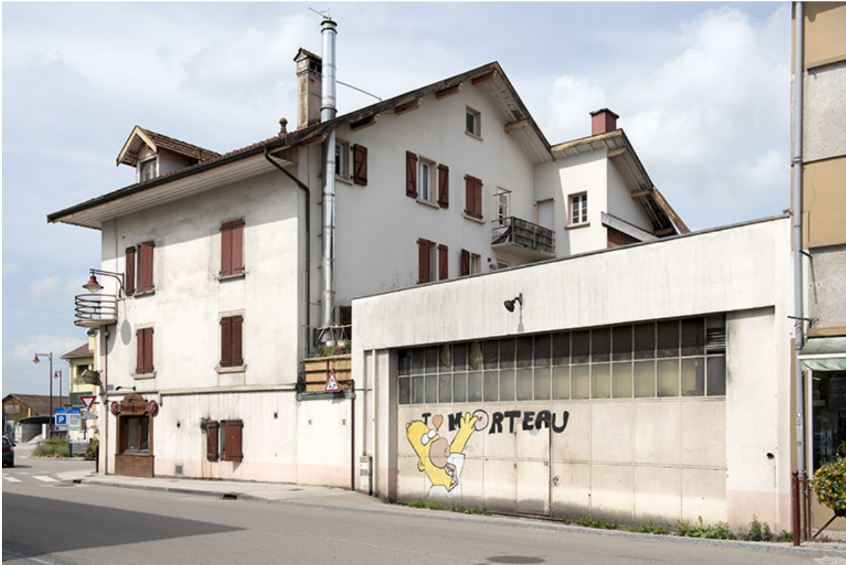
Façade latérale droite.