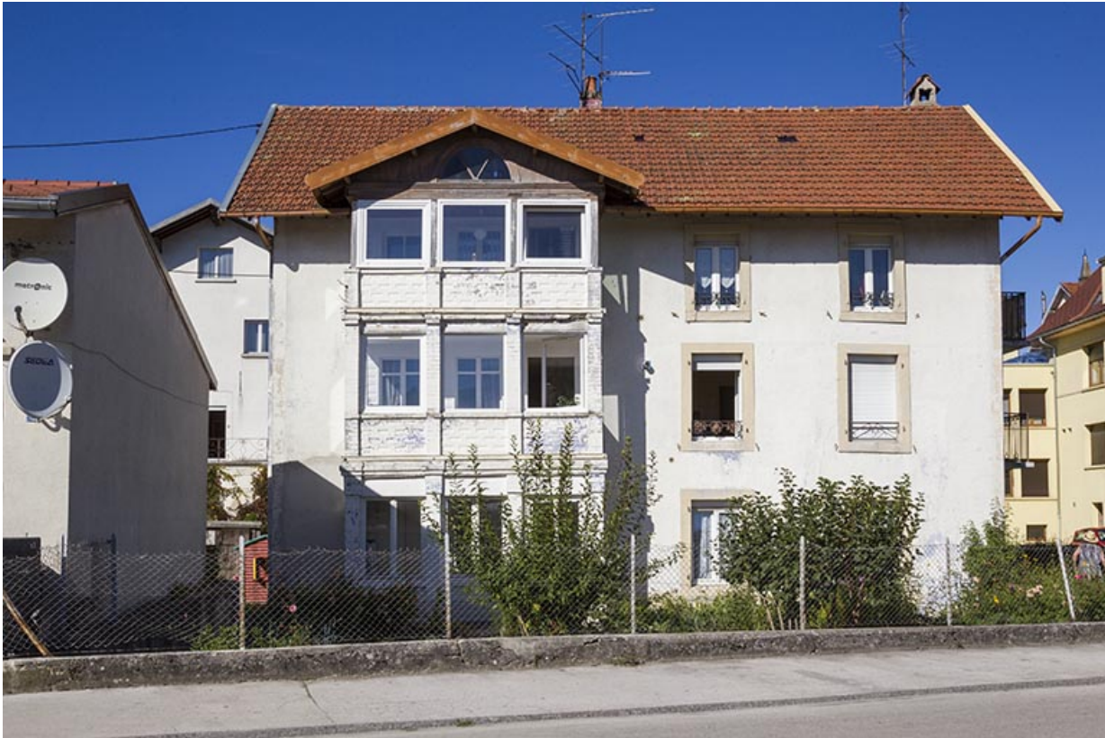
Corps de bâtiment en fond de cour : façade sud.