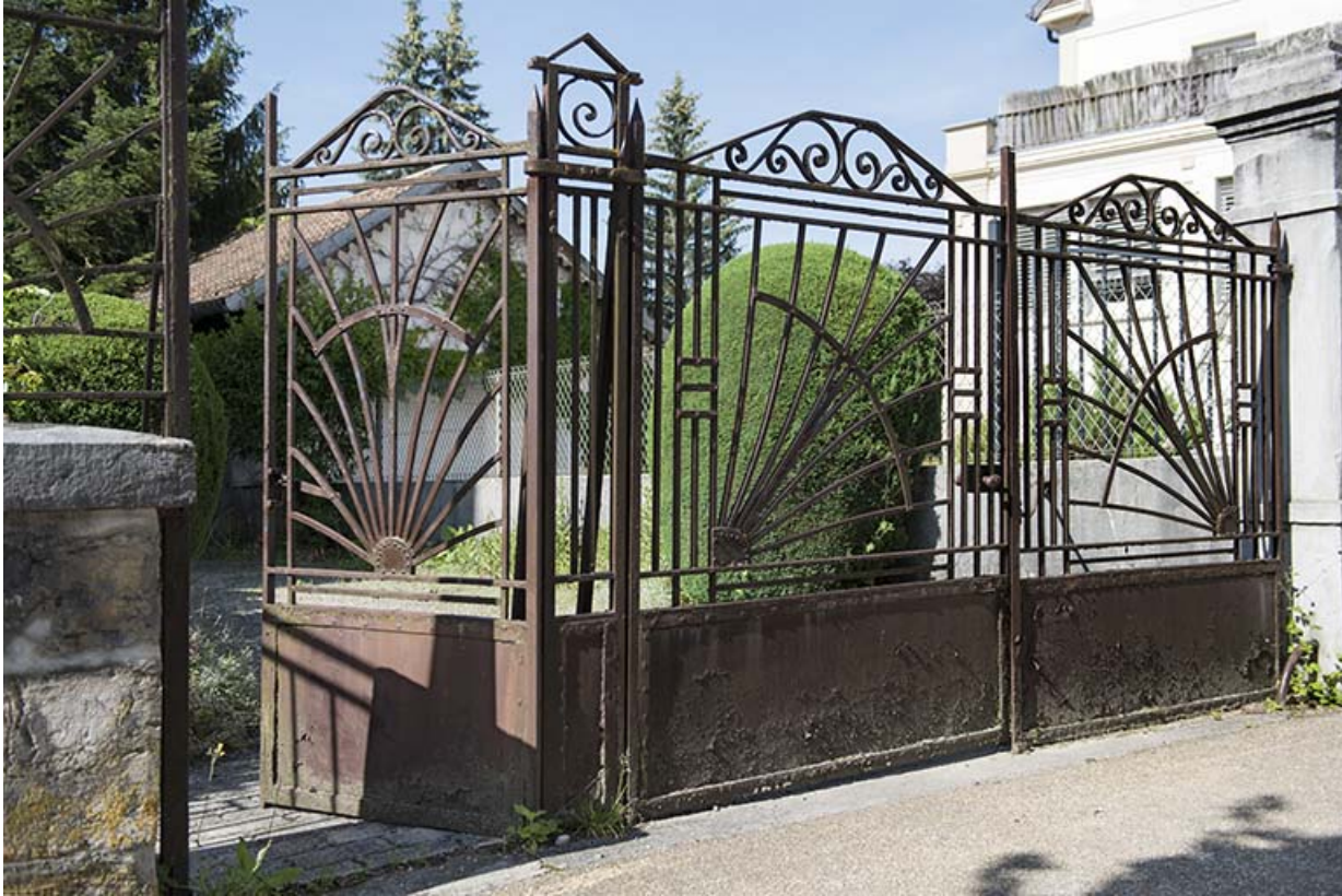
Portail sur la rue de l'Helvétie.