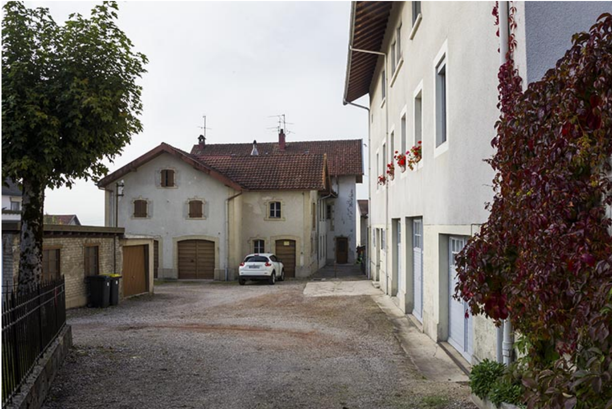
Corps de bâtiment en fond de cour, depuis le nord.