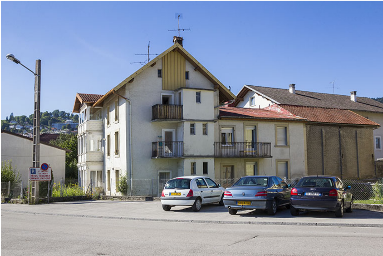
Corps de bâtiment en fond de cour, depuis l'est.