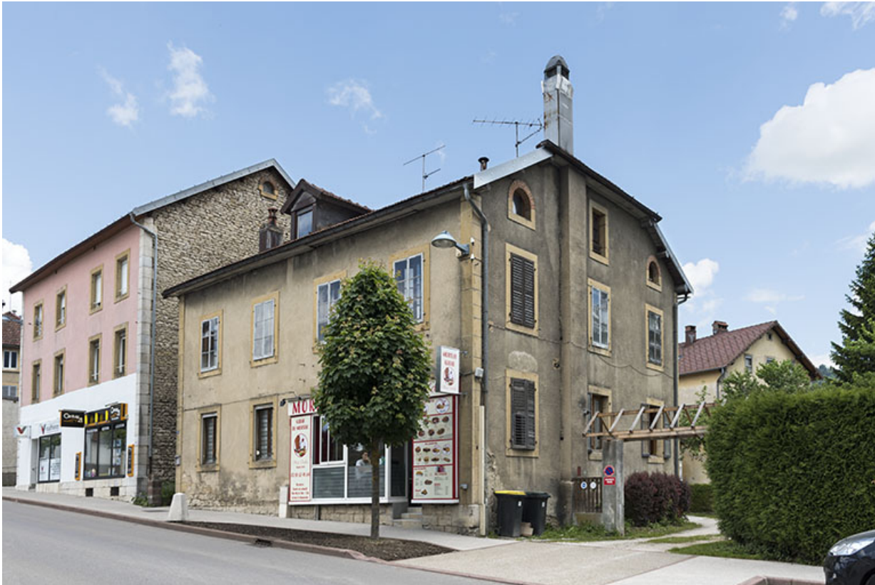
Vue d'ensemble, de trois quarts droite.