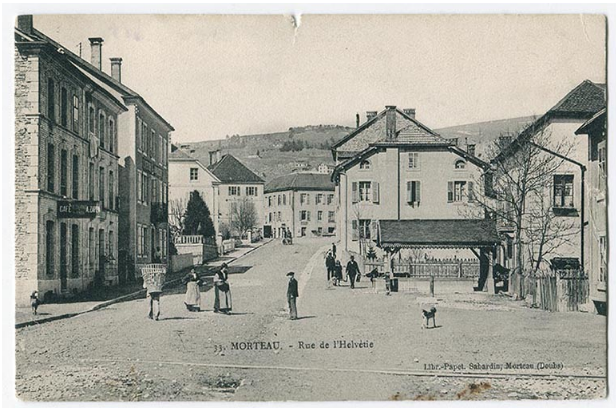
33. Morteau - Rue de l'Helvétie, 1er quart 20e siècle [avant 1910]. L'immeuble est le deuxième bâtiment à gauche. 25, Morteau

33. Morteau - Rue de l'Helvétie, carte postale, s.n., [1er quart 20e siècle, avant 1910], librairie-papeterie Sabardin éd. à Morteau