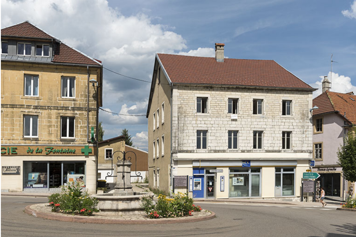
Façade antérieure, de trois quarts gauche.