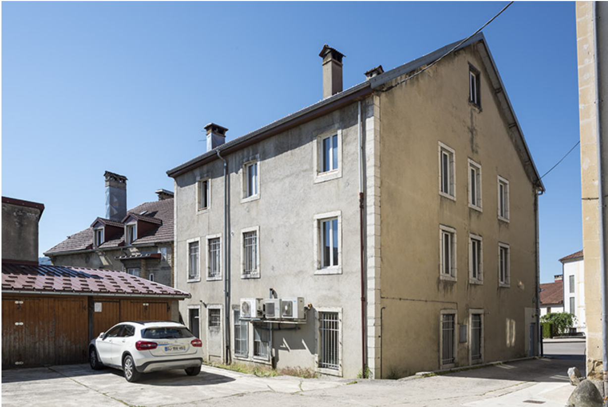
Façades postérieure et latérale gauche.