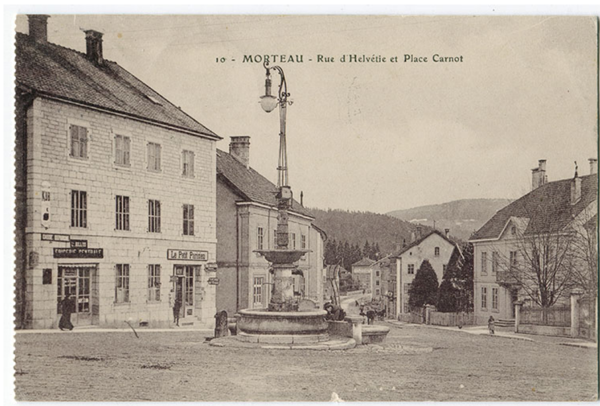
10 - Morteau - Rue d'Helvétie et place Carnot, 1er quart 20e siècle [avant 1912]. 25, Morteau