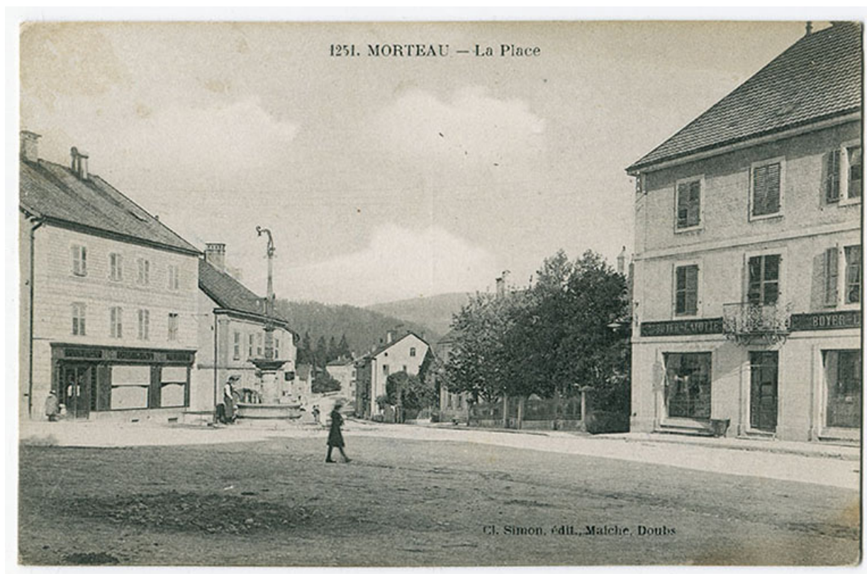
1251. Morteau - La place [Carnot], 1er quart 20e siècle.