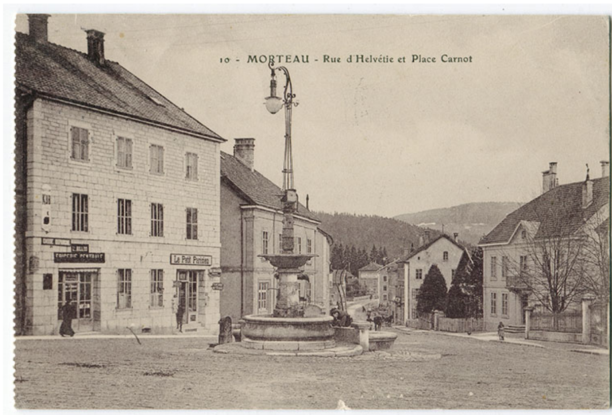
10 - Morteau - Rue d'Helvétie et place Carnot, 1er quart 20e siècle [avant 1912]. 25, Morteau