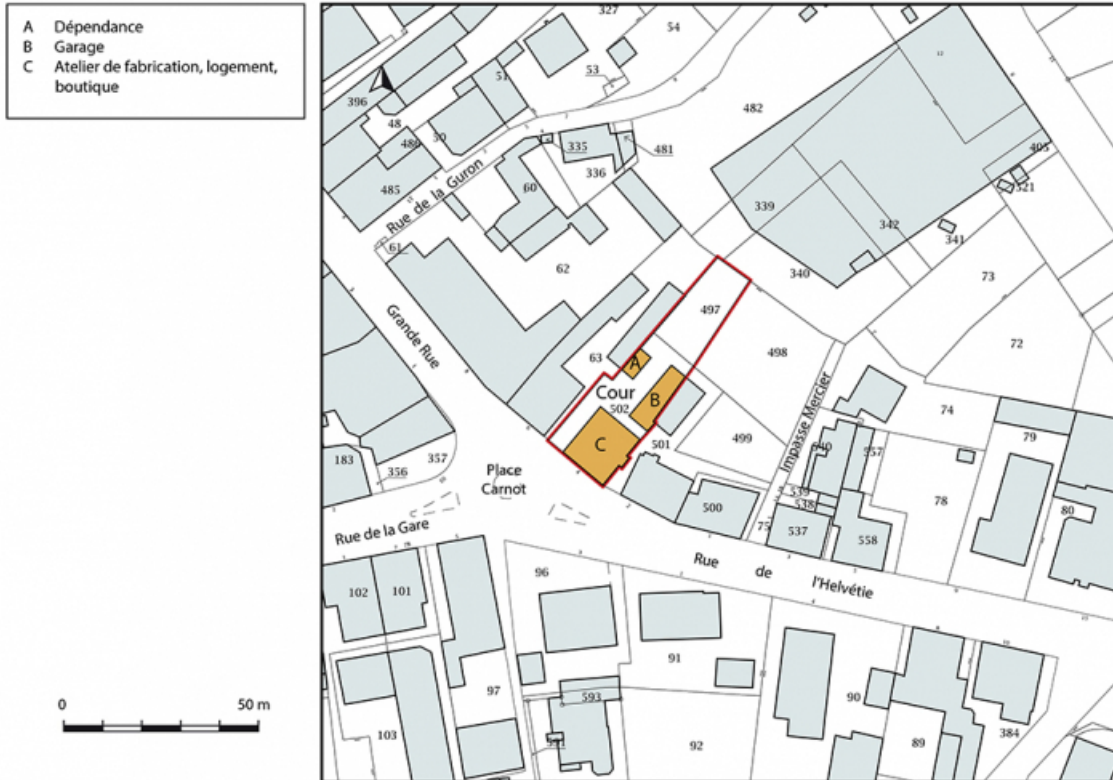
Plan-masse et de situation. Extrait du plan cadastral, 2018, section AA, 1/1 000. 25, Morteau, 4 place Carnot