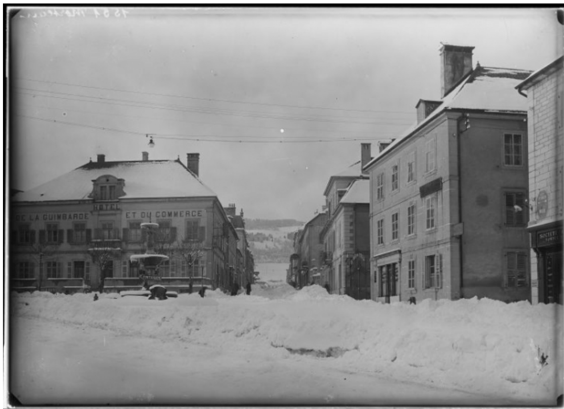
[La place Carnot et la Grande Rue sous la neige], milieu 20e siècle.