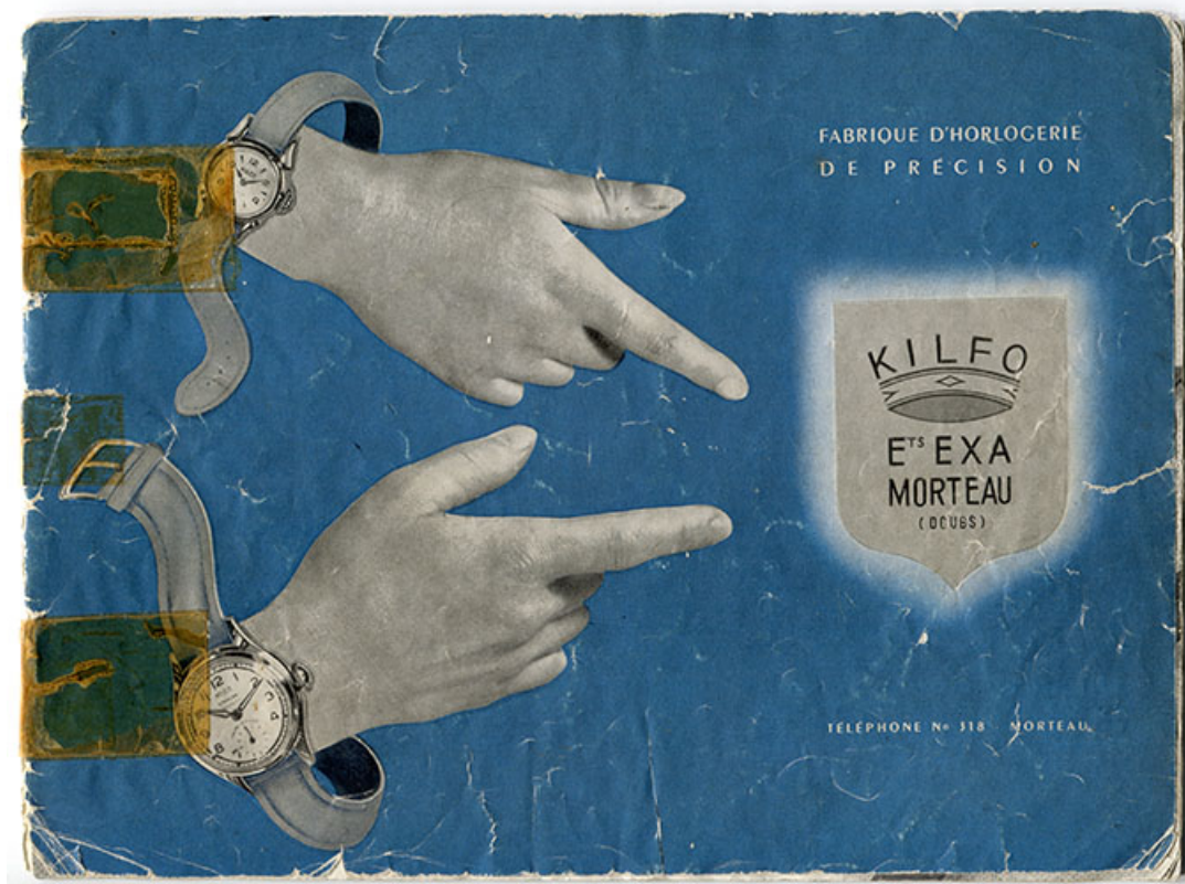
Catalogue de la Fabrique d'horlogerie de précision Kilfo. Ets Exa, Morteau (Doubs), années 1950-1960 : page de couverture. 25, Morteau, 2 place Carnot