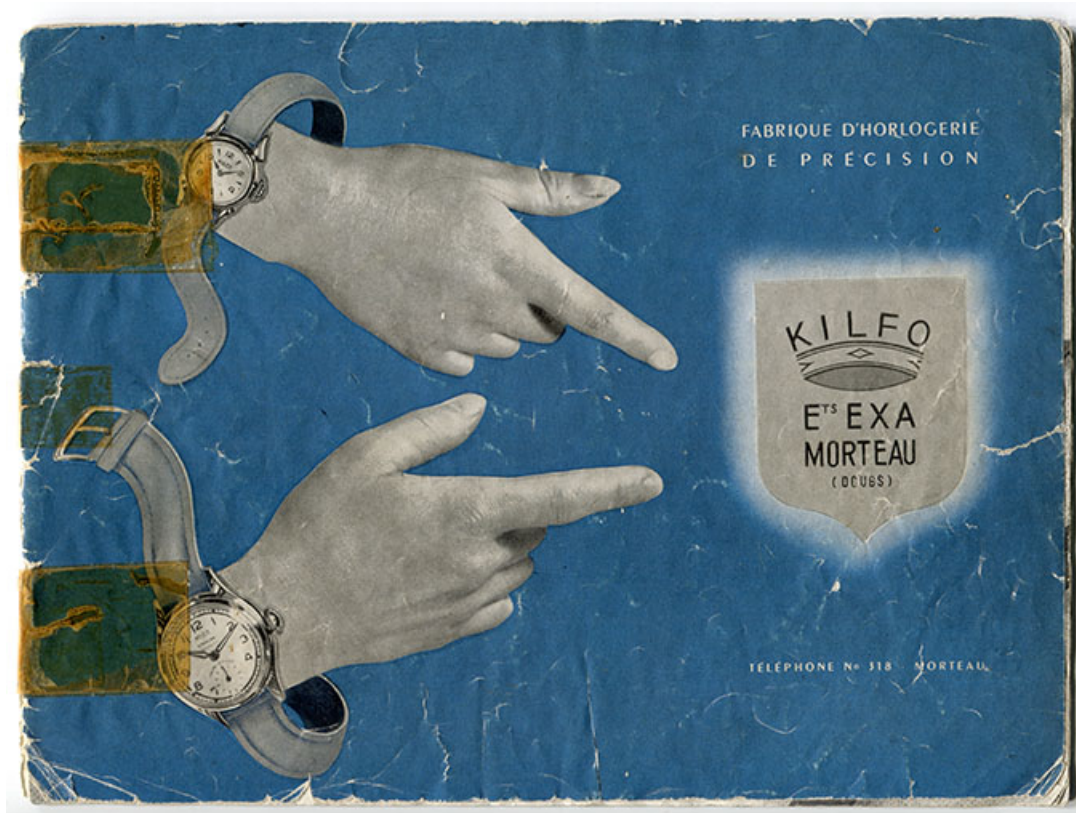
Catalogue de la Fabrique d'horlogerie de précision Kilfo. Ets Exa, Morteau (Doubs), années 1950-1960 : page de couverture. 25, Morteau, 2 place Carnot

Fabrique d'horlogerie de précision Kilfo. Ets Exa, Morteau (Doubs) [catalogue]. - S.l. [Morteau] : s.n. [Ets Exa], s.d. [années 1950-1960]. 15 p. : tout en ill. ; 18 x 24 cm.