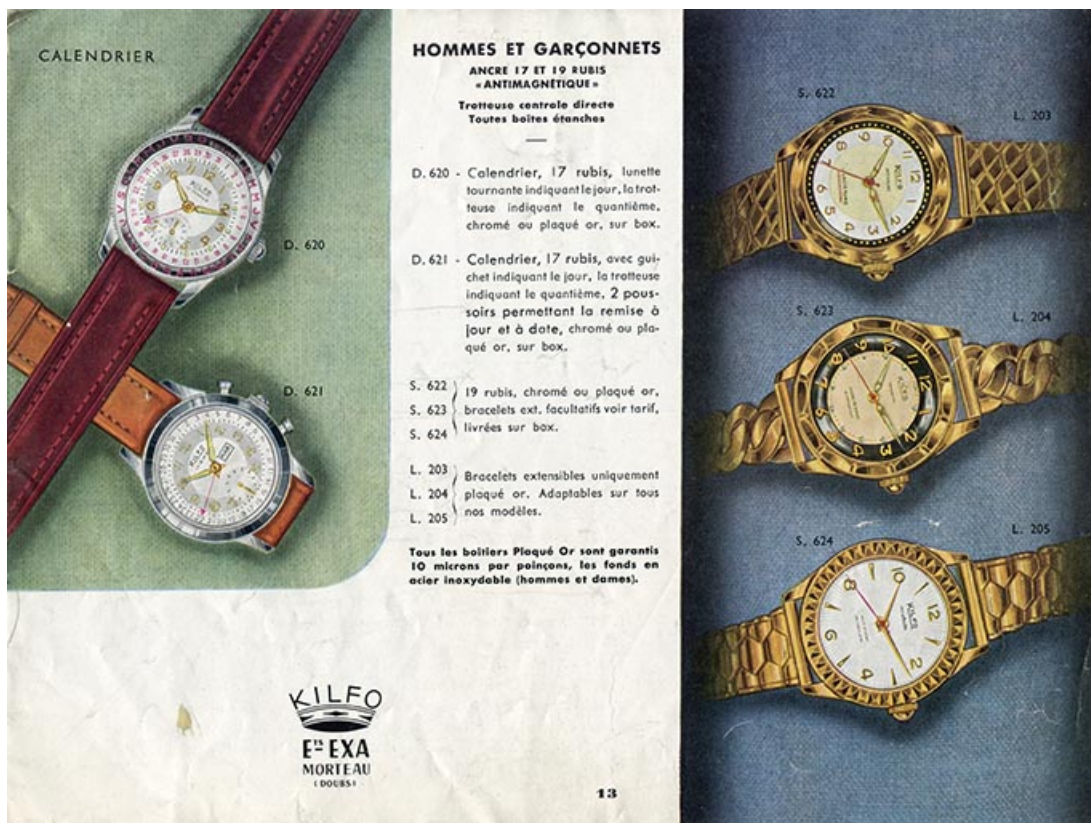
Catalogue de la Fabrique d'horlogerie de précision Kilfo. Ets Exa, Morteau (Doubs), années 1950-1960 : p. 13. 25, Morteau, 2 place Carnot