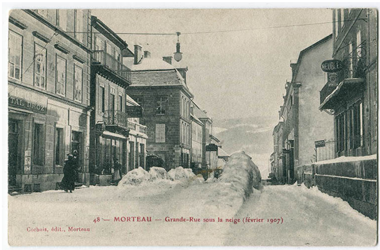
48 - Morteau - Grande Rue sous la neige (février 1907). La boutique au long de la rue est bâtie. 25, Morteau