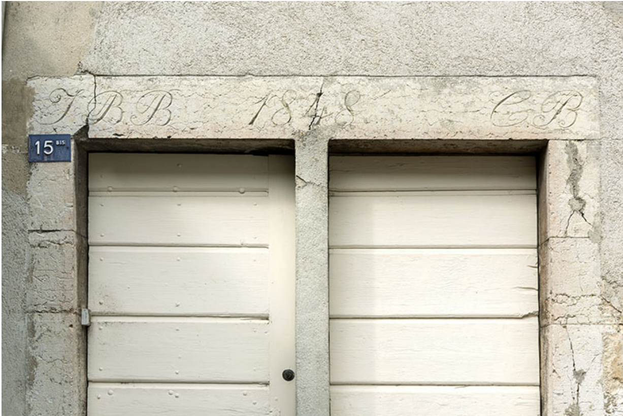
Maison côté cour : linteau daté 1848.