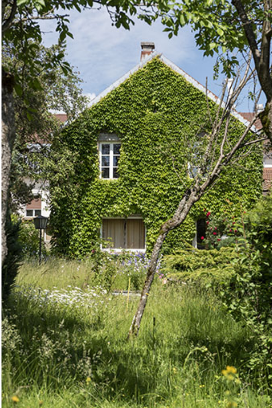
Maison côté jardin.