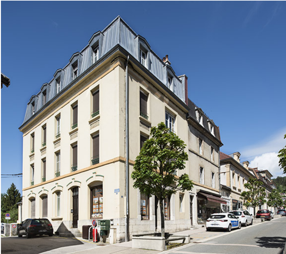
Immeuble et maison, ateliers d'horlogerie Dornier, et Aeschlimann et Monbaron, 5 bis et 7 Grande Rue. 25, Morteau