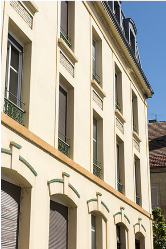
Façade latérale gauche : détail des baies.