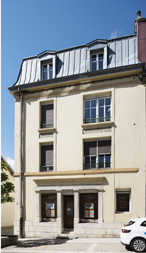
Partie gauche (5 bis) de la façade antérieure. 25, Morteau, 5 bis et 7 Grande Rue