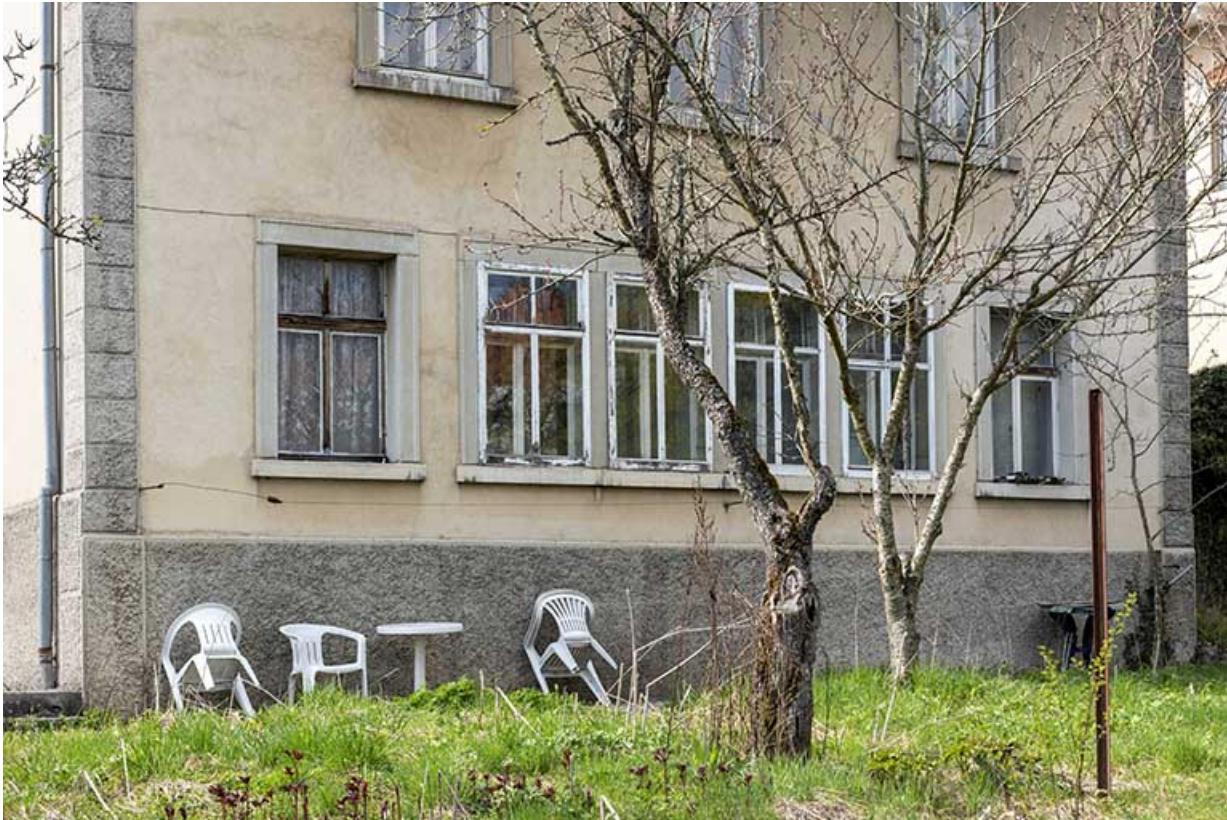
Façade postérieure : fenêtres multiples de l'atelier.