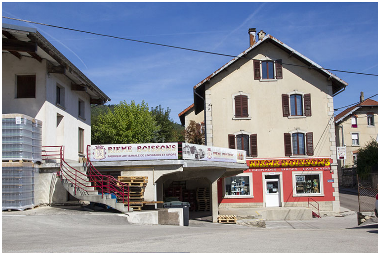
Maison (façade latérale gauche) et quais de chargement. 25, Morteau, 21 rue de la Louhière