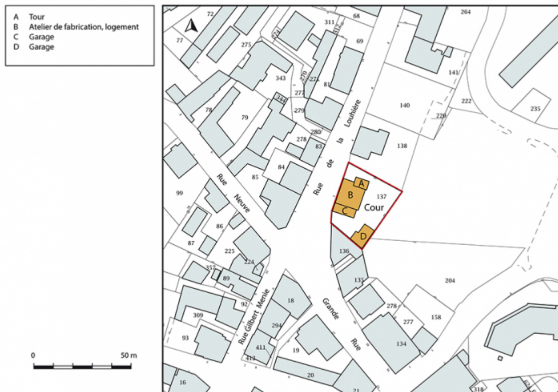
Plan-masse et de situation. Extrait du plan cadastral, 2018, section AE, 1/1 000. 25, Morteau, 2 rue de la Louhière