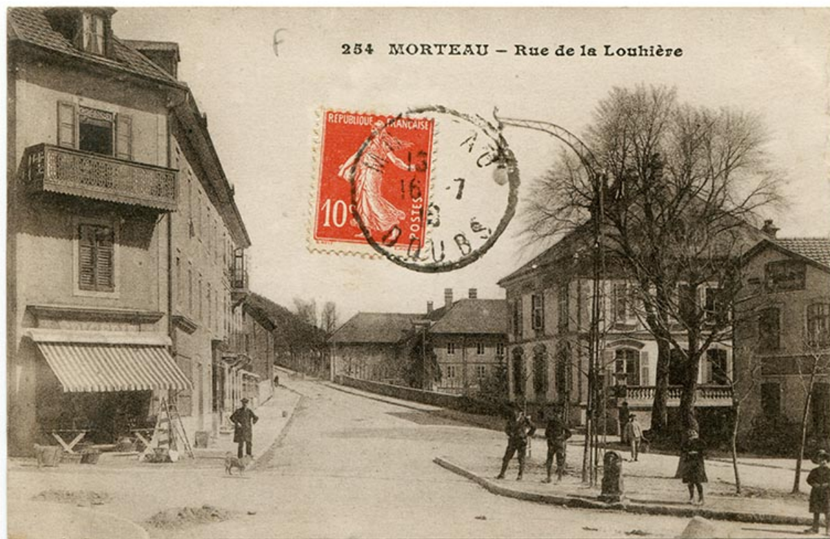
254 Morteau - Rue de la Louhière, 1er quart 20e siècle [avant 1910 ?].