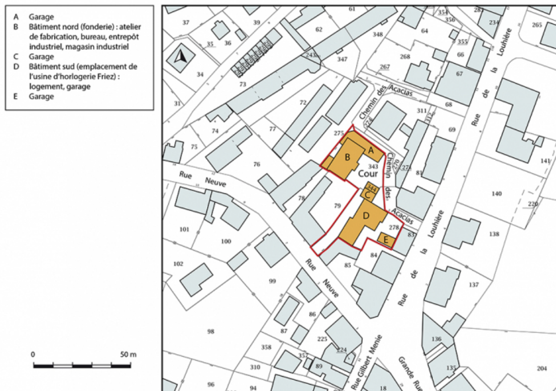
Plan-masse et de situation. Extrait du plan cadastral, 2018, section AC, 1/1 000. 25, Morteau, 3-5 chemin des Lilas