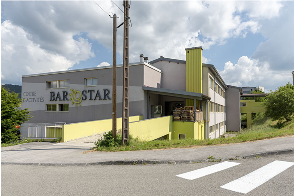
1er bâtiment (à gauche) et 2e (à droite), vus du nord.