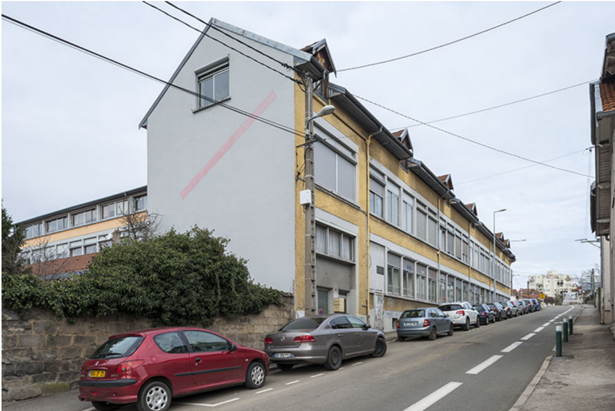
Vue d'ensemble depuis la rue Marie-Louise.