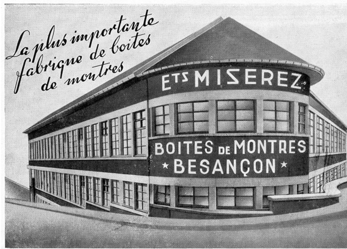
Usine de boîtes de montres Miserez, gravure, s.d. [1951]. 25, Besançon

Collection particulière : Henri Bonnet, Fournet-Luisans, Usine de boîtes de montres Miserez, gravure, s.d. [1951]. In : [Brochure du] Grand Prix de la montre de France organisé par la Pédale mortuassienne, Morteau, le 3 mai 1951. Lieu de conservation : Collection particulière : Henri Bonnet, Fournet-Luisans