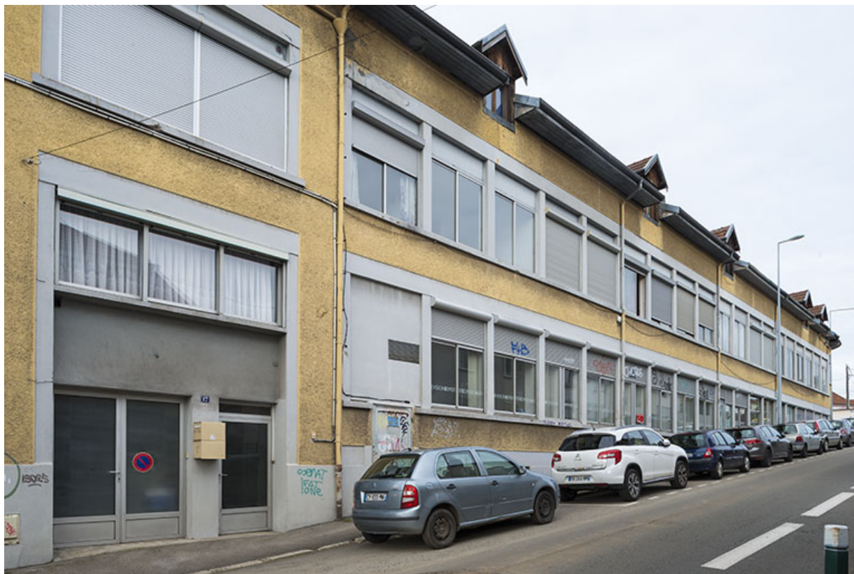
Façade sur la rue Marie-Louise, vue de trois quarts.