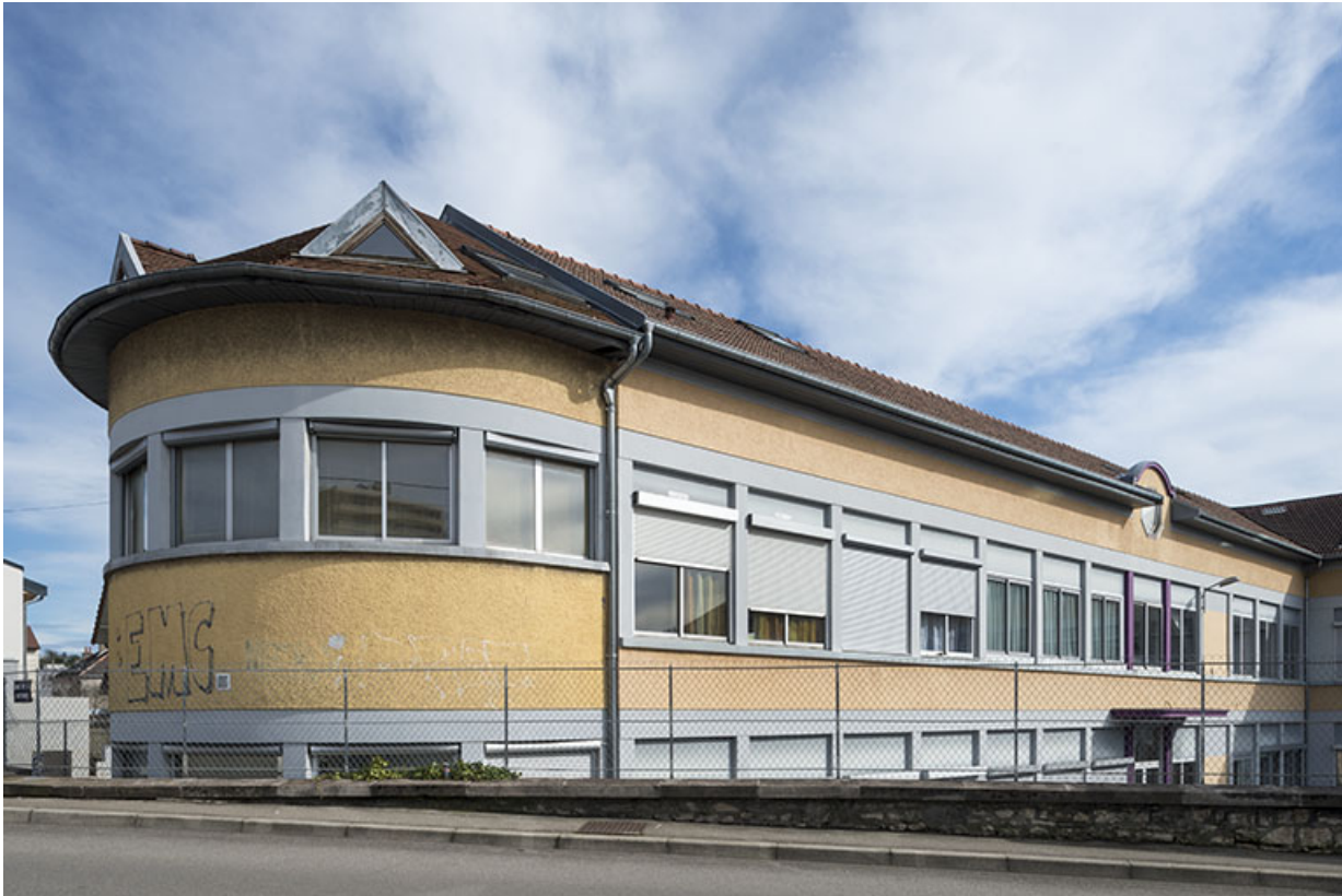
Extrémité nord de l'atelier est, depuis la rue de la Rotonde.