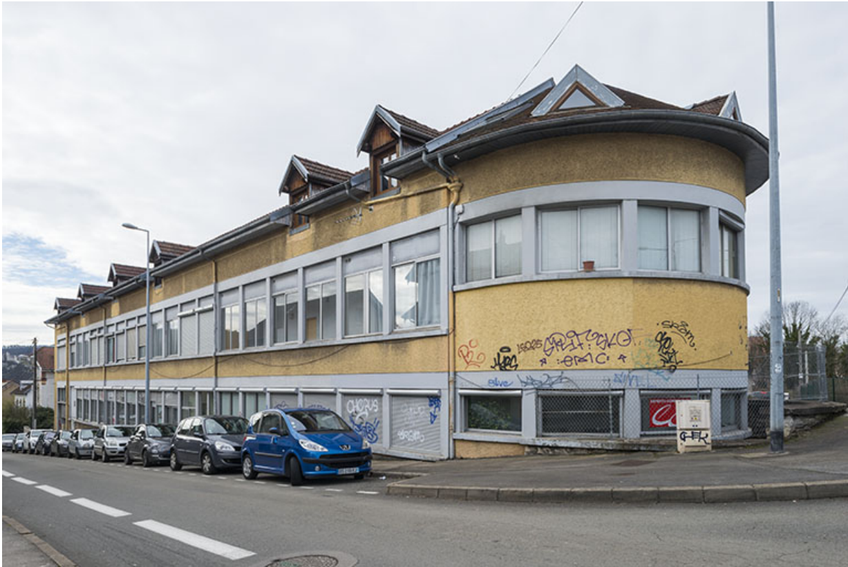
Vue d'ensemble depuis le nord-est.