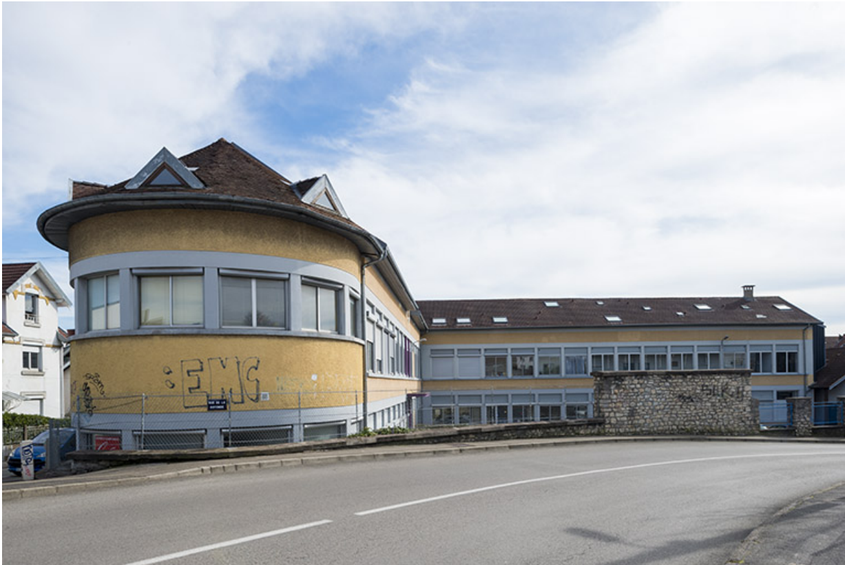
Vue d'ensemble depuis le nord.