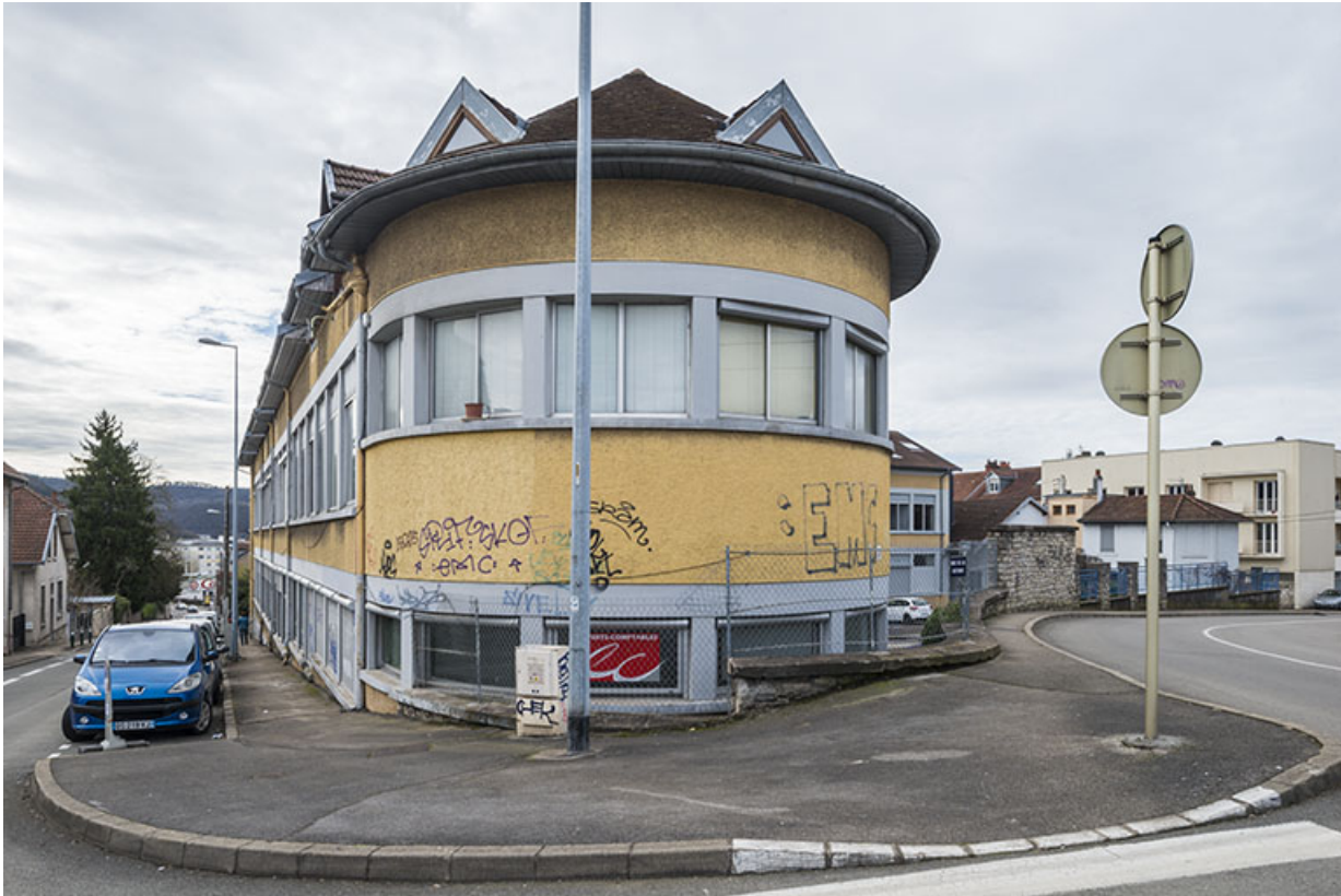
Vue depuis le nord.