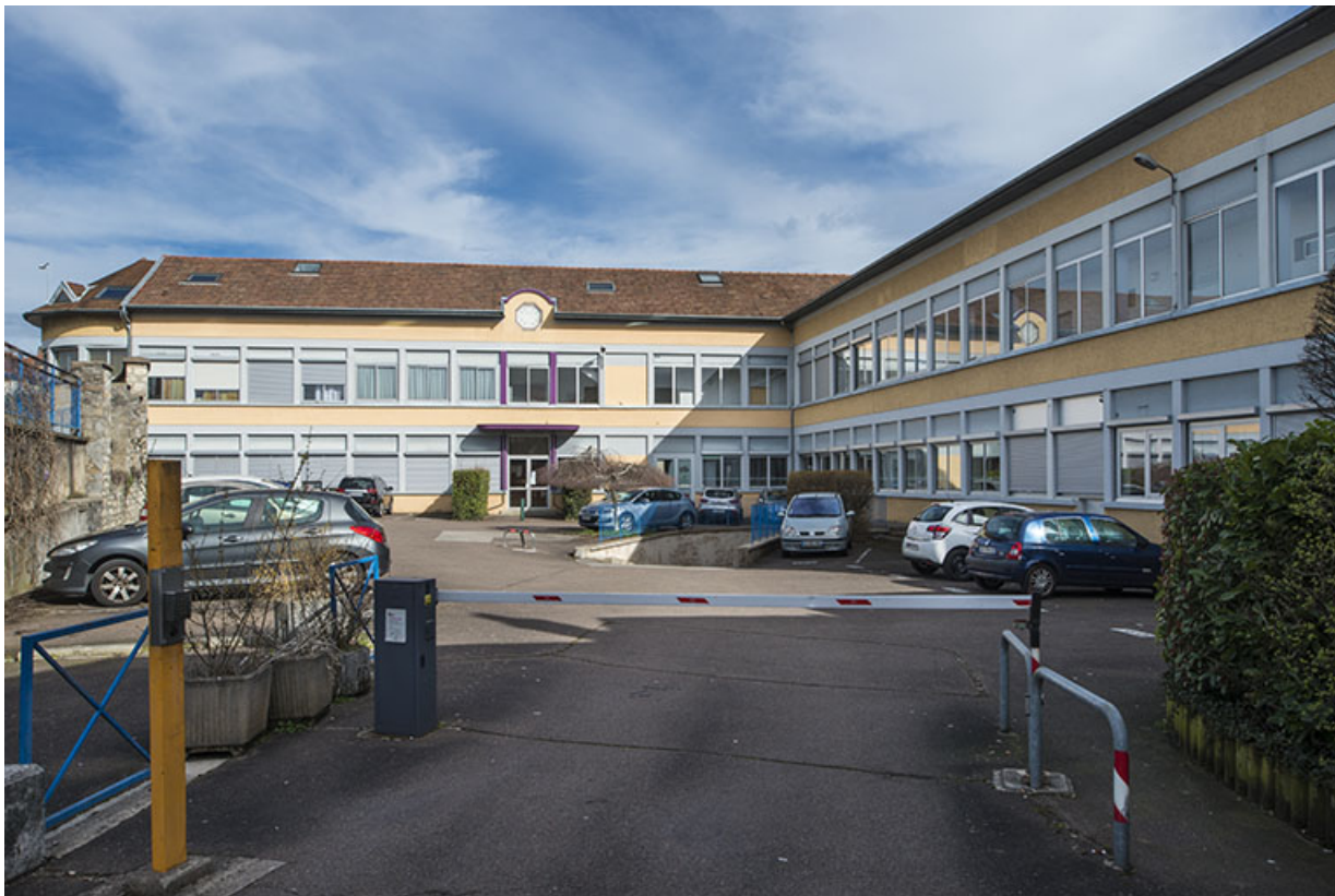
Vue d'ensemble depuis l'ouest.