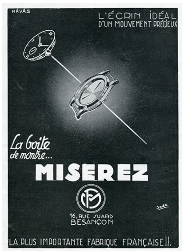
Boîte de montre Miserez, publicité, 1947.