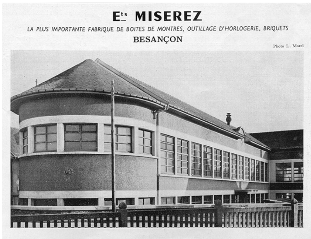
Ets Miserez, photographie, s.d. [1949]. 25, Besançon, 16 rue Suard

Ets Miserez, photographie, par L. Morel, s.d. [1949] . In : L'Opinion économique et financière : Franche-Comté, juillet 1949, n° 2., p. 19.