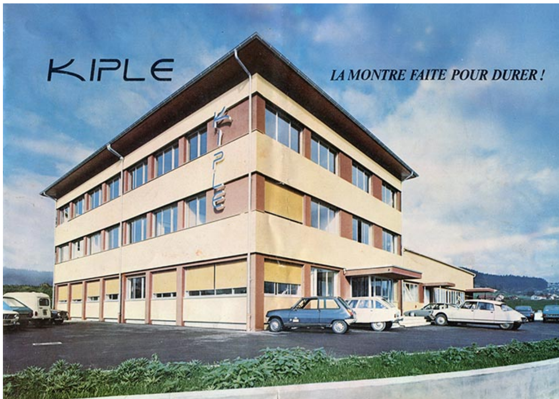
[L'usine vue de trois quarts gauche : 1ère de couverture d'un catalogue], vers 1980. 25, Morteau, 1 et 1A rue Fontaine-l'Epine