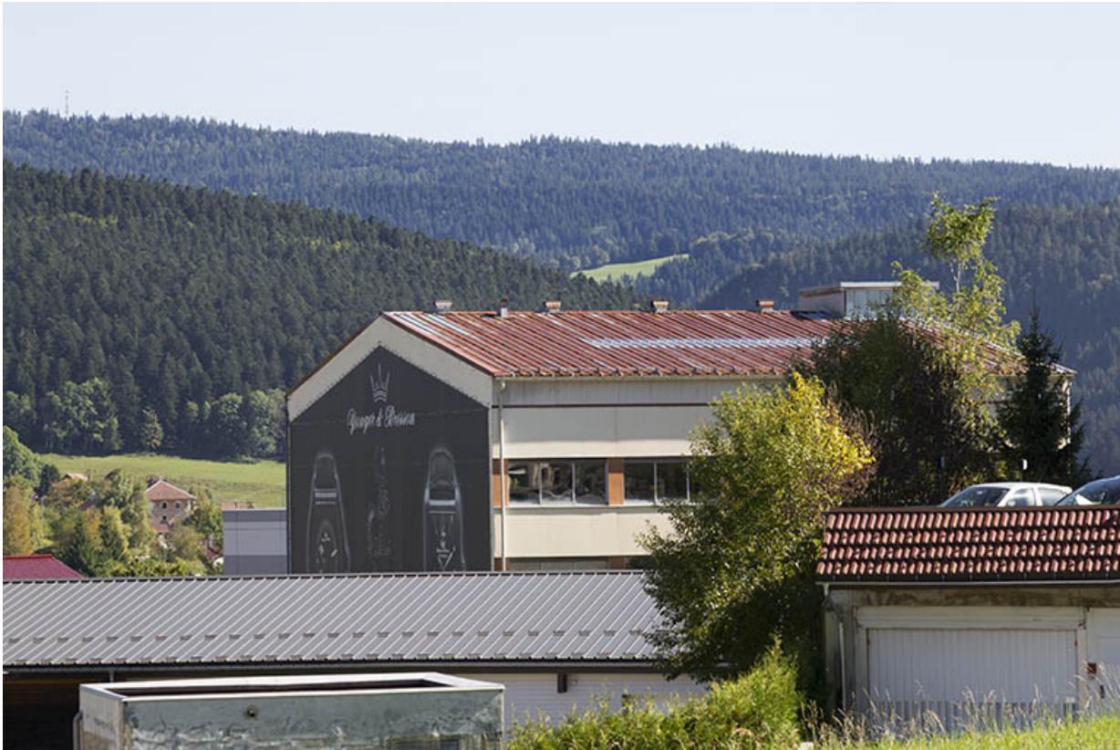
Corps nord : façades postérieure et latérale droite.

25, Morteau, 1 et 1A rue Fontaine-l'Epine