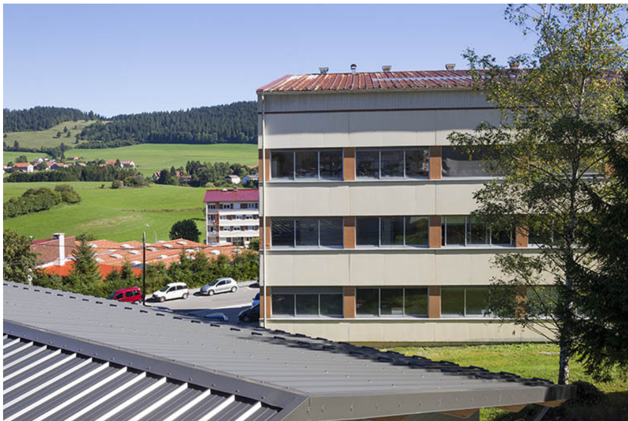
Corps nord : façade postérieure.

25, Morteau, 1 et 1A rue Fontaine-l'Epine