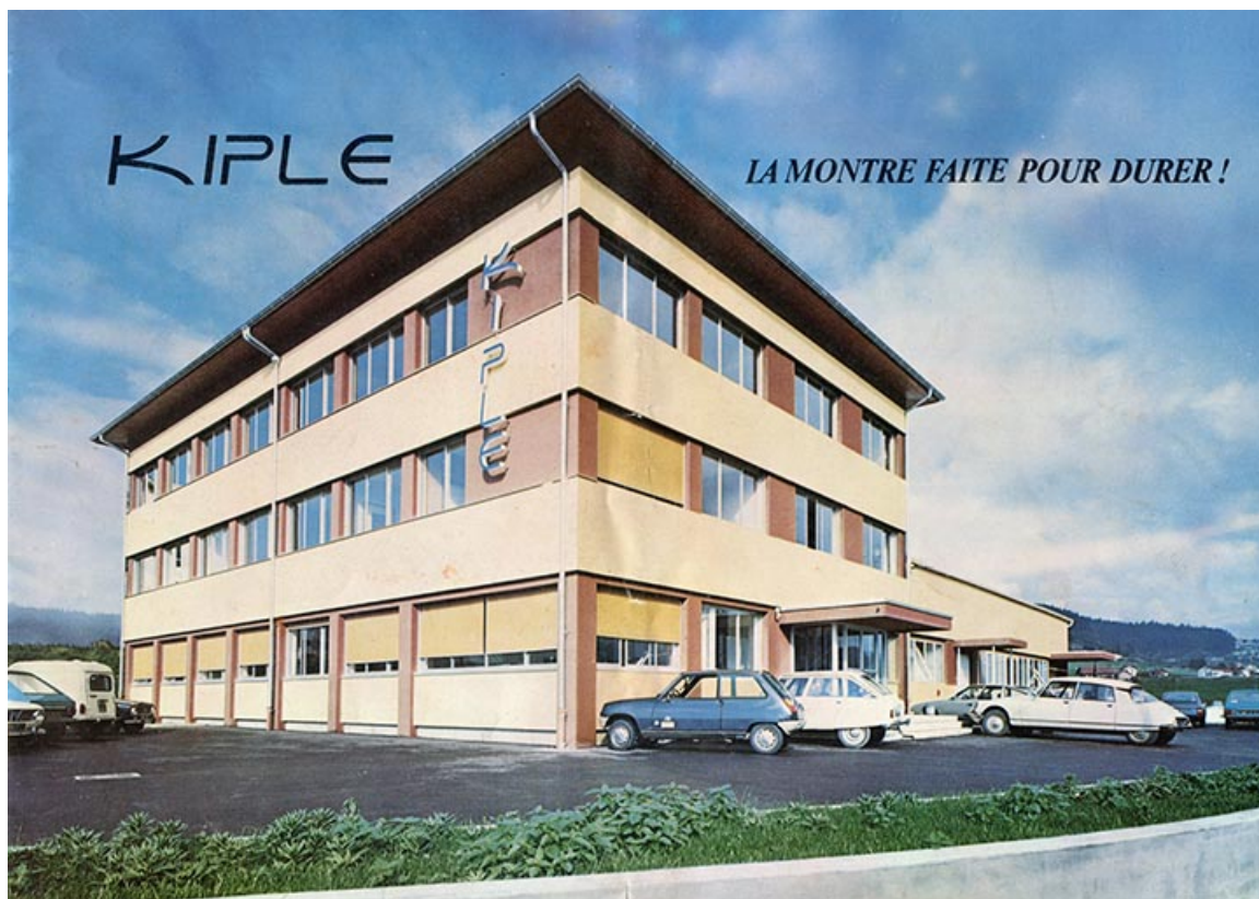
[L'usine vue de trois quarts gauche : 1ère de couverture d'un catalogue], vers 1980. 25, Morteau, 1 et 1A rue Fontaine-l'Epine