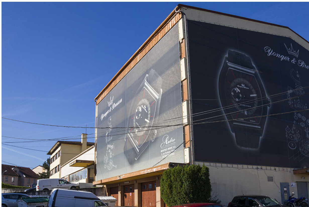
Corps nord : façades antérieure et latérale droite.

25, Morteau, 1 et 1A rue Fontaine-l'Epine