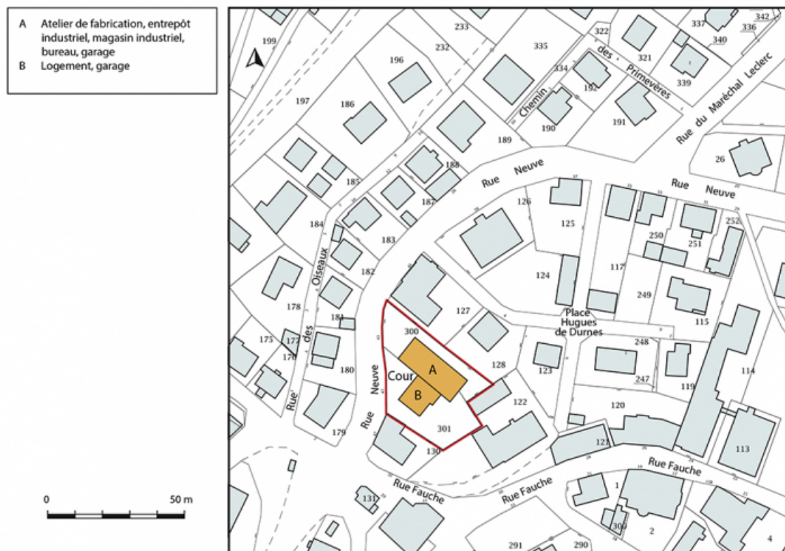
Plan-masse et de situation. Extrait du plan cadastral, 2018, section AC, 1/1 000. 25, Morteau, 43-45 rue Neuve