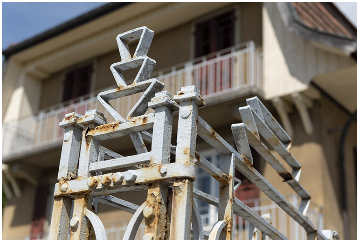
Détail de ferronnerie : couronnement du pilier.