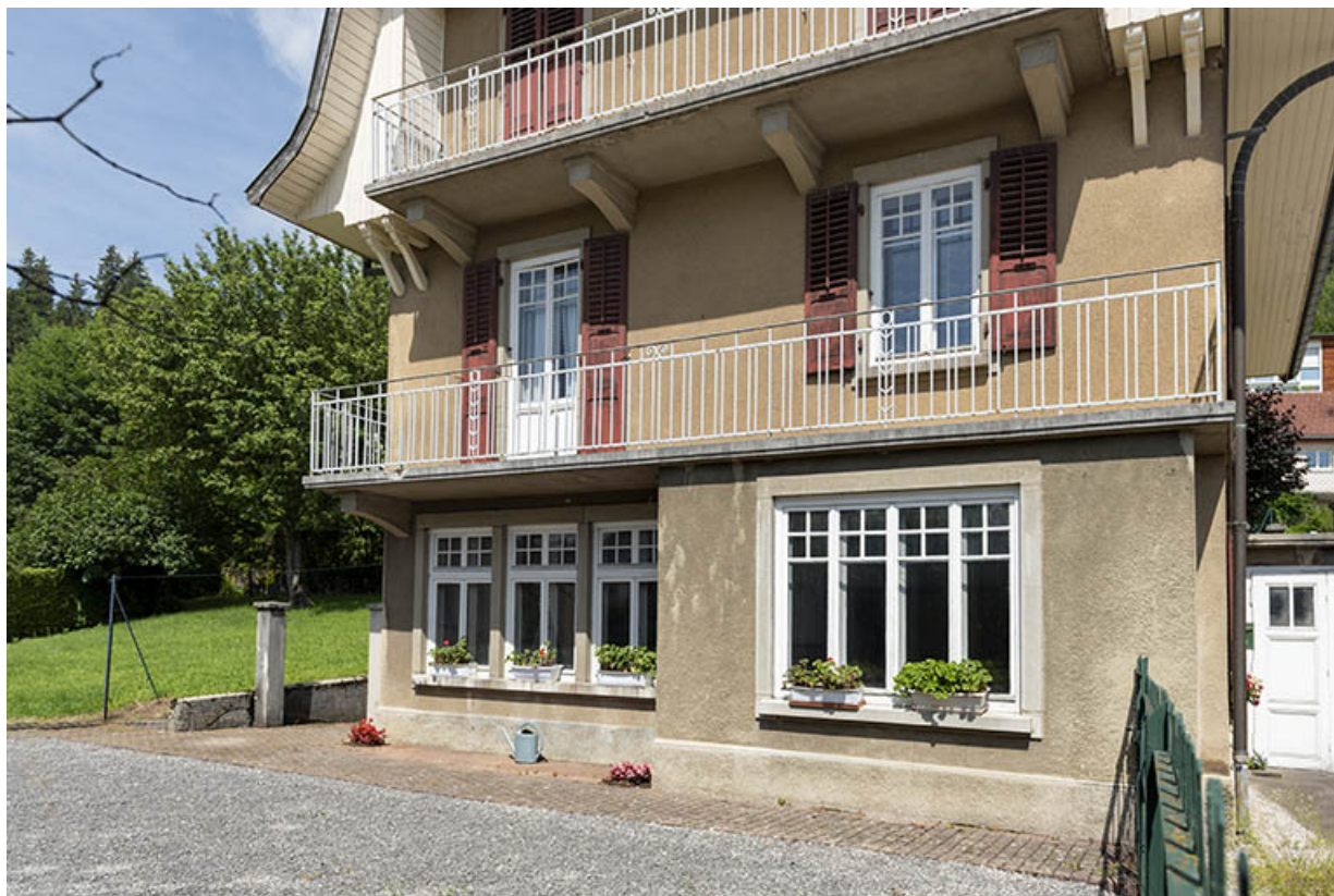
Façade antérieure : rez-de-chaussée et 1er étage.