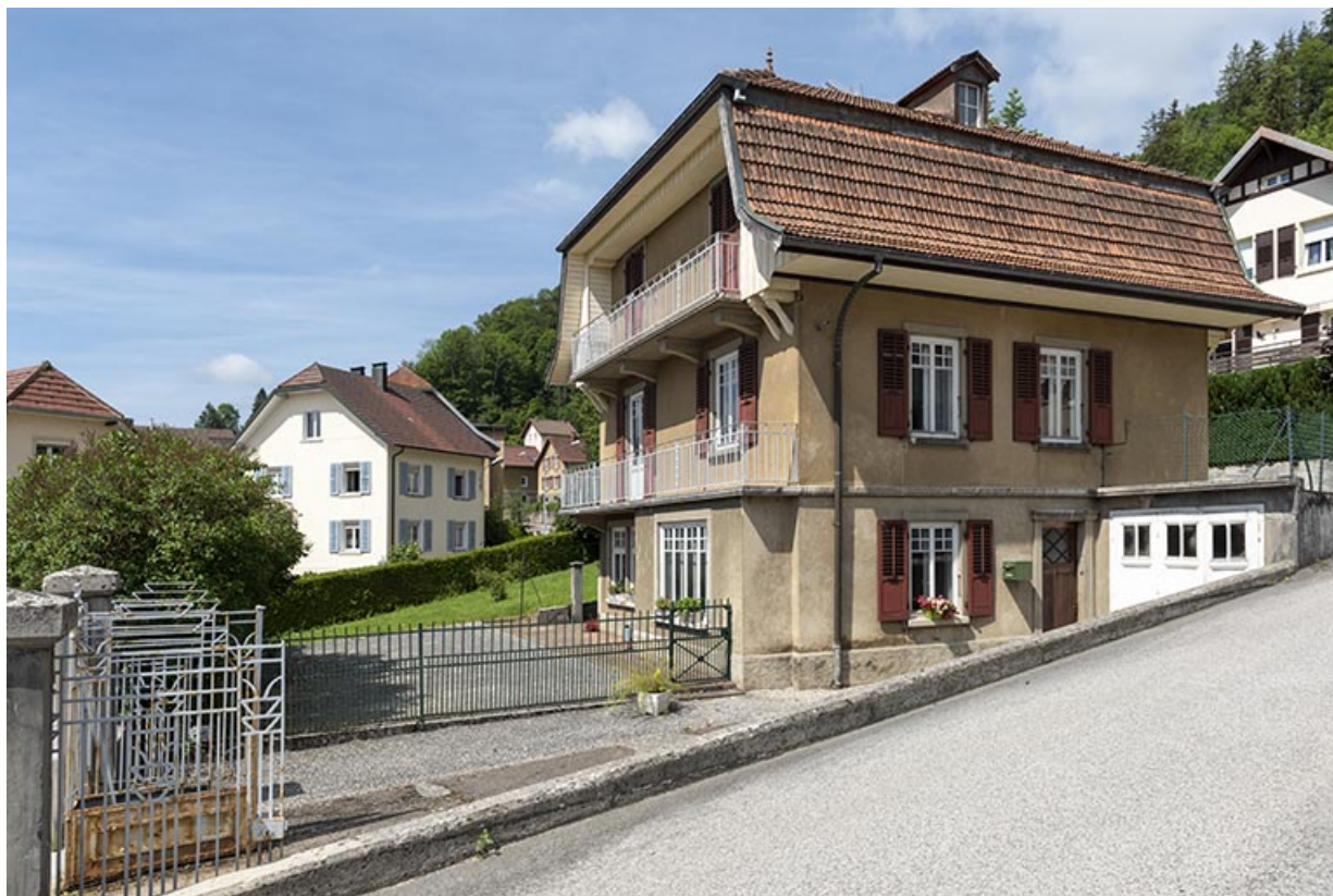
Façade latérale droite, de trois quarts gauche.