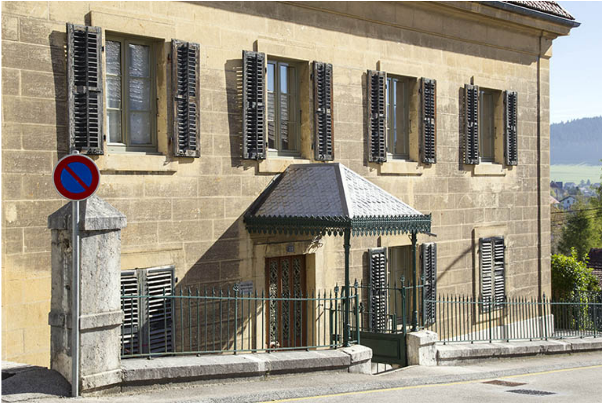
Maison : façade antérieure, de trois quarts gauche.