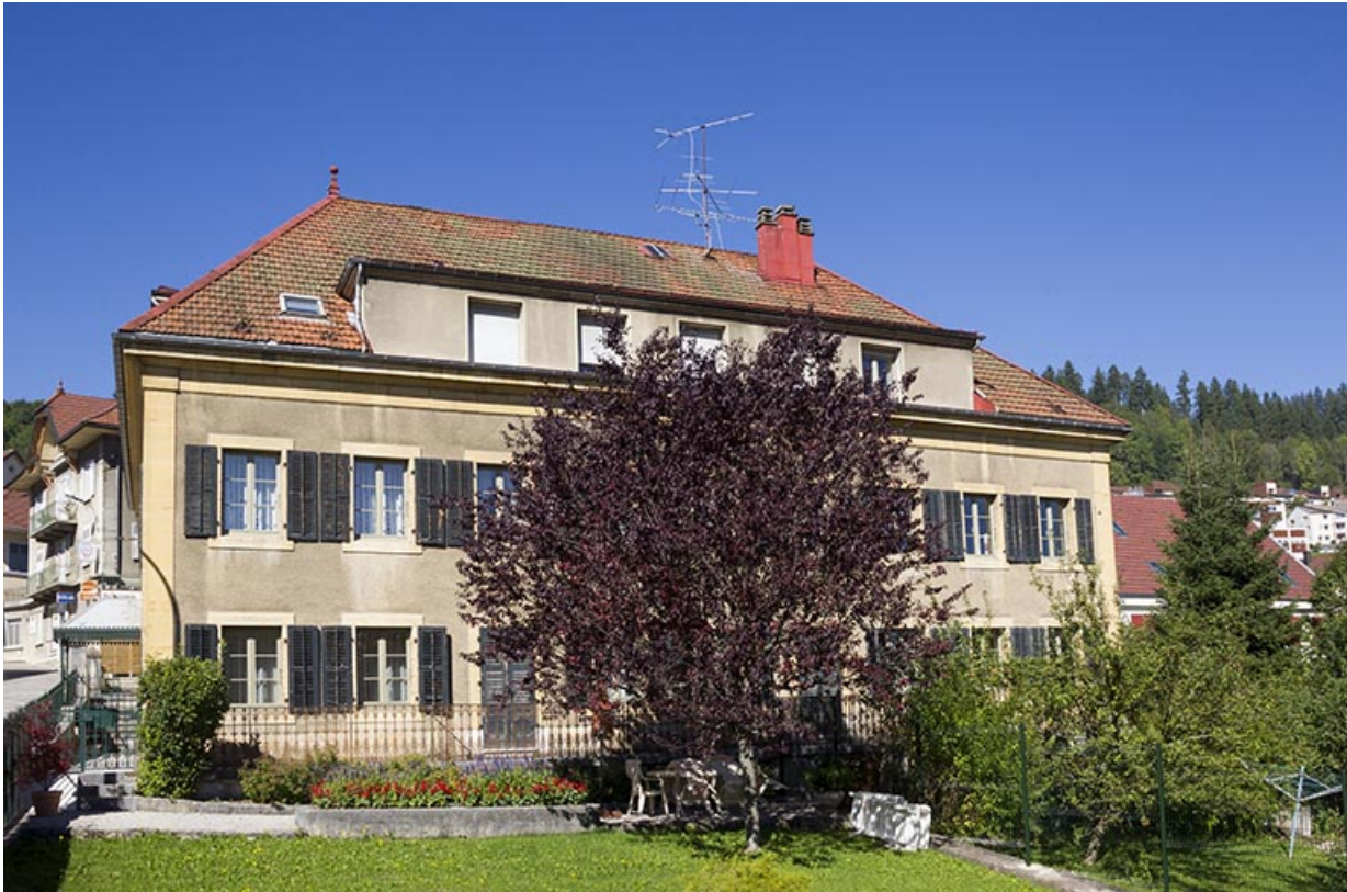
Maison : façade latérale droite.