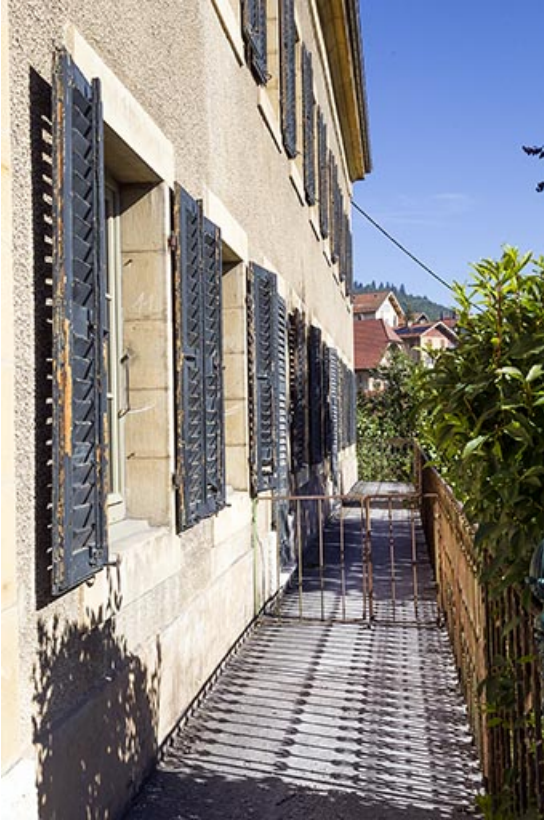
Maison : façade latérale droite, vue en enfilade. 25, Morteau, 22-24 rue Fauche