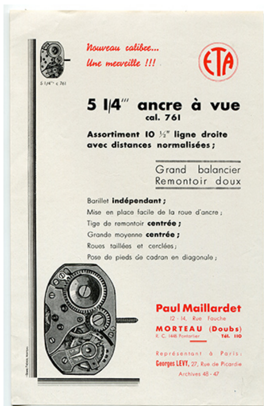
Publicité par Paul Maillardet pour le calibre ETA C 761, années 1950 ? 25, Morteau, 22-24 rue Fauche