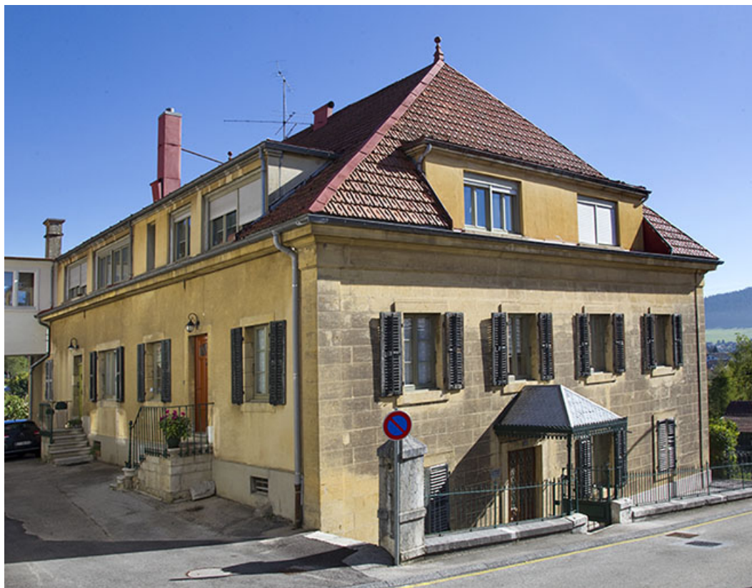
Maison : façades antérieure et latérale gauche.