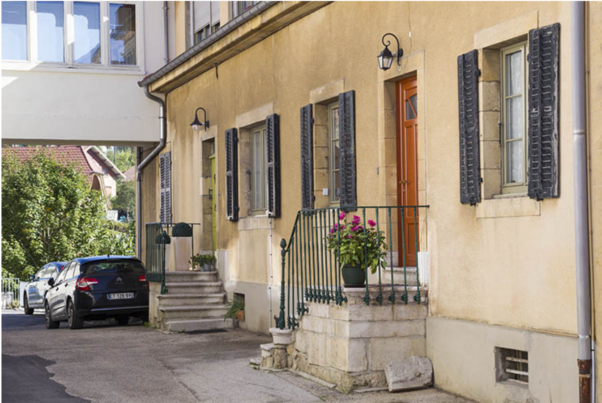
Maison : façade latérale gauche, vue en enfilade. 25, Morteau, 22-24 rue Fauche