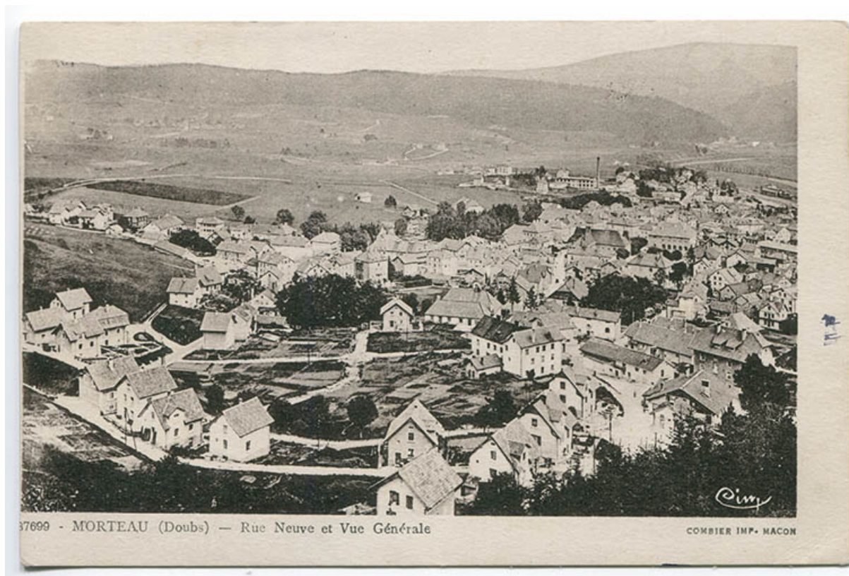
87699 - Morteau (Doubs) - Rue neuve et vue générale, 2e quart 20e siècle [après 1932]. 25, Morteau