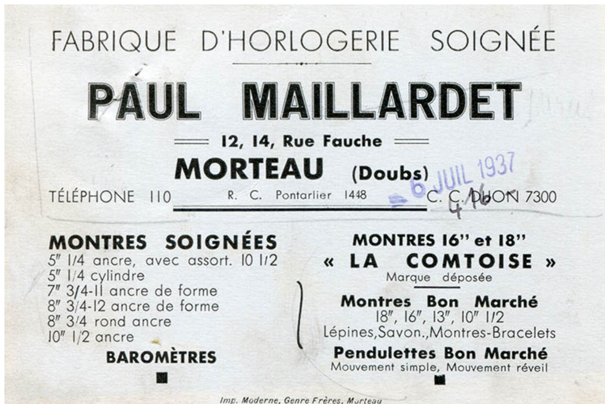
Carte publicitaire des Ets Paul Maillardet, 1937. 25, Morteau, 22-24 rue Fauche