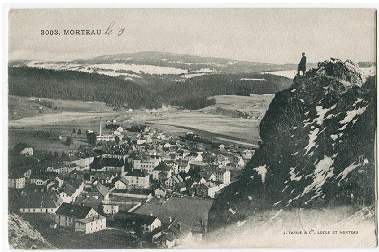
3003. Morteau [vue d'ensemble plongeante depuis le nord], limite 19e siècle 20e siècle [entre 1896 et 1904]. Les deux bâtiments sont visibles en bas à gauche.