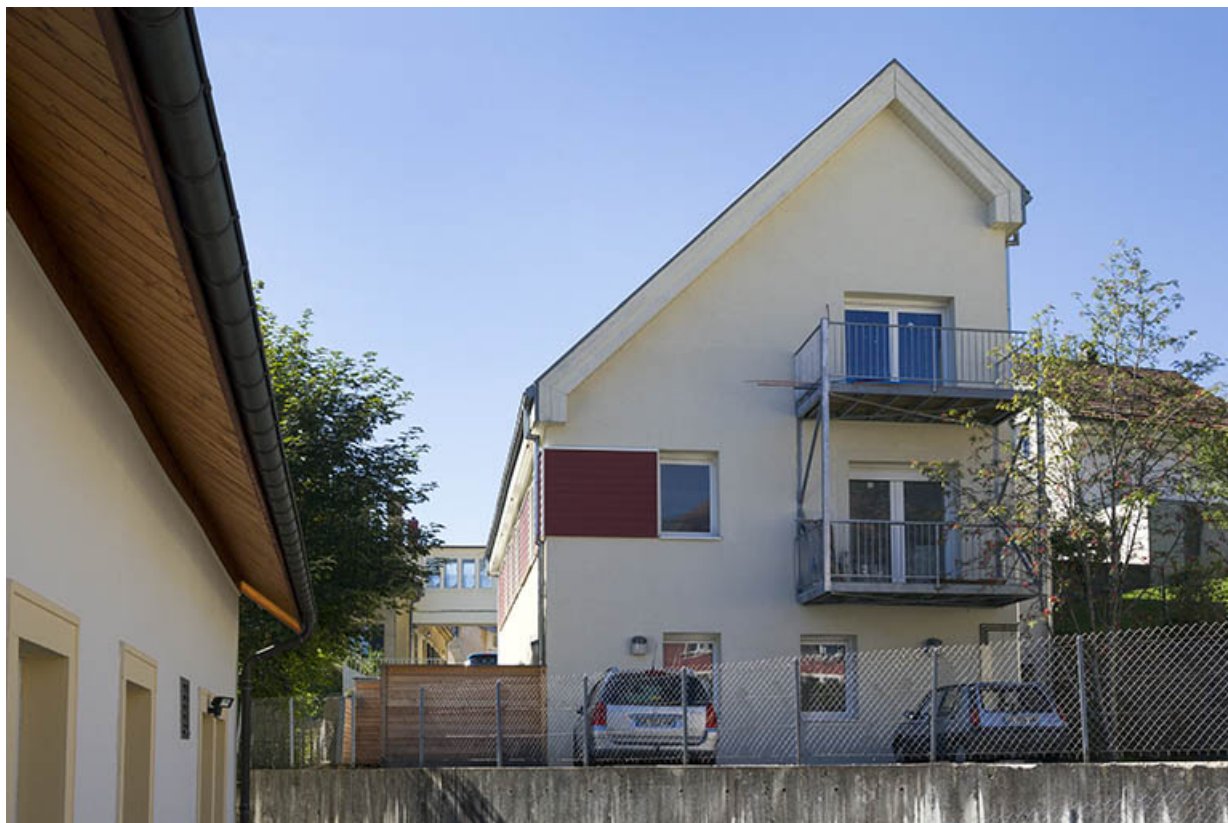
Façade nord du troisième corps de bâtiment.