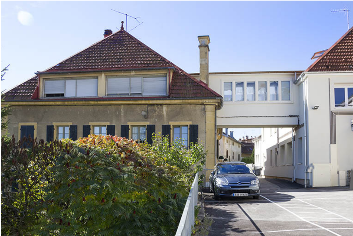
Maison : façade postérieure et passerelle. 25, Morteau, 22-24 rue Fauche