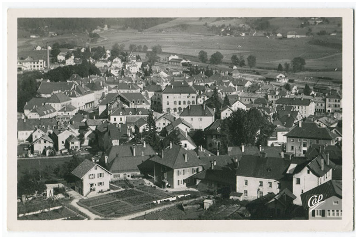
6 Morteau - Vue générale [depuis le nord], 3e quart 20e siècle [entre 1949 et 1953].