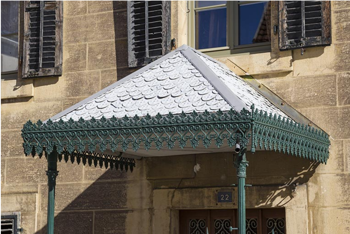
Maison : couverture de l'auvent sur la façade antérieure.