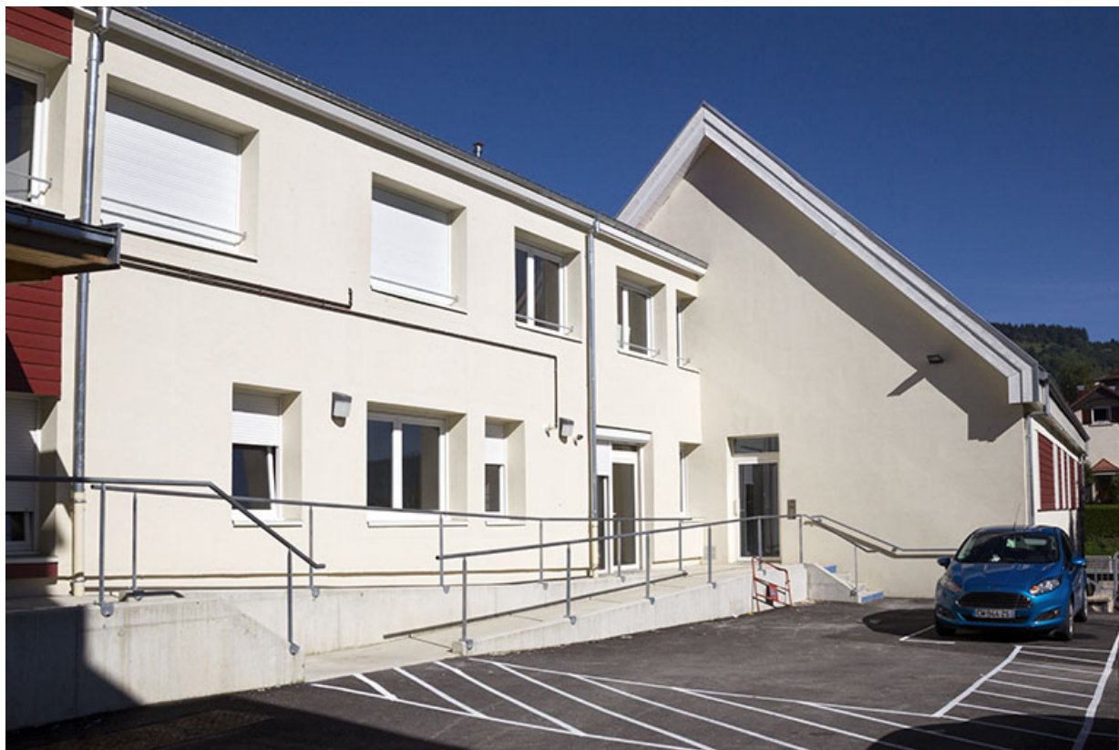
Usine : deuxième et troisième corps de bâtiment.