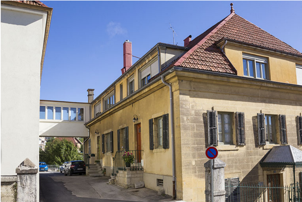
Maison : façade latérale gauche et passerelle. 25, Morteau, 22-24 rue Fauche