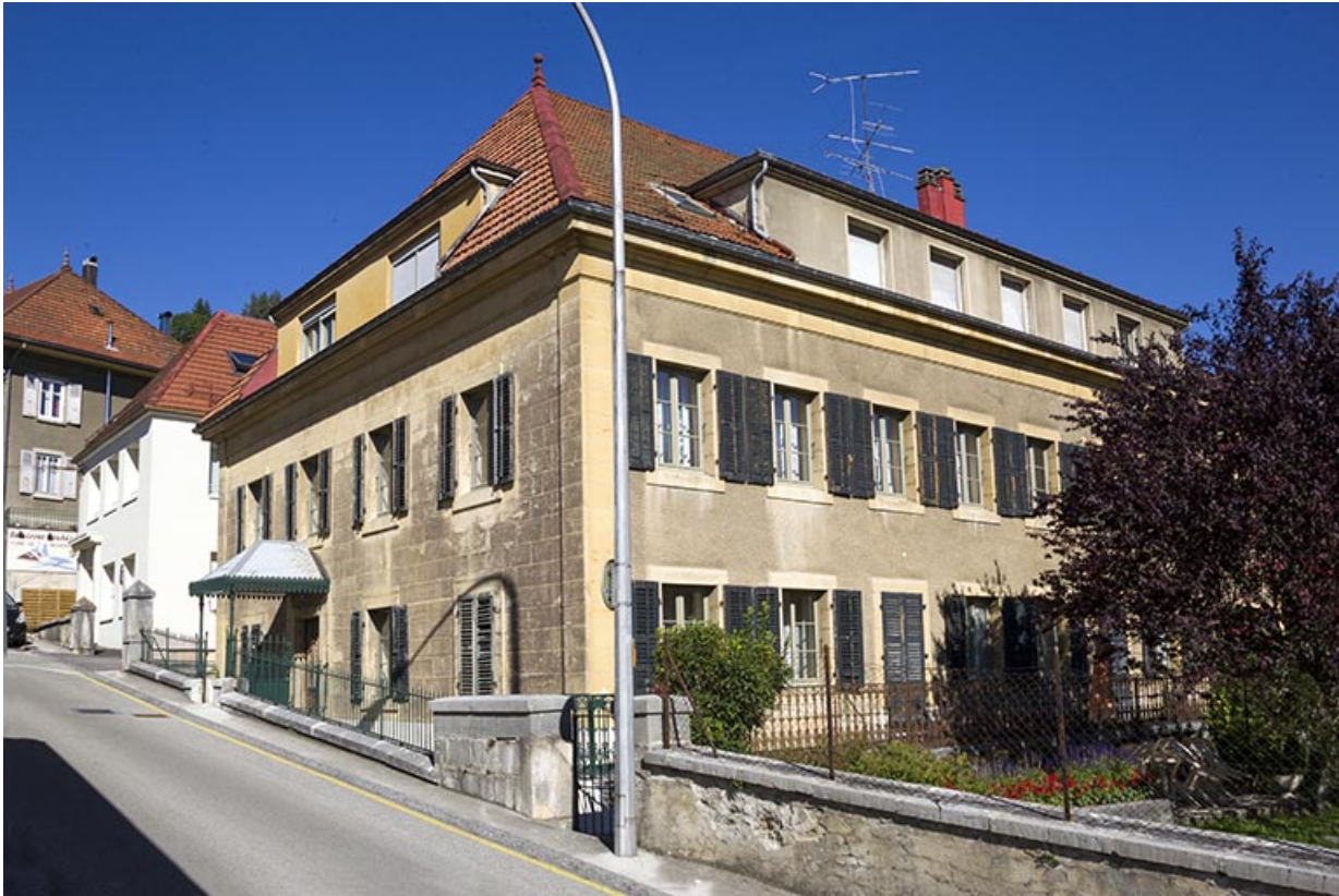
Vue d'ensemble, depuis l'est.