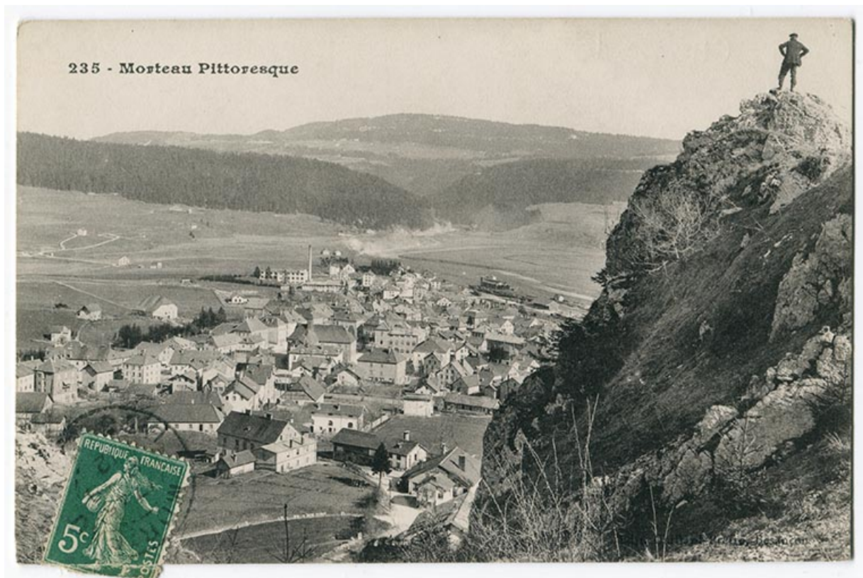
235 - Morteau pittoresque [vue d'ensemble plongeante depuis le nord], 1er quart 20e siècle [entre 1896 et 1912]. Les deux bâtiments sont visibles au-dessus du timbre.