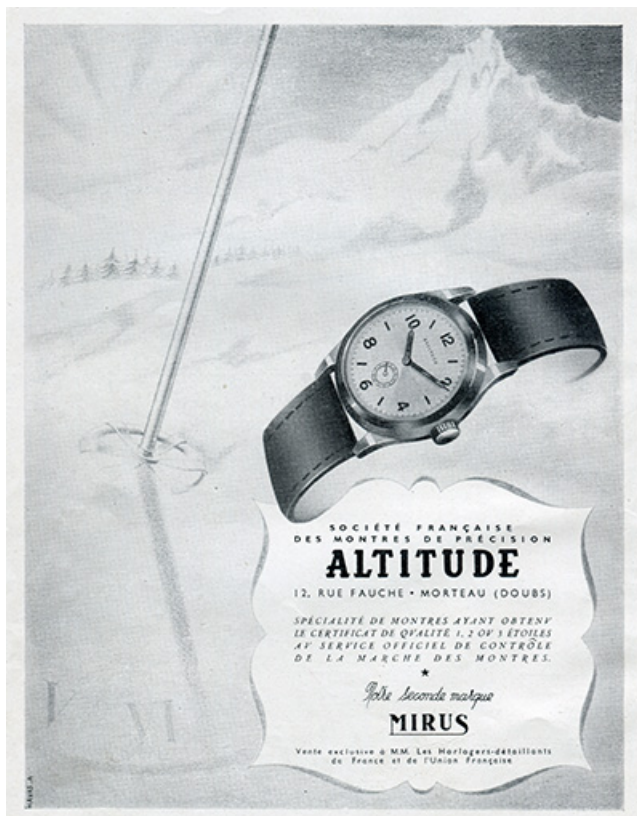
Publicité pour la Société française des Montres de Précision Altitude, 1947. 25, Morteau, 22-24 rue Fauche

Publicités pour la Société française des Montres de Précision Altitude et pour les Ets Paul Maillardet et Fils, 1947. Extraites de : Les ébauches françaises (les calibres français) / Documentation réunie par : Christian Johanet. - Paris : Revue française des Bijoutiers Horlogers, Pierre Johanet, s.d. [1947], p. 26 et 38 : ill. Lieu de conservation : Musée de l'Horlogerie, Morteau