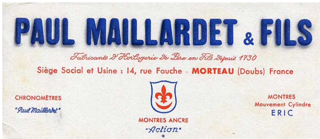
Buvard des Ets Paul Maillardet & Fils, milieu 20e siècle.