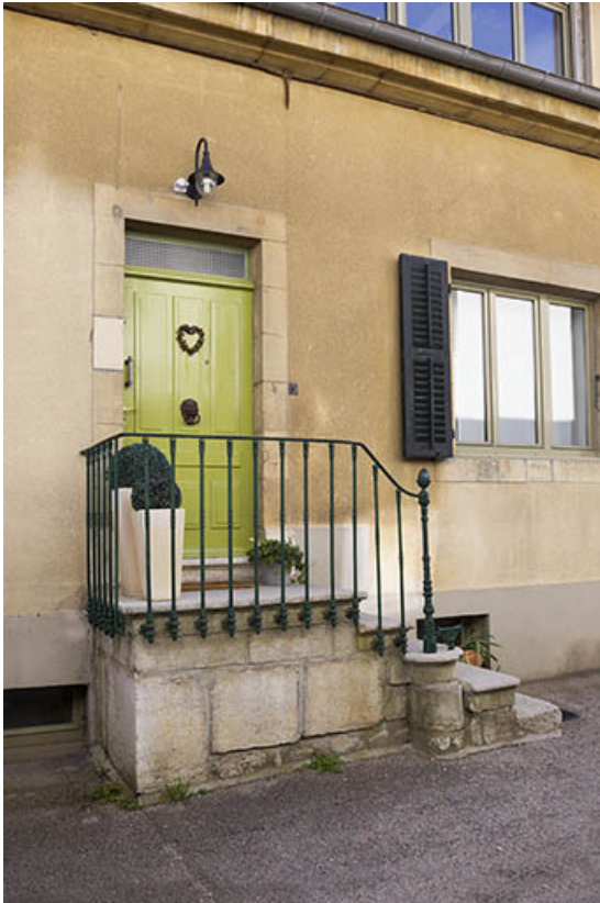
Maison : escalier extérieur sur la façade latérale gauche.