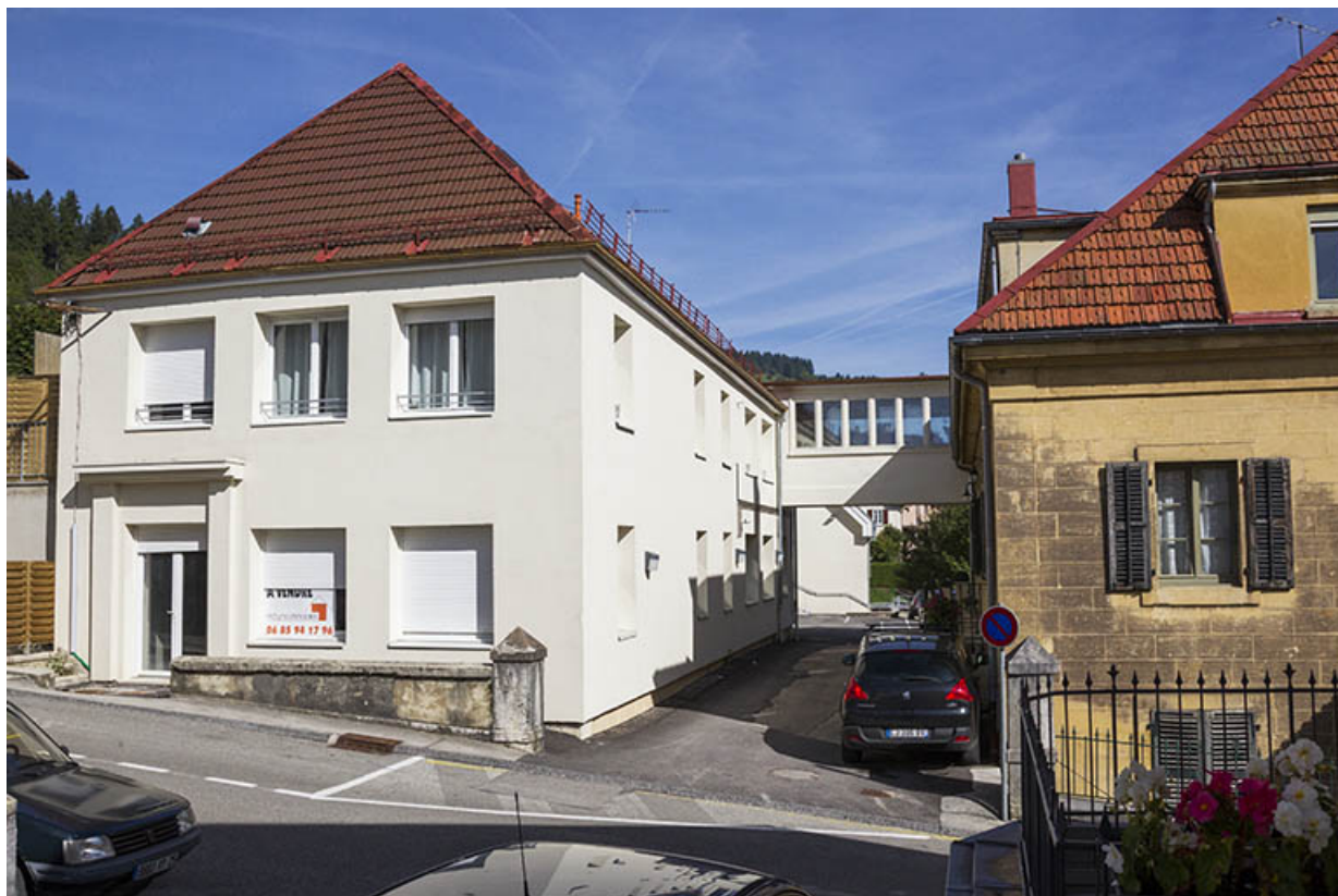
Usine : façades antérieure et latérale droite du premier corps de bâtiment, avec la passerelle. 25, Morteau