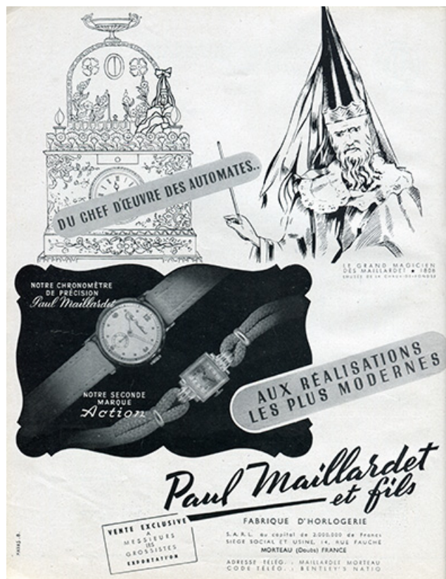
Publicité pour les Ets Paul Maillardet et Fils, 1947.