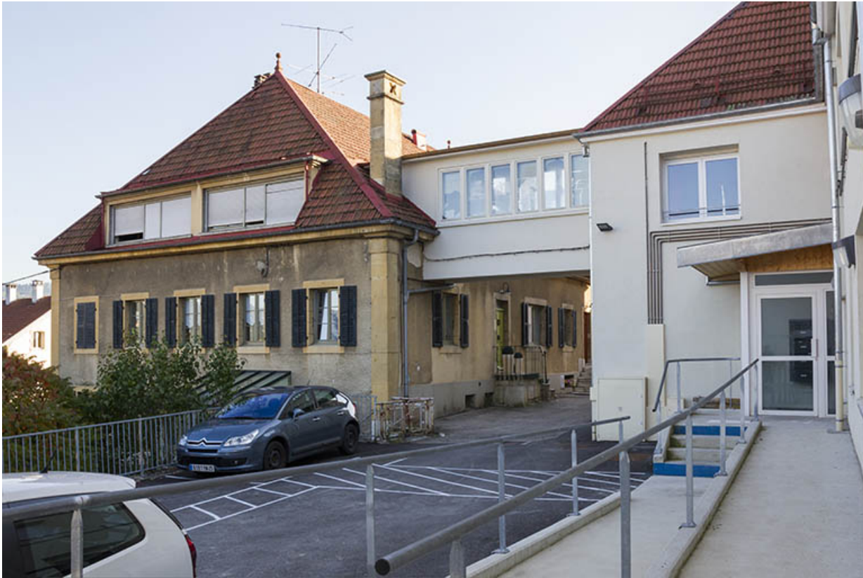
Usine : façade postérieure du premier corps de bâtiment, avec la passerelle d'accès à la maison. 25, Morteau, 22-24 rue Fauche