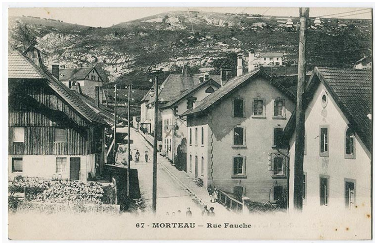
67 - Morteau - Rue Fauche, 1er quart 20e siècle. Le pignon de la maison est visible au premier plan à droite. 25, Morteau