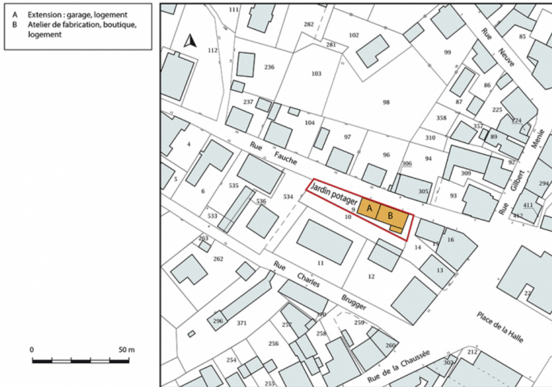
Plan-masse et de situation. Extrait du plan cadastral, 2018, section AA, 1/1 000. 25, Morteau, 5, 7 rue Fauche