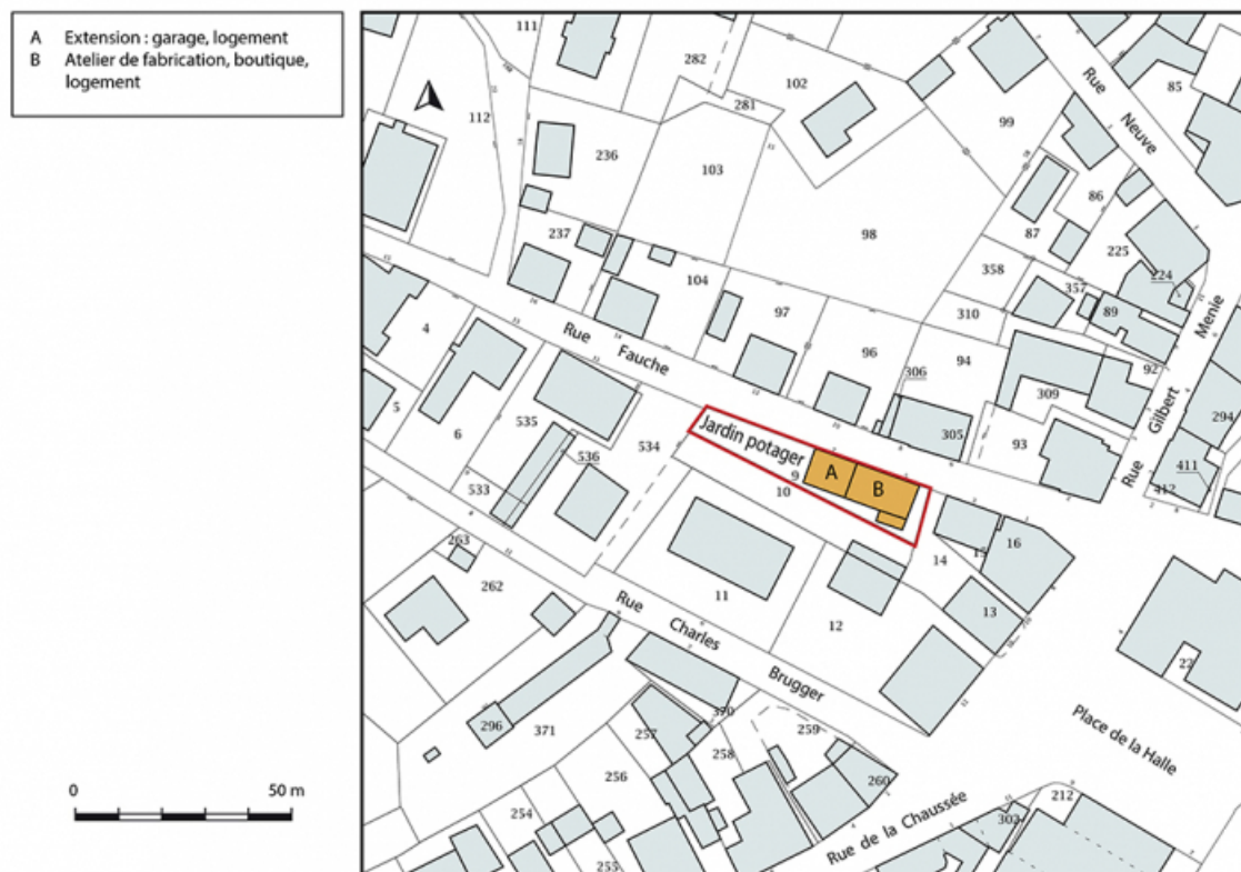
Plan-masse et de situation. Extrait du plan cadastral, 2018, section AA, 1/1 000. 25, Morteau, 5, 7 rue Fauche