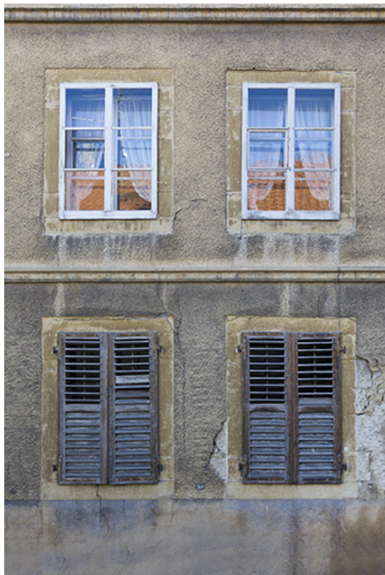
Maison : fenêtre de la façade antérieure.