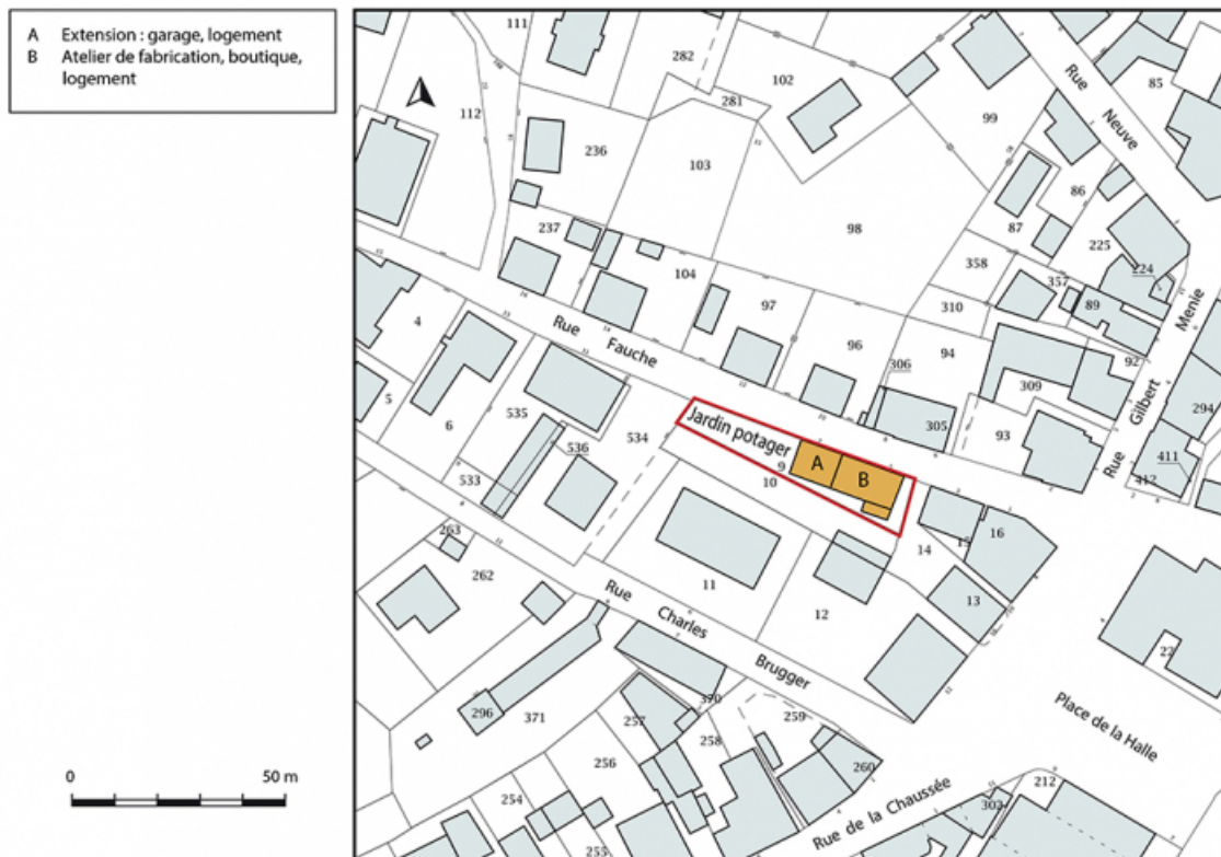
Plan-masse et de situation. Extrait du plan cadastral, 2018, section AA, 1/1 000. 25, Morteau, 5, 7 rue Fauche