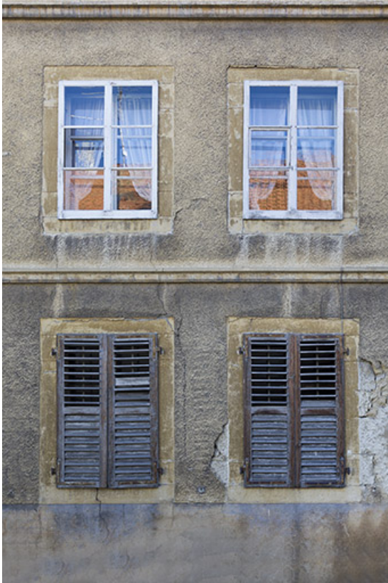
Maison : fenêtre de la façade antérieure.