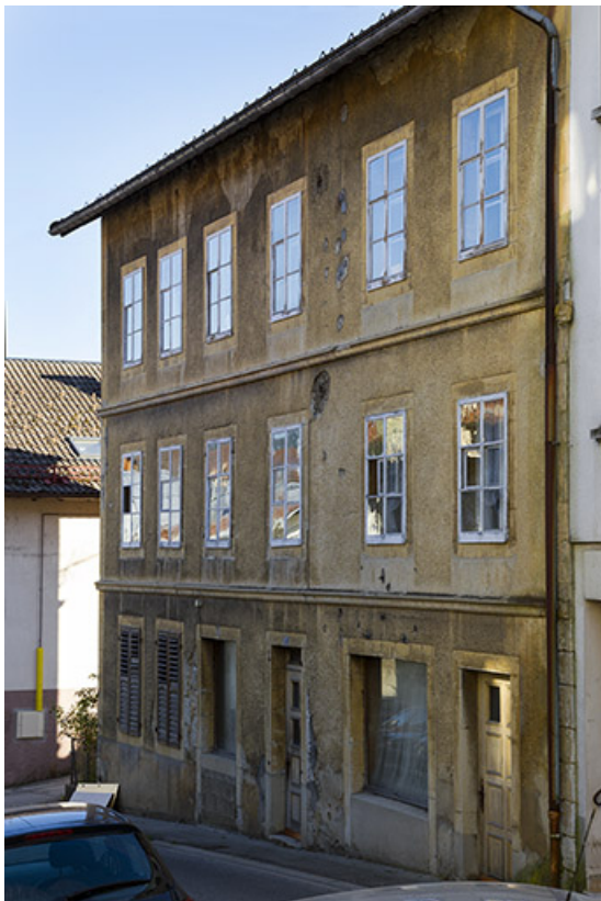
Maison : façade antérieure, de trois quarts droite. 25, Morteau, 5, 7 rue Fauche