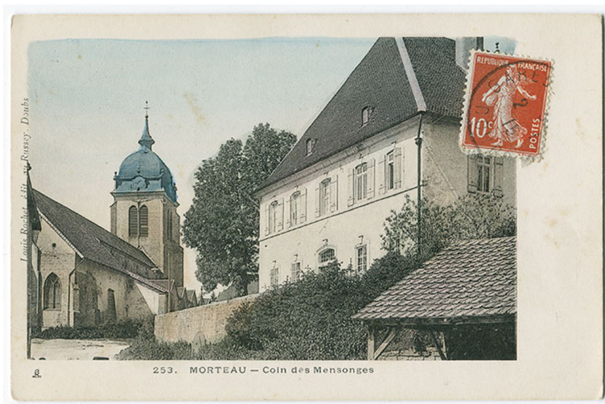
253. Morteau - Coin des Mensonges, 4e quart 19e siècle.