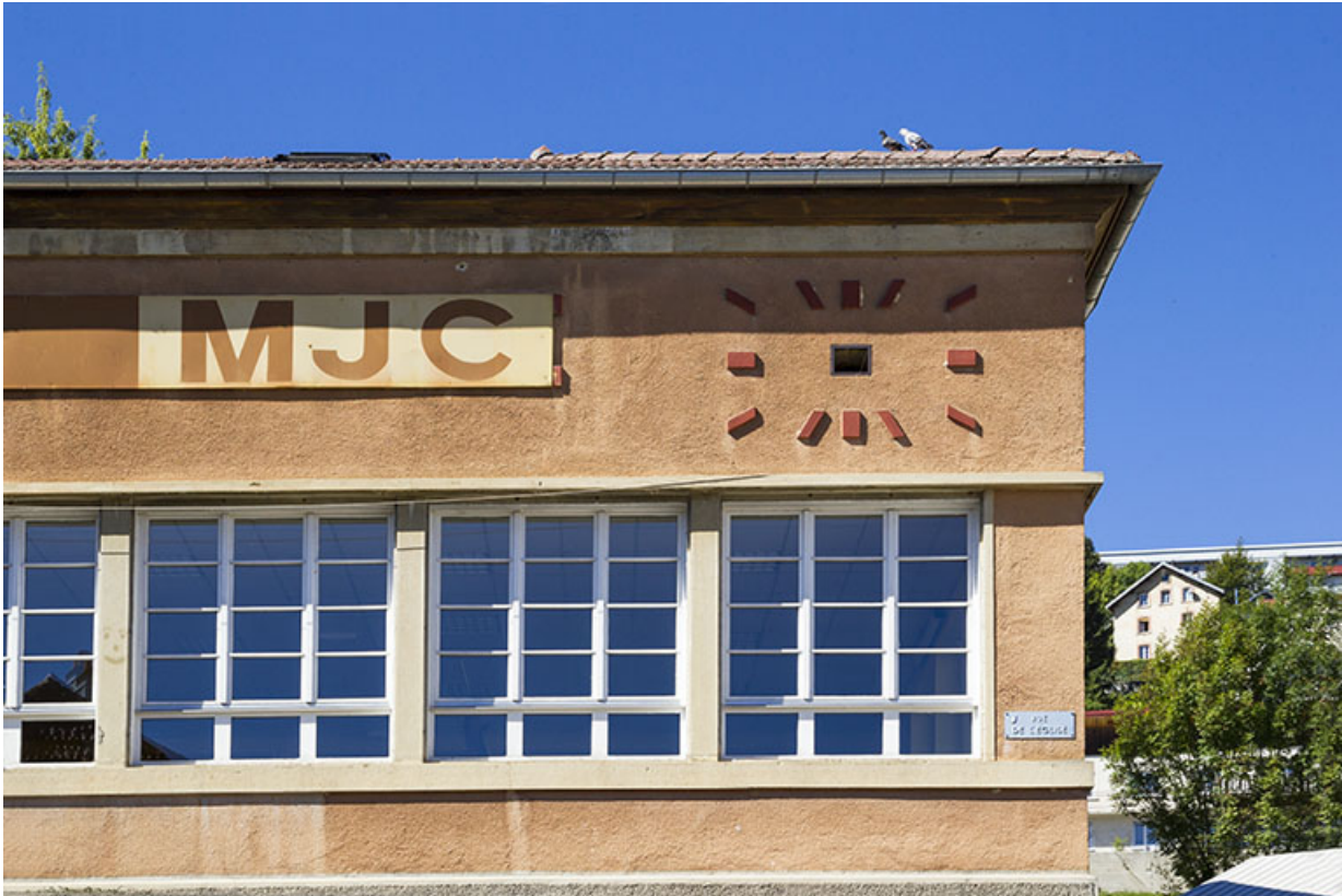
Inscription MJC et cadran de l'ancienne horloge monumentale (façade antérieure de l'atelier). 25, Morteau, 2 place de l' Eglise