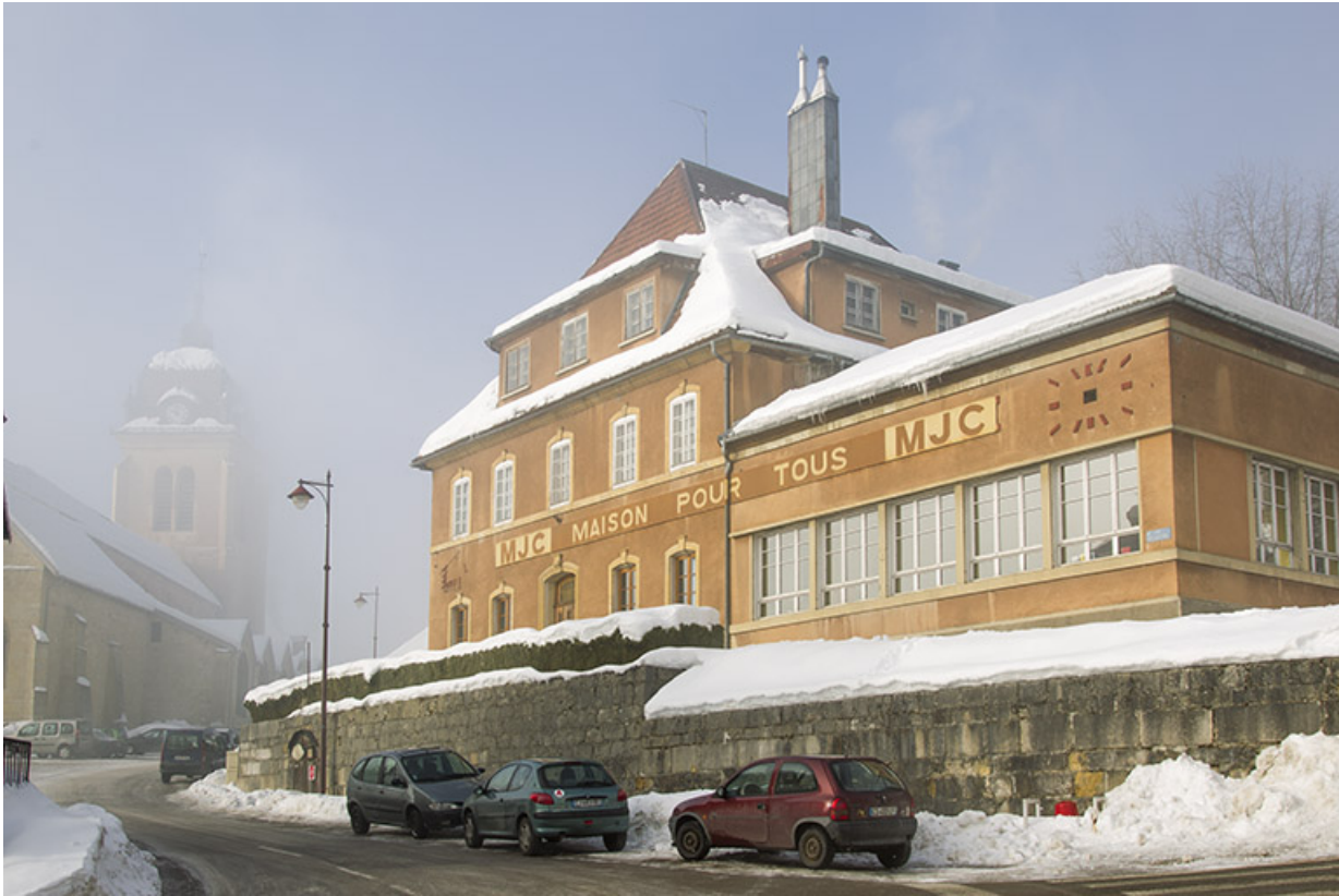
Vue d'ensemble, depuis l'est, en hiver.