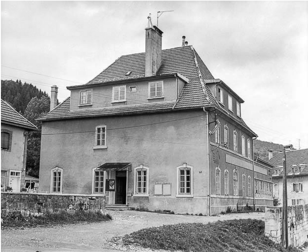
Morteau, rue de l'Eglise (actuelle maison des jeunes) : vue d'ensemble.