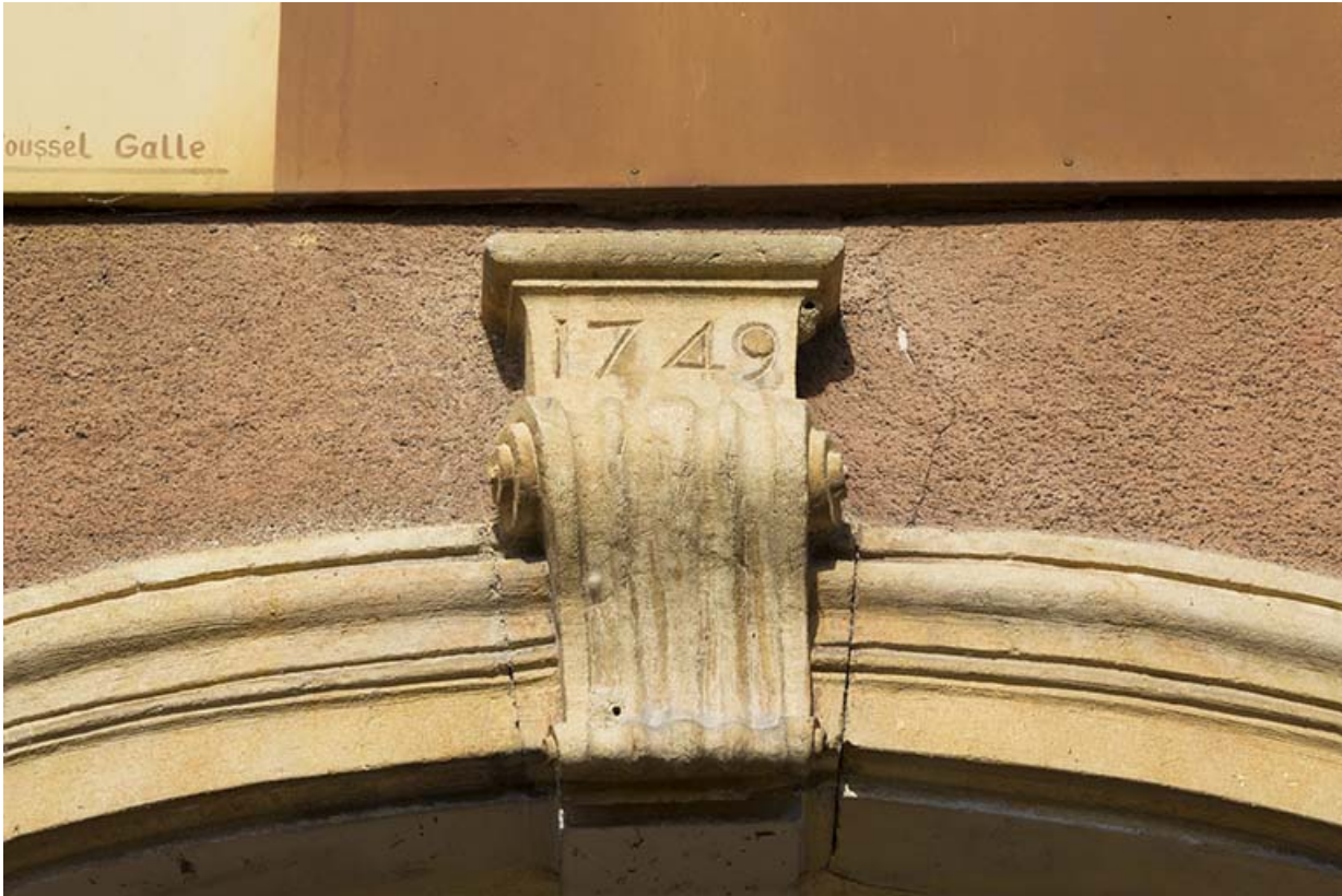
Date 1749 sur la clé de la porte principale (façade antérieure).