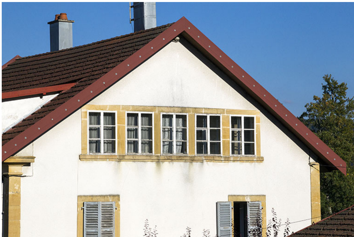
Pignon occidental : fenêtres multiples.