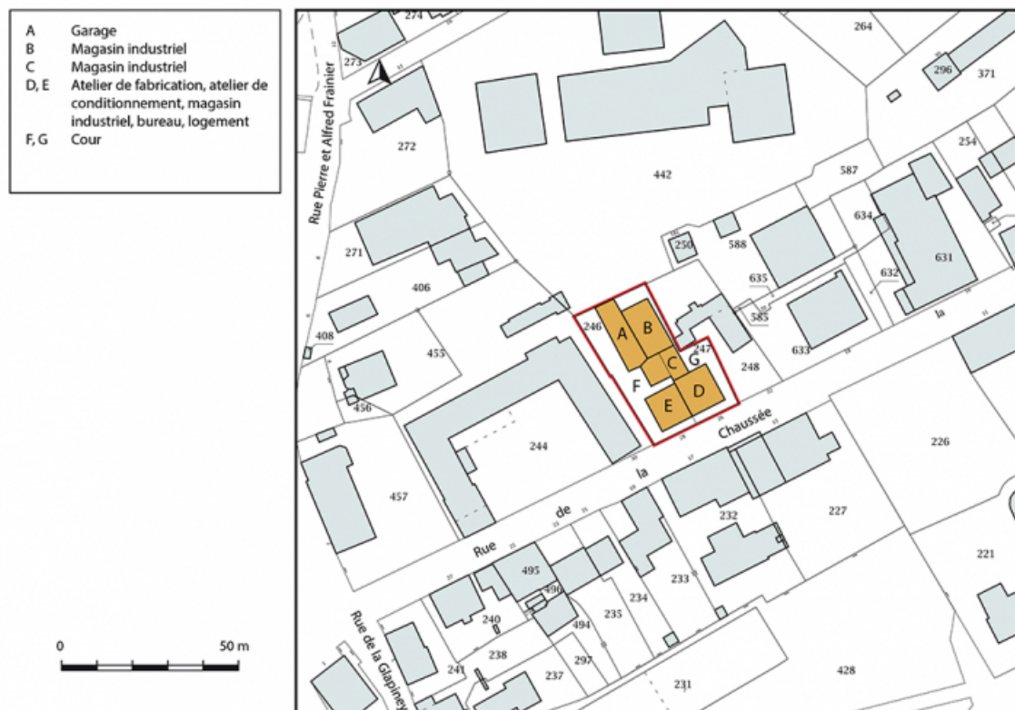
Plan-masse et de situation. Extrait du plan cadastral, 2018, section AA, 1/1 000. 25, Morteau, 26-28 rue de la Chaussée