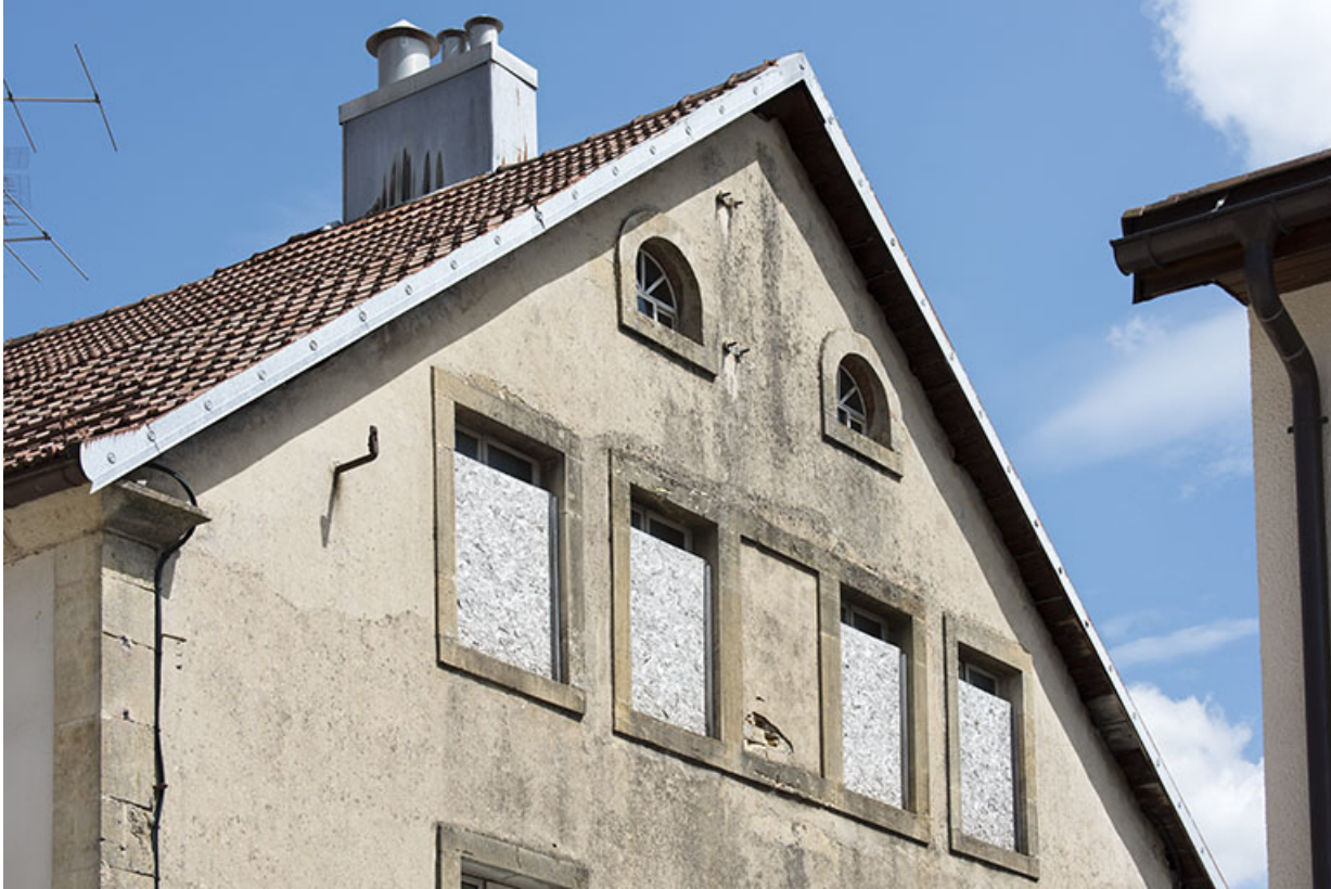
Façade latérale droite : fenêtres multiples dans le pignon.