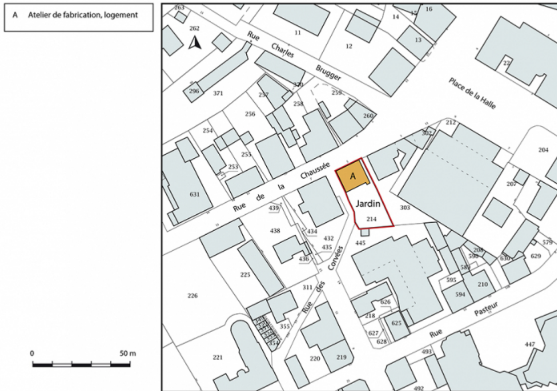
Plan-masse et de situation. Extrait du plan cadastral, 2018, section AA, 1/1 000.