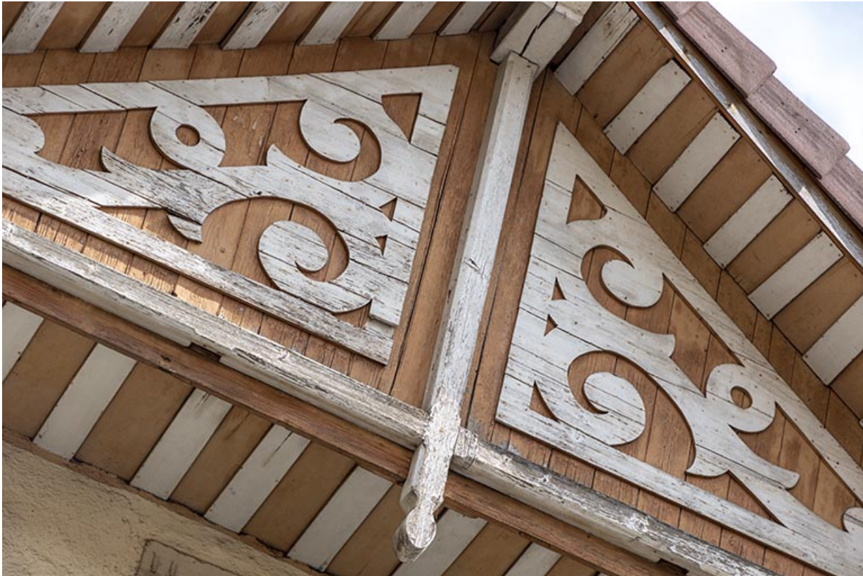
Maison au n° 1 rue Pasteur, façade antérieure : décor du pignon.