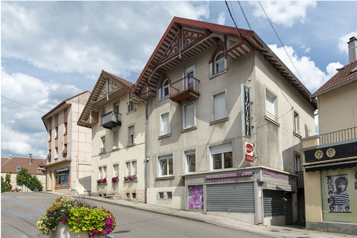
Façades antérieures, de trois quarts droite. 25, Morteau