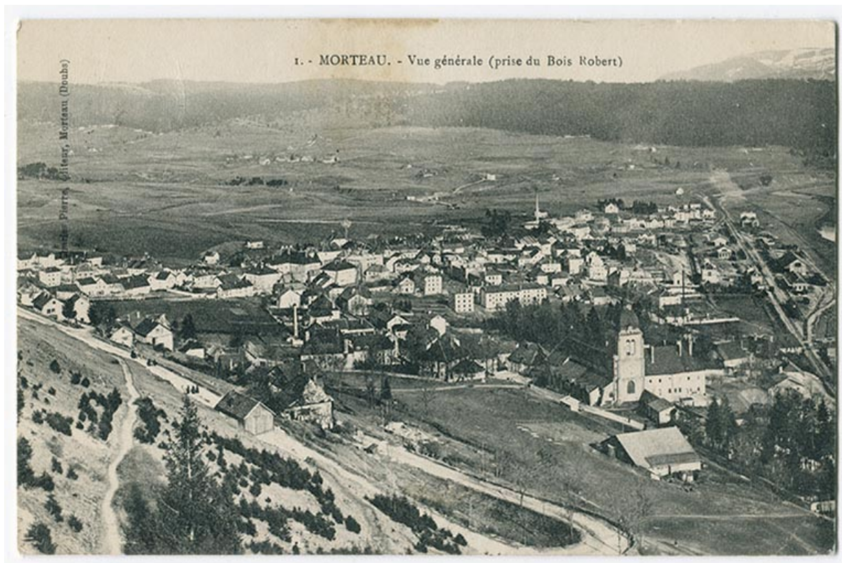
1. - Morteau. - Vue générale (prise du Bois Robert), 1er quart 20e siècle [avant 1911]. L'usine, au centre de l'image, se marque par sa cheminée.