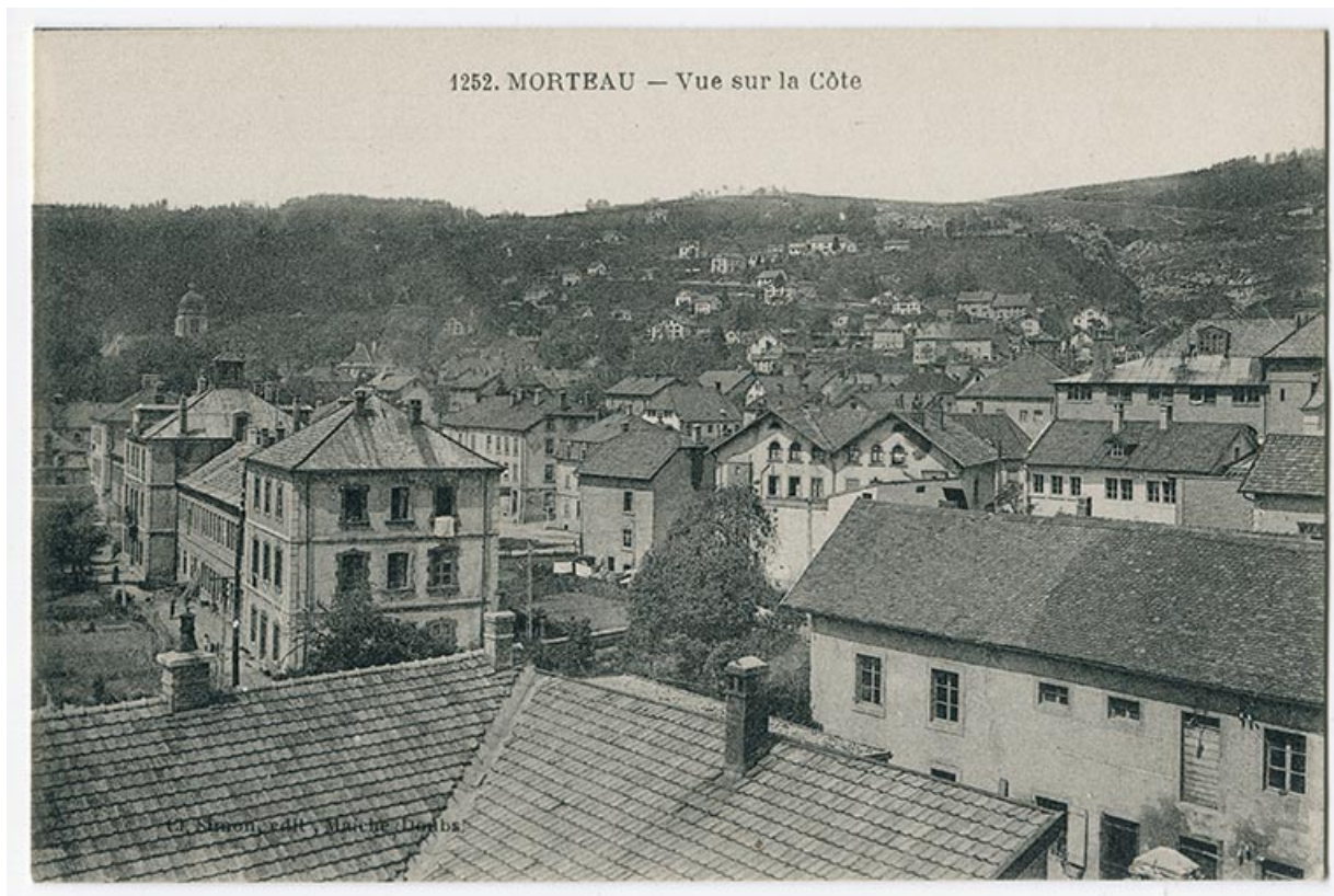
1252. Morteau - Vue sur la Côte, 1er quart 20e siècle. La Grande Fabrique est vue en enfilade à gauche. 25, Morteau