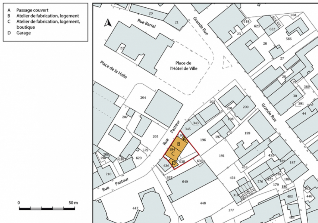
Plan-masse et de situation. Extrait du plan cadastral, 2017, section AA, 1/1 000. 25, Morteau, 1-3 rue Pasteur