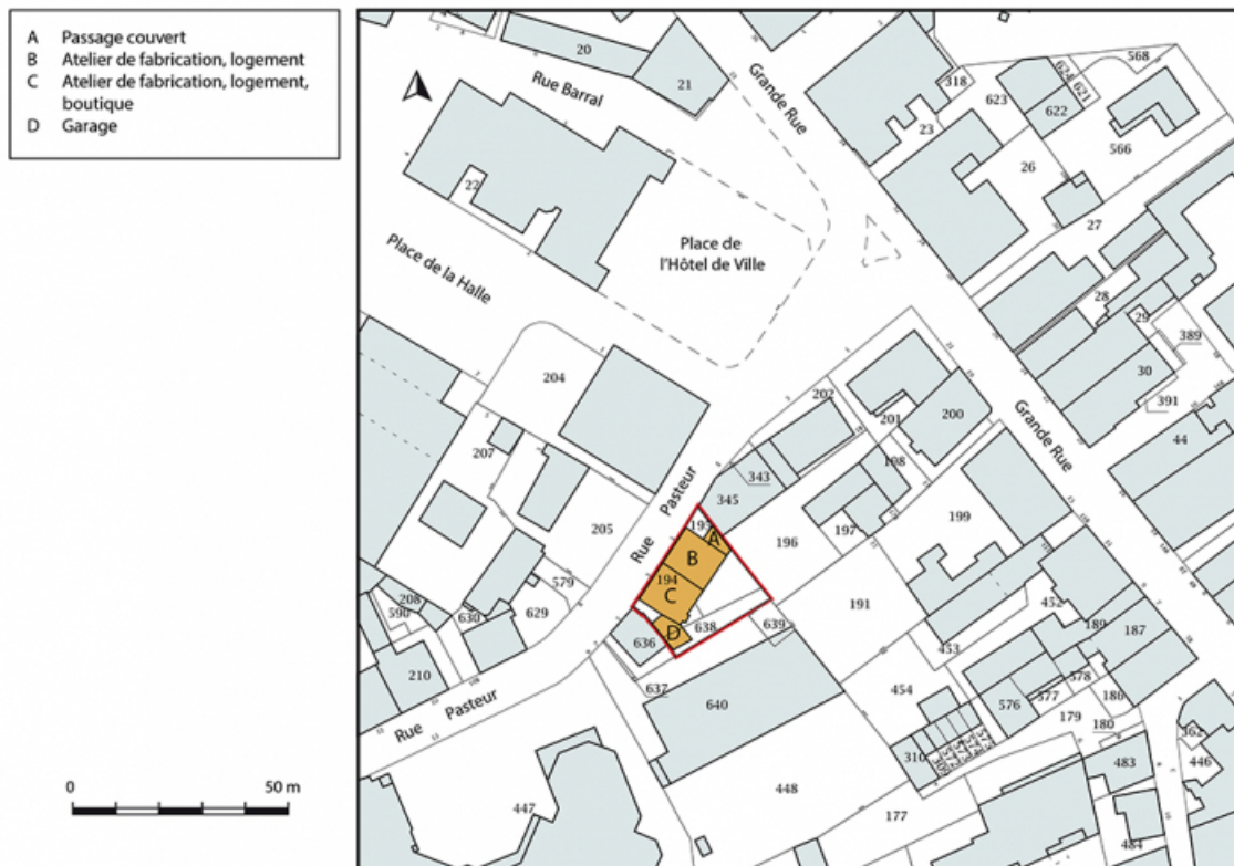
Plan-masse et de situation. Extrait du plan cadastral, 2017, section AA, 1/1 000.