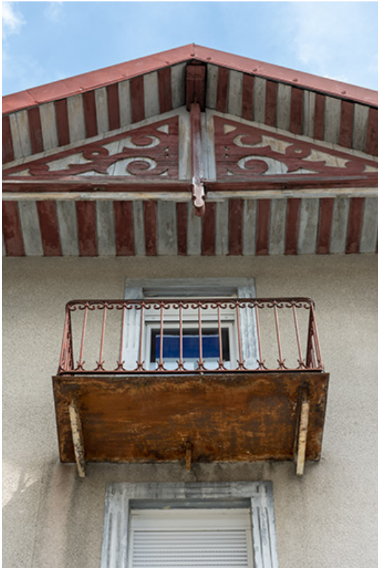
Maison au n° 3 rue Pasteur, façade antérieure : balcon et décor du pignon. 25, Morteau, 1-3 rue Pasteur