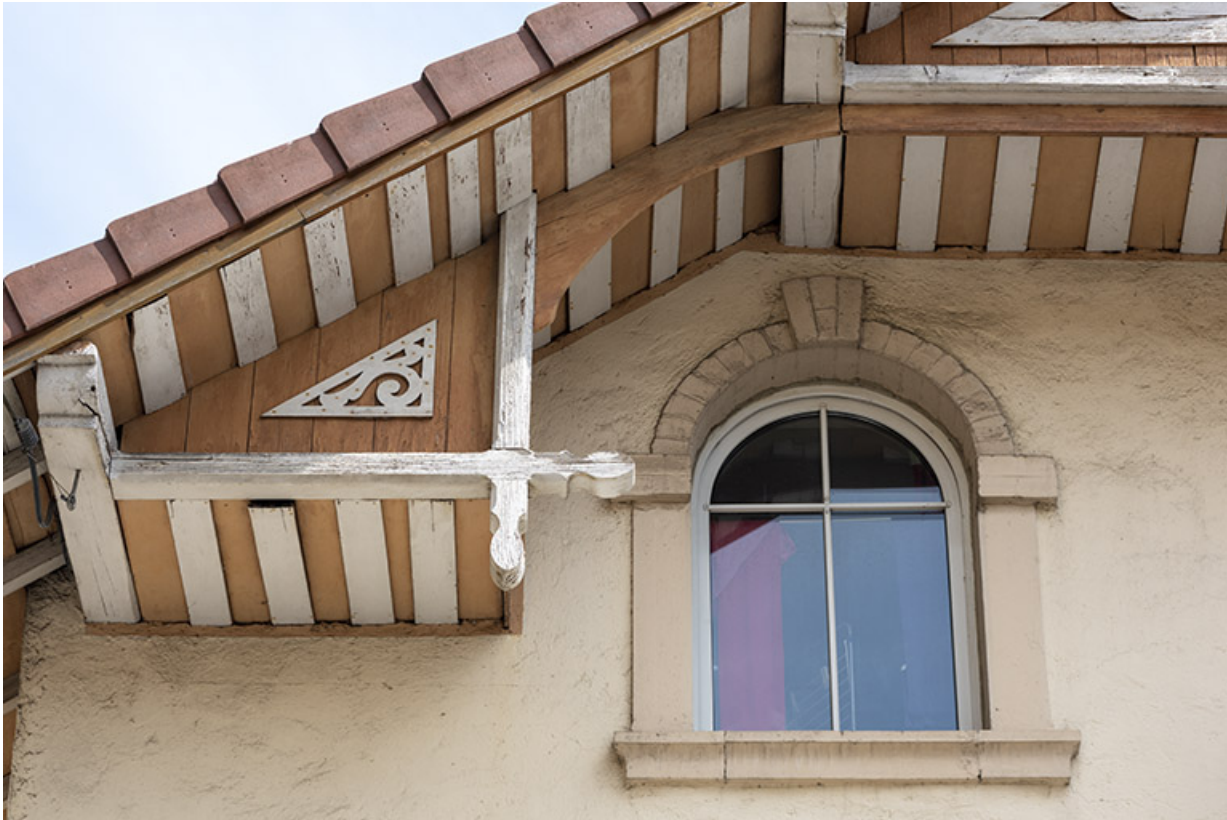
Maison au n° 1 rue Pasteur, façade antérieure : fenêtre et décor en partie haute. 25, Morteau, 1-3 rue Pasteur