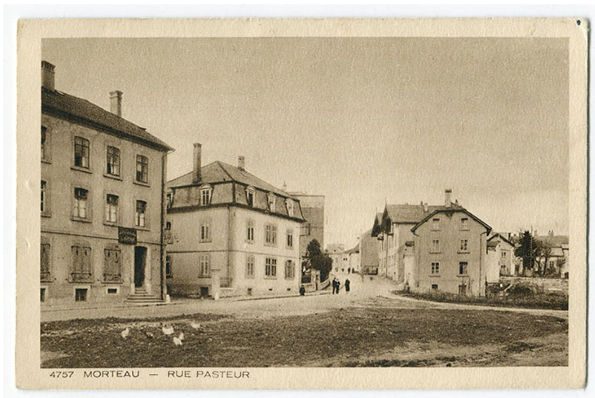
4757 Morteau - Rue Pasteur, 1ère moitié 20e siècle. Les maisons sont visibles au deuxième plan à droite. 25, Morteau

4757 Morteau - Rue Pasteur, carte postale, s.n., s.d. [1ère moitié 20e siècle], Braun et Cie impr.-éd. à Mulhouse-Dornach. Collection Le jura. Publiée dans : Leiser, Henri ; Jacquot, Didier. Morteau et environs d'hier à aujourd'hui. - Pontarlier : Presses du Belvédère, 2010, p. 117.