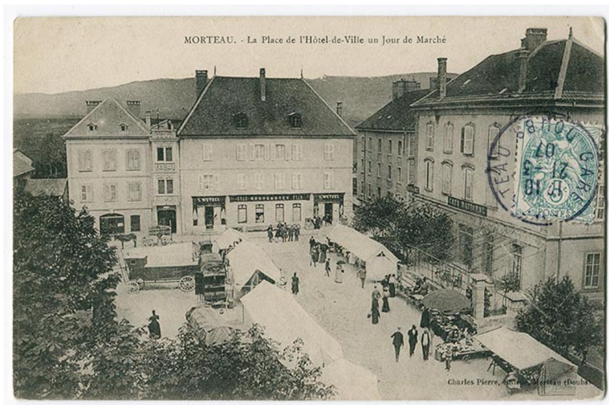
Morteau. - La place de l'Hôtel-de-Ville un jour de marché, limite 19e siècle 20e siècle [avant 1907]. 25, Morteau