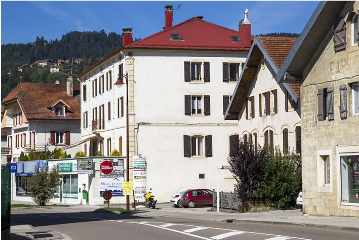
Vue d'ensemble, depuis l'est (façades antérieure et latérale droite). 25, Morteau, 17 rue de l' Helvétie