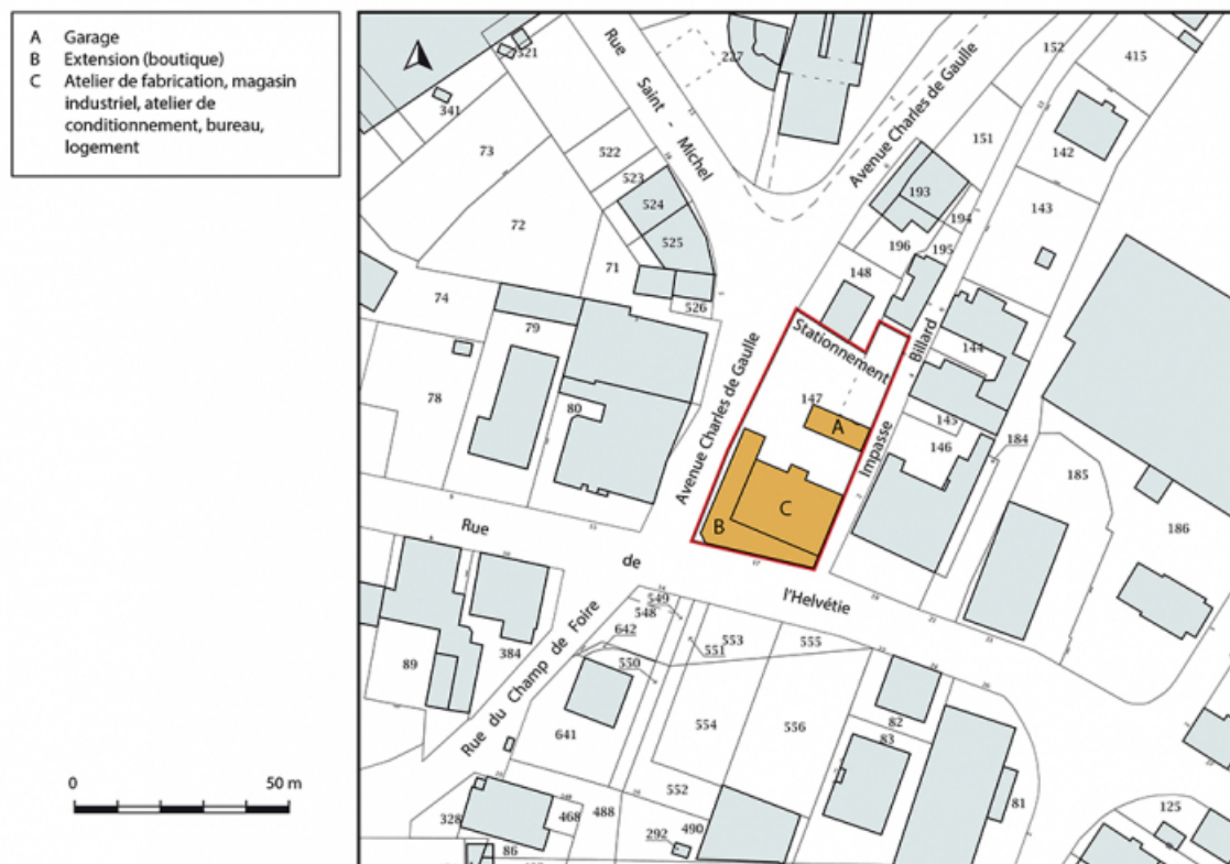
Plan-masse et de situation. Extrait du plan cadastral, 2017, section AF, 1/1 000. 25, Morteau, 17 rue de l' Helvétie