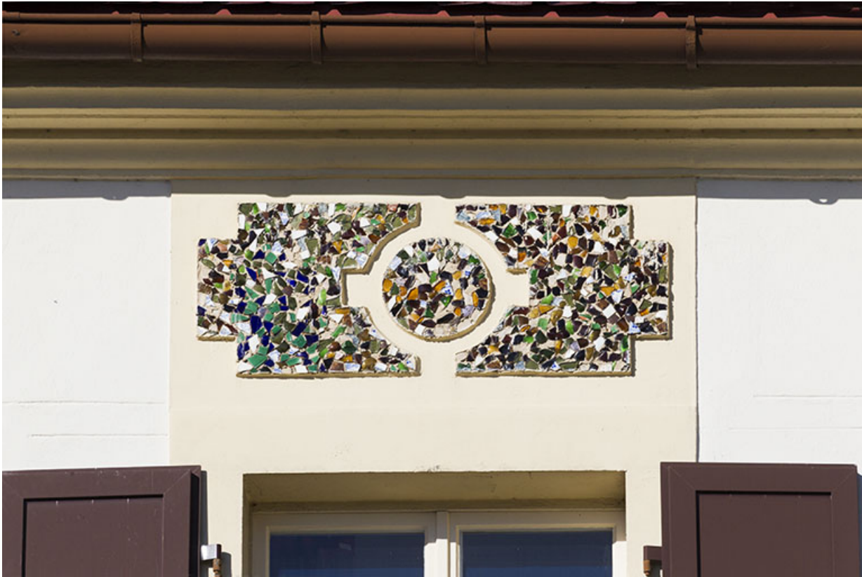
Dessus-de-fenêtre en mosaïque au dernier étage de la façade antérieure.