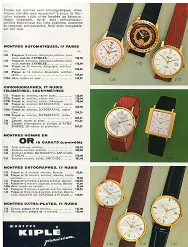
Exemples (et tarif) de montres Kiplé, années 1960.