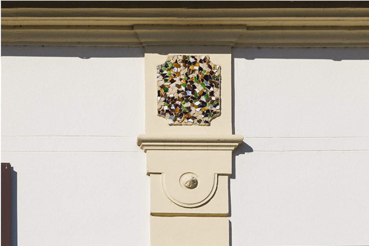
Décor de mosaïque au dernier étage de la façade antérieure.