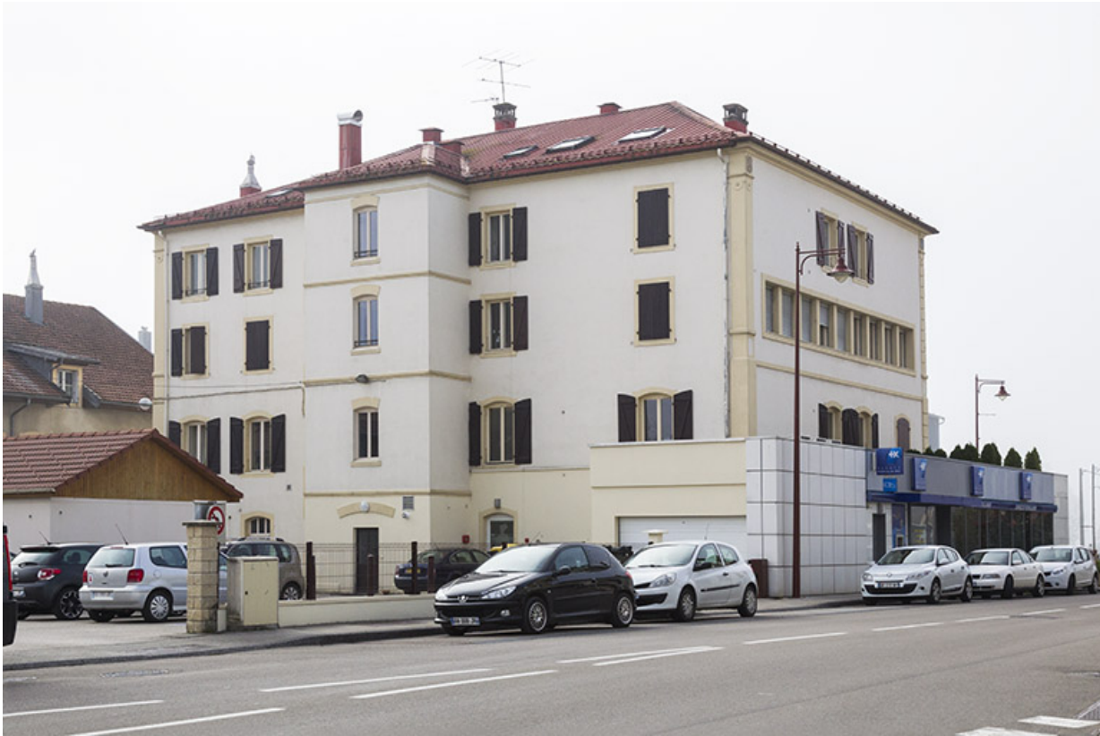
Façades postérieure et latérale gauche.