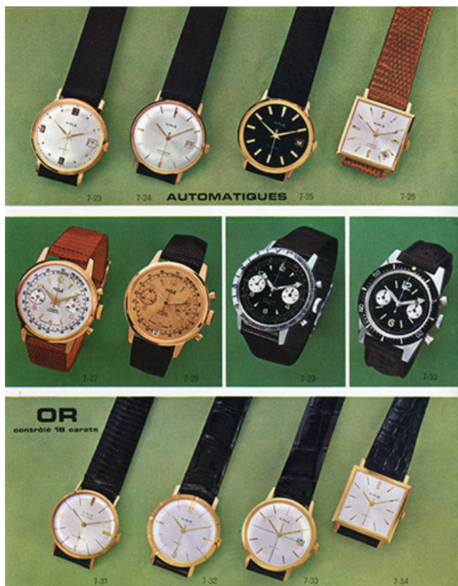
Exemples de montres Kiplé, années 1960.