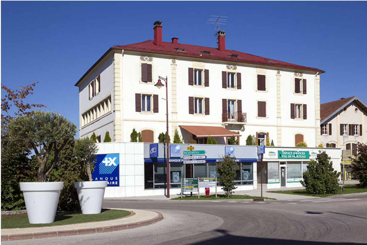
Façade antérieure, de trois quarts gauche.