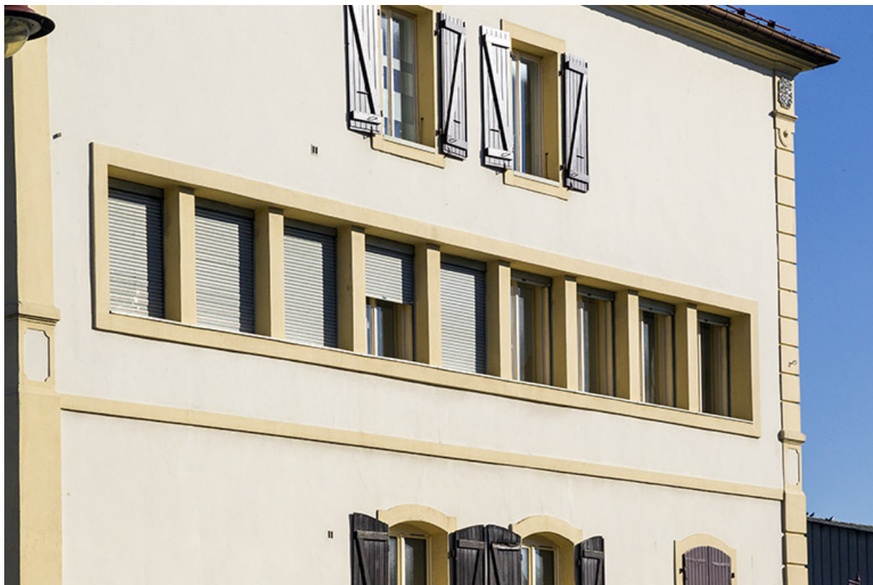
Fenêtres multiples sur la façade latérale gauche.